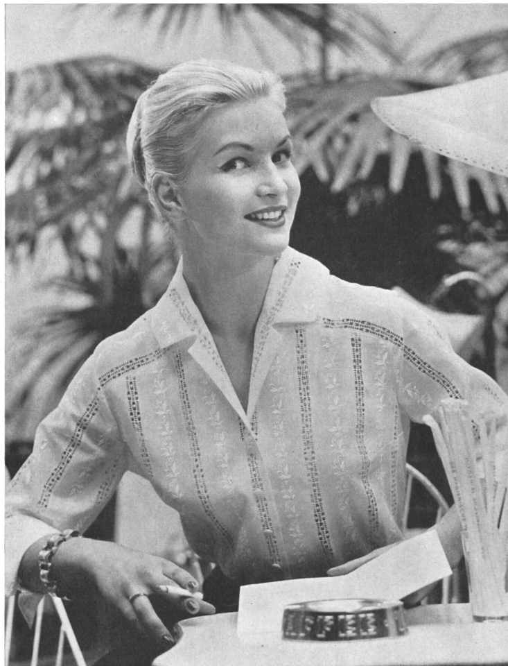
REICHENBACH & Co., SAINT-GALL Batiste brodée « Minicare ». Batist bestickt « Minicare ». Modell : Rositta, Wien.