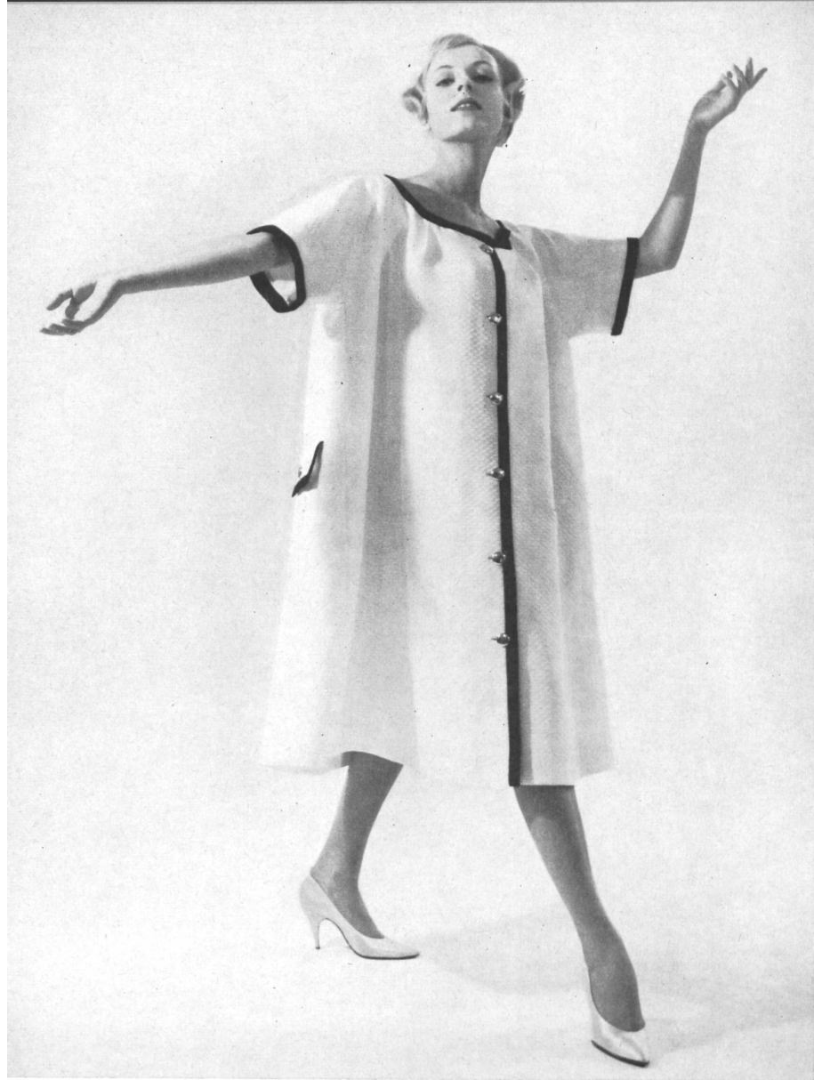
REICHENBACH & Co., SAINT-GALL Piqué. Modell : Heinz Oestergaard, Berlin.