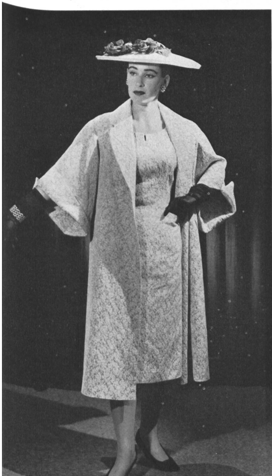
SILK MILLS NAEF BROTHERS Ltd., ZURICH

Crylor Carla. Model W. Selby & Co., Christ- church (N.Z.).