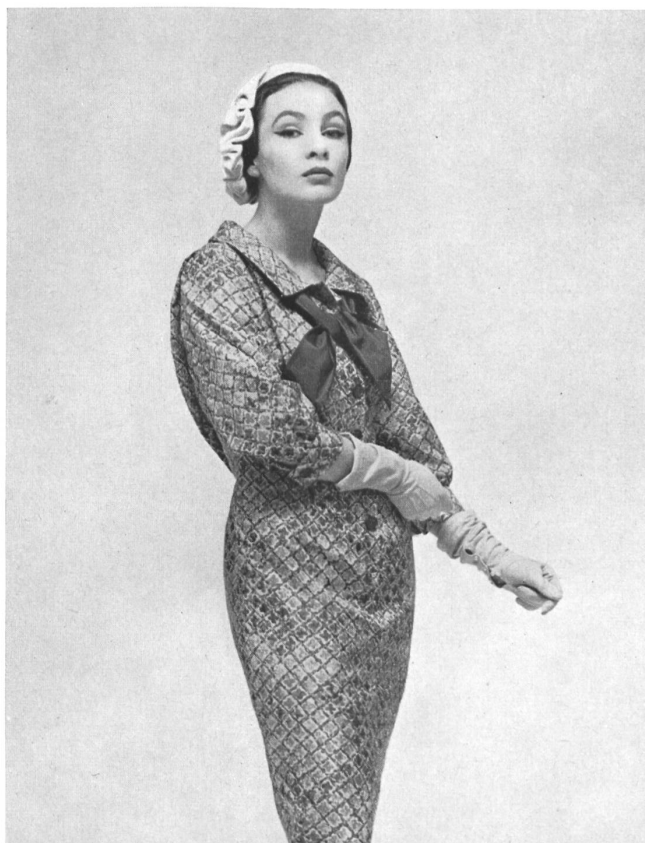
RUDOLF BRAUCHBAR & Cie A.G., ZURICH Bahia, printed pure silk fabric. Model E. Lucas & Co. Pty. Ltd., Melbourne