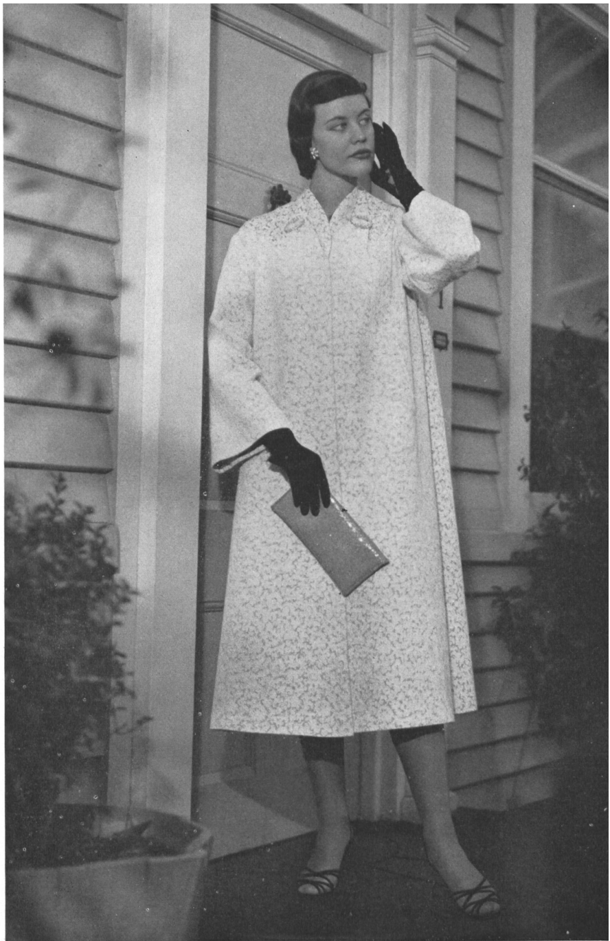
SILK MILLS NAEF BROTHERS Ltd., ZURICH

Crylor Carla. Model W. Selby & Co., Christ- church (N.Z.).