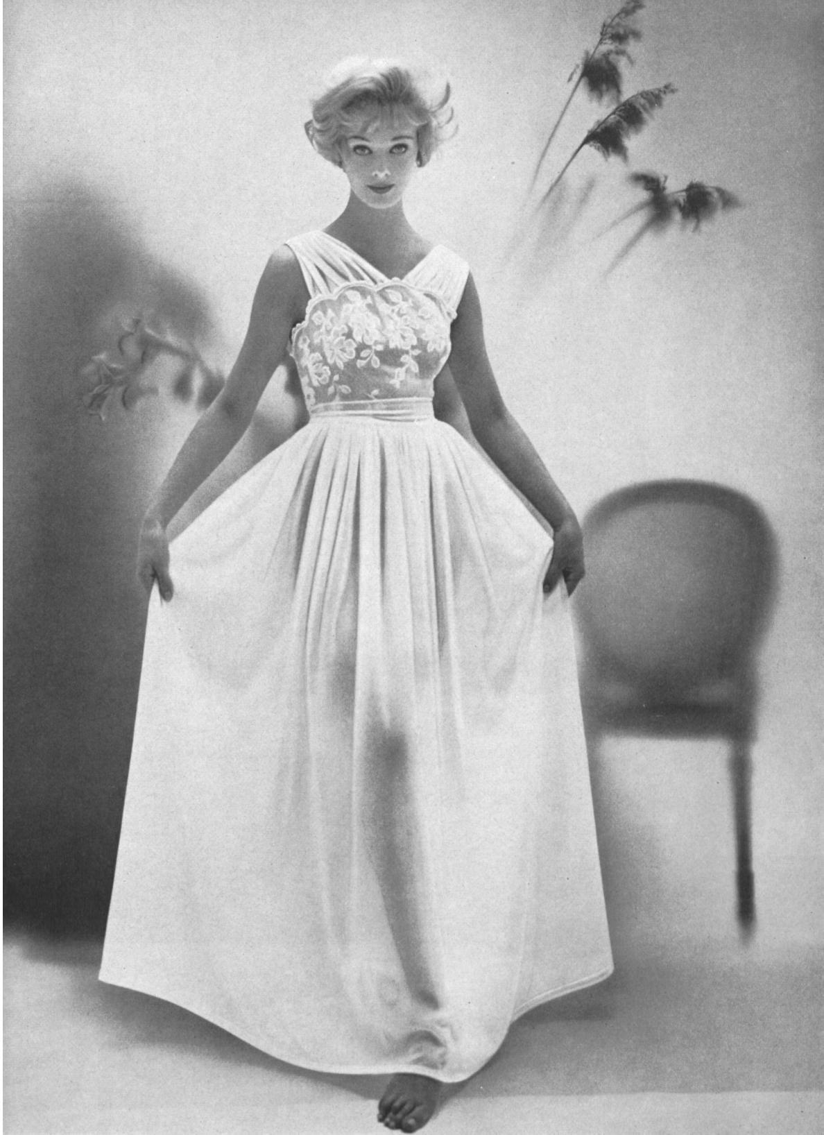
BISCHOFF TEXTIL A.G., ST. GALLEN Stickereien - Broderies. Nachthemd von : / Chemise de nuit de : Helfferich A.G., Neustadt (Deutschland).