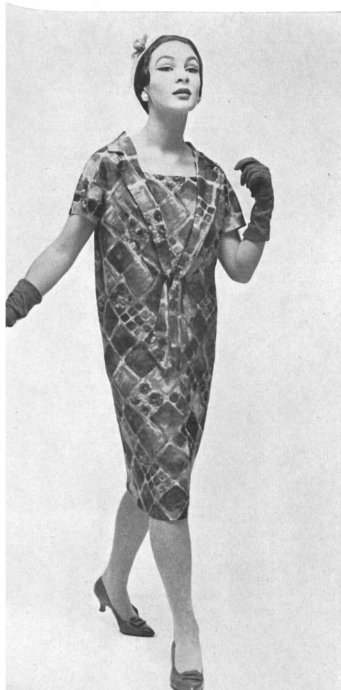
RUDOLF BRAUCHBAR & Cie A.G., ZURICH Caruca, printed pure silk fabric. Model E. Lucas & Co. Pty. Ltd., Melbourne.