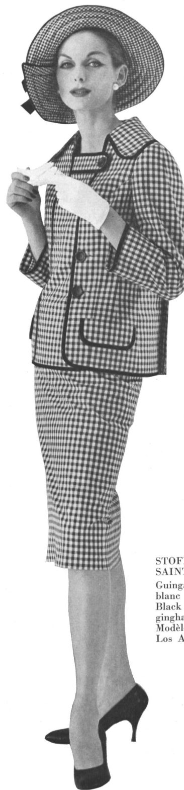
STOFFEL & CO., SAINT-GALL Guingan damier noir et blanc Black and white checked gingham Modèle : Galanos, Los Angeles

Depuis le new look, rien n'avait fait autant de bruit et de sensation que la ligne « chemise » ou « sac » ou comme voudront bien la nommer les créateurs, chroniqueurs ou autres intéressés.