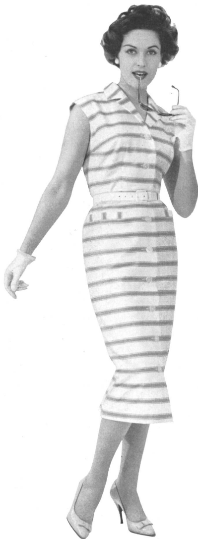
WINZELER, OTT & CIE S.A., WEINFELDEN Gabardine rayée en coton peigné mercerisé Gestreifte Gabardine aus mercerisierter gekämmter Baumwolle Modèle : Textilwerk Mann GmbH, Ludwigsburg