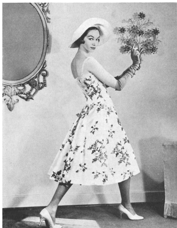
FORSTER WILLI & CO., SAINT-GALL Broderie de laine sur organdi de soie jaune Wollstickerei auf gelbem Seidenorgandy Robe de cocktail de : / Cocktailkleid von : Ritter-Modelle, Hambourg