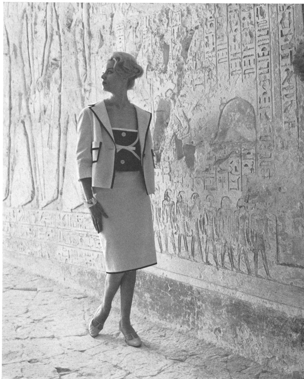
CHRISTIAN FISCHBACHER CO., SAINT-GALL Tissu de coton genre lin Baumwolle in Leinencharakter Modèle : Heinz Oestergaard, Berlin

gaard collabore depuis longtemps avec une des plus grandes corsetteries d'Europe).