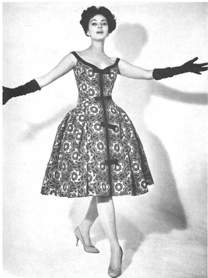
JACOB ROHNER S.A., REBSTEIN Broderie Lurex or sur organdi noir Lurex Goldstickerei auf schwarzem Organdy Modèle : Heinz Oestergaard, Berlin