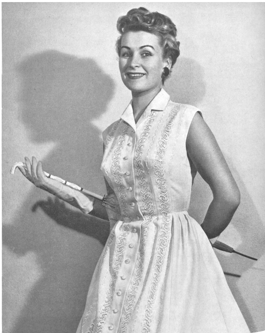
JACOB ROHNER S.A., REBSTEIN Broderie ton sur ton sur crêpe de coton blanc «Minicare» Ton auf Ton Stickerei auf weissem «Minicare» Baumwollcrepe Modèle : Thiele-Förster