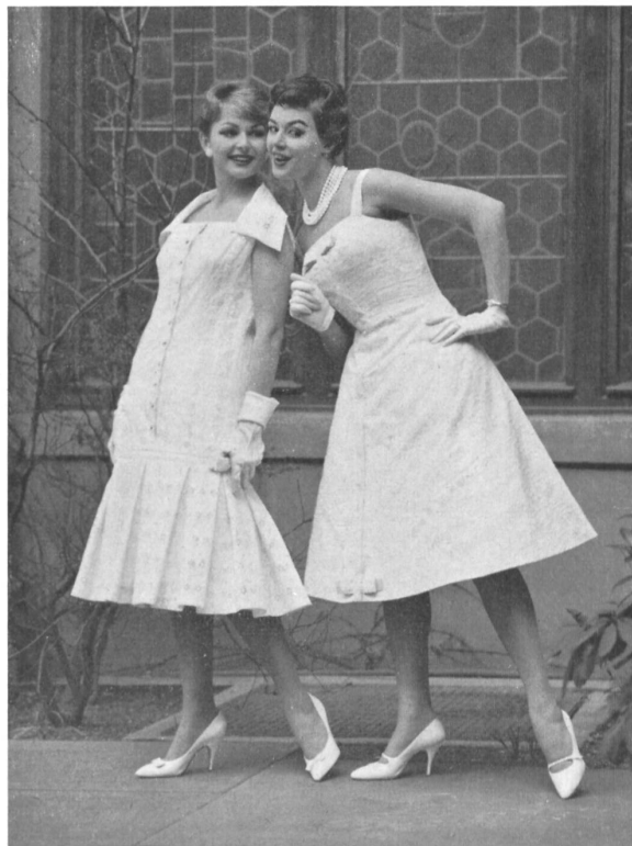
WALTER SCHRANK & CO., SAINT-GALL Batiste de lin brodée Leinenbatist mit Stickerei Modèle : Toni Schiesser, Francfort s.M.