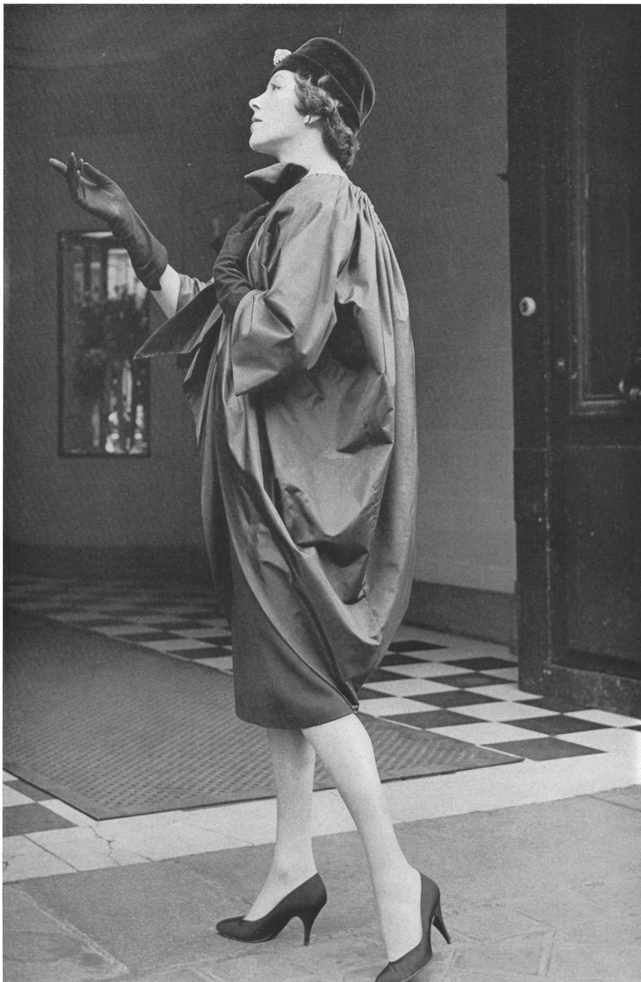
JACQUES GRIFFE Taffetas de soie marine de la Société Anonyme Stünzi Fils, Horgen