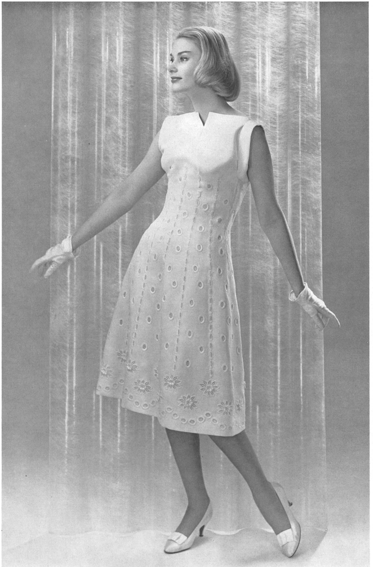
CARVEN Broderies de guipure de Aug. Giger & Co., Saint-Gall