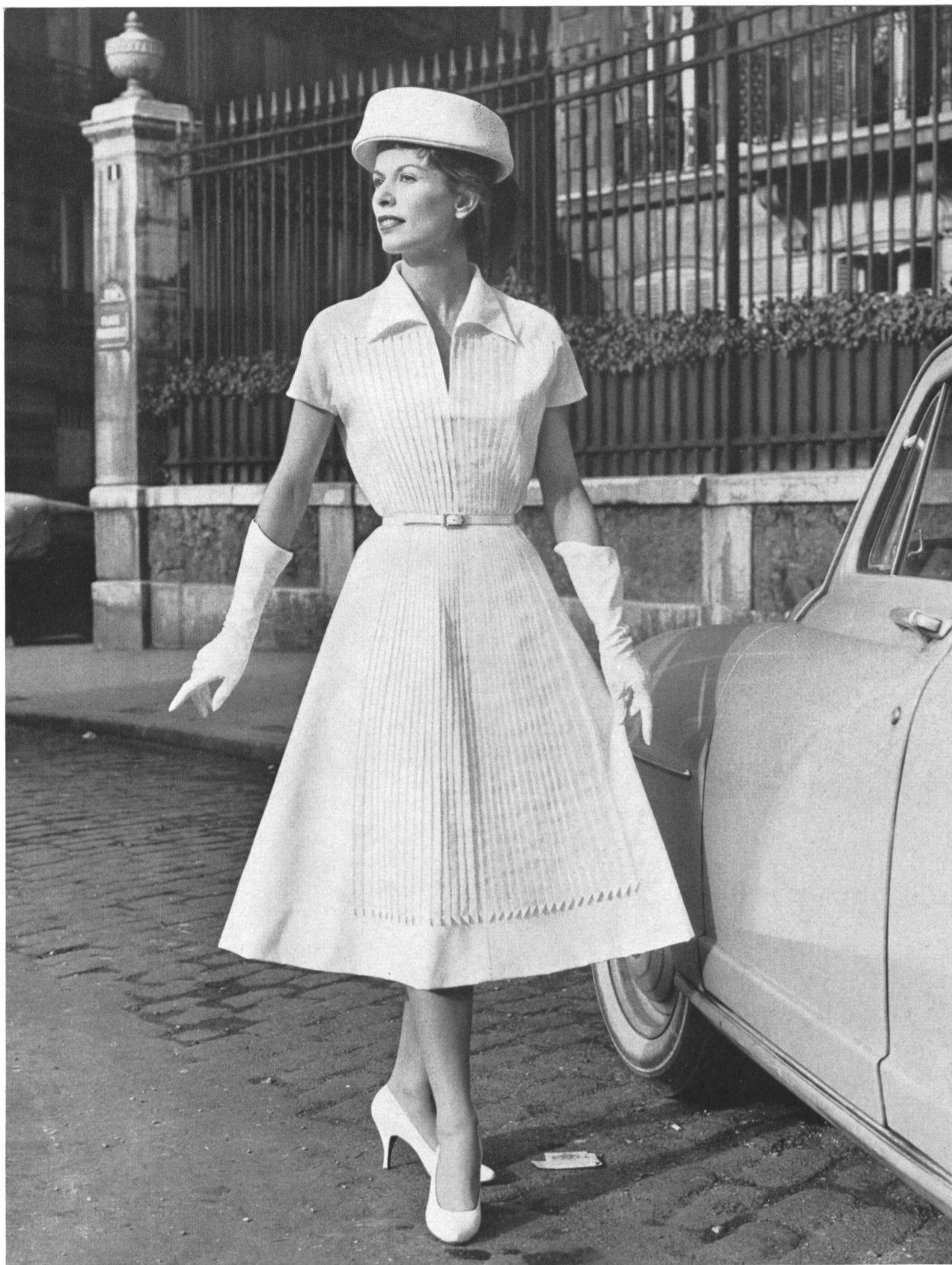
MANGUIN « Recoliton » de Reichenbach & Co., Saint-Gall Montex, Paris