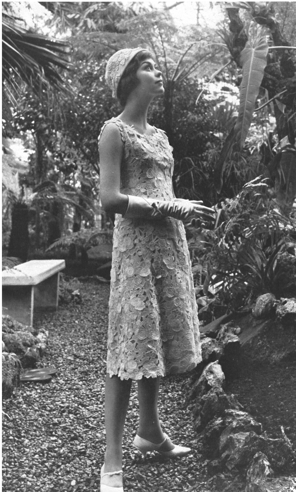
CHRISTIAN DIOR Dentelle en fleurs détachées travaillée en organdi et tulle de Forster Willi & Co., Saint-Gall Grossiste à Paris: Les Tisseurs B de M