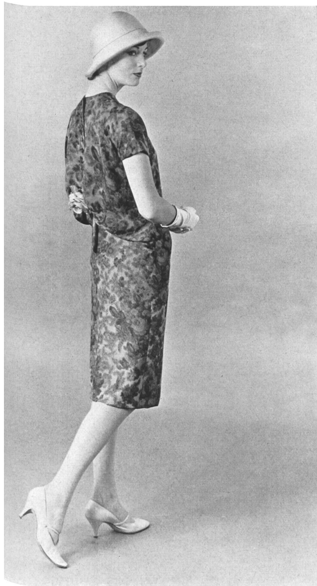
PIERRE CARDIN Mousseline « Frivole » imprimée de L. Abraham & Cie, Soieries S. A., Zurich

Tous les documents de Paris reproduits dans ce numéro représentent des modèles réservés dont la reproduction est interdite