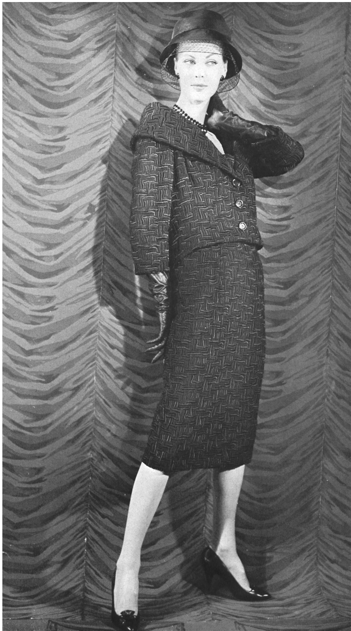
PIERRE CARDIN Broderie laine et rayonne de Forster Willi & Co., Saint-Gall Grossiste à Paris: Robert Burg & Cie, S.à.r.l.