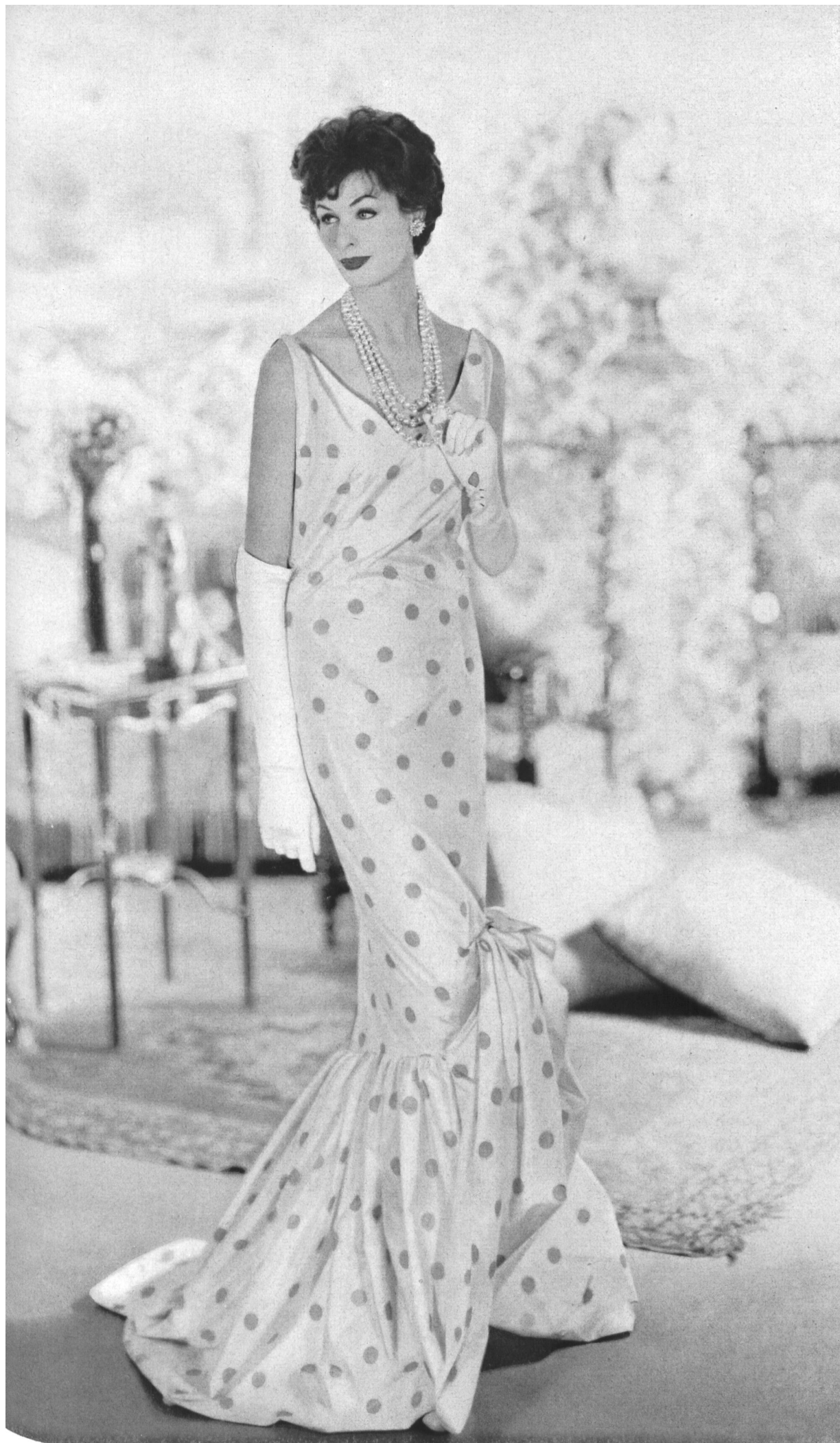
PIERRE BALMAIN Taffetas chiné de L. Abraham & Cie, Soieries S.A., Zurich