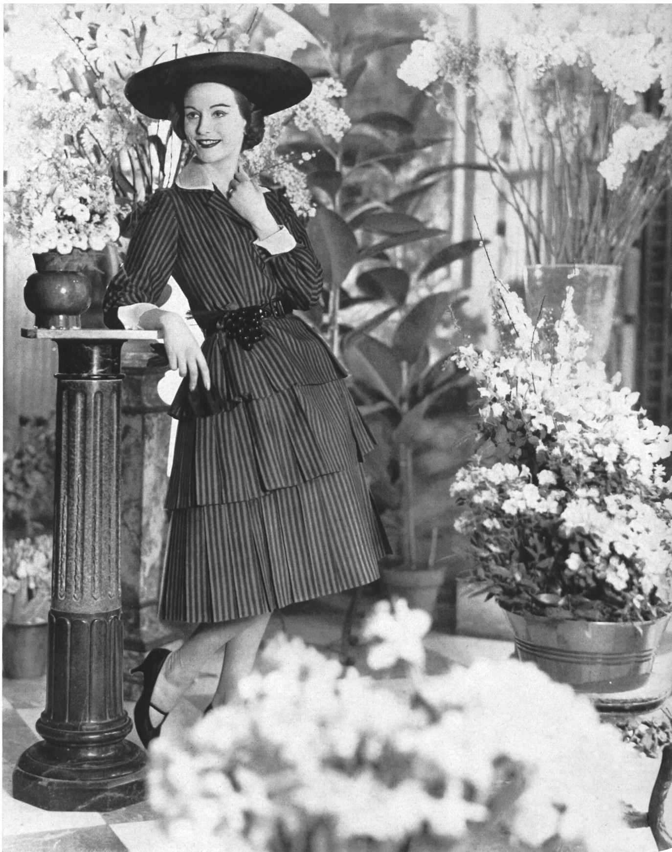
PIERRE BALMAIN Super Miyako rayé de L. Abraham & Cie, Soieries S.A., Zurich