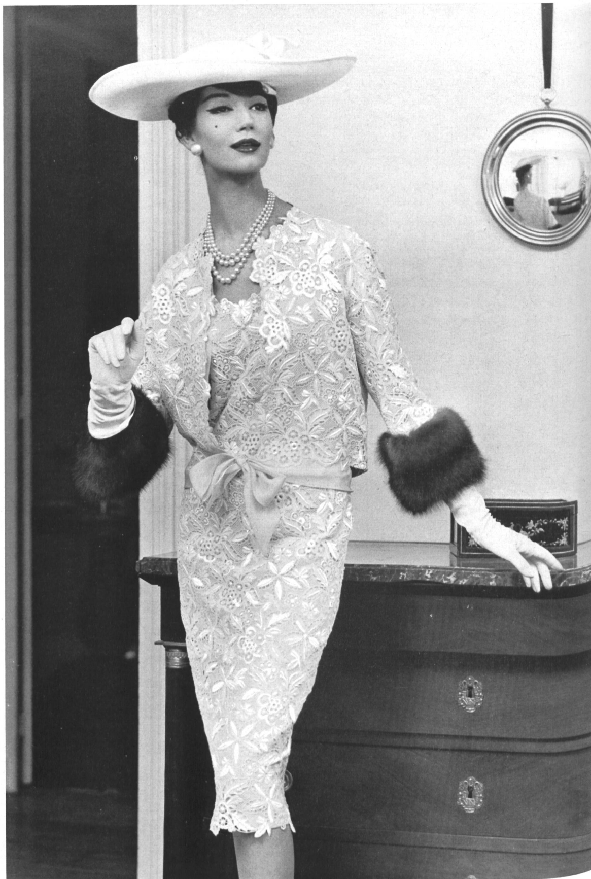
PIERRE BALMAIN Guipure de Forster Willi & Co., Saint-Gall Grossiste à Paris: Pierre Brivet, S.à r. l.