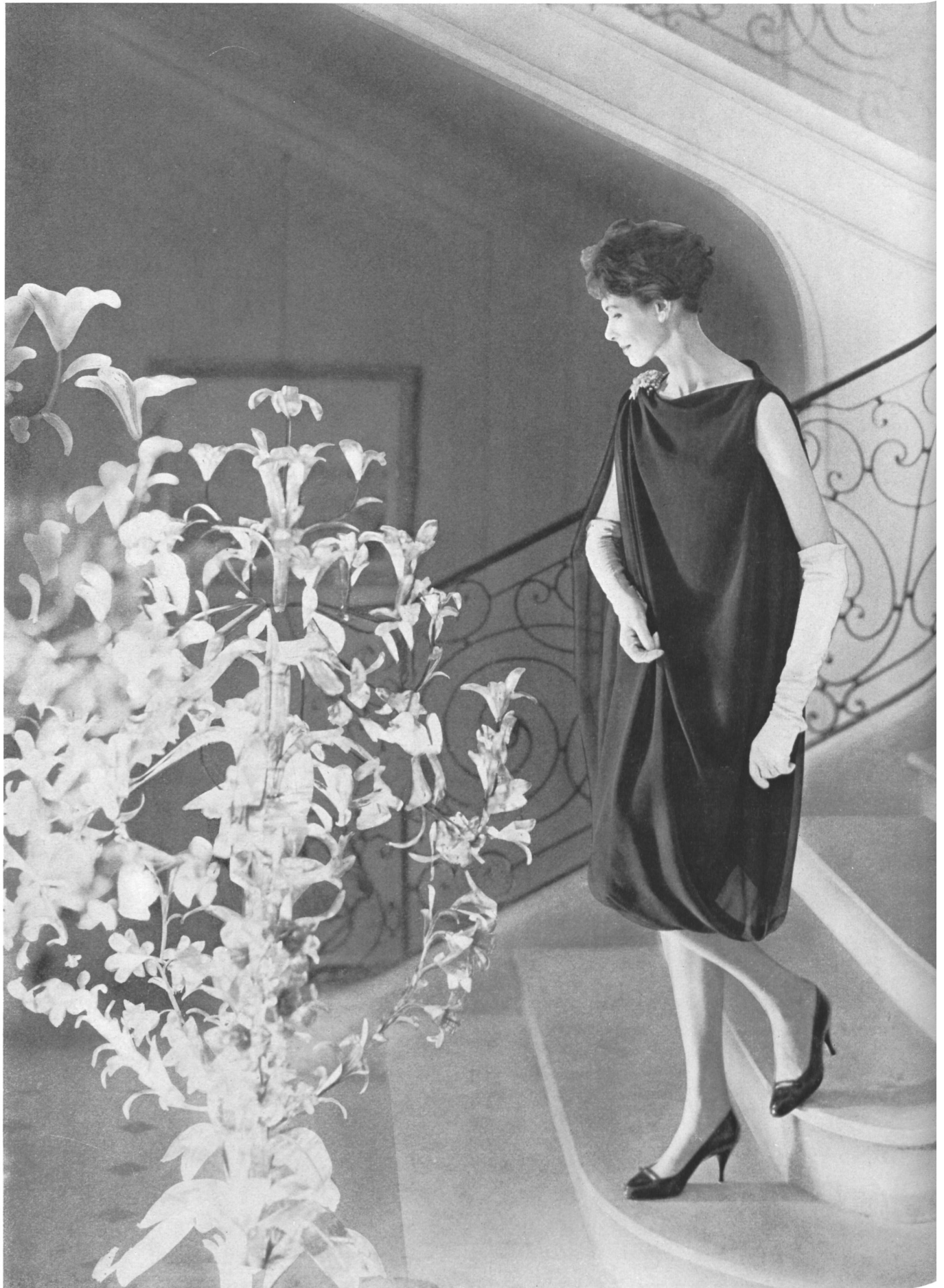
PIERRE CARDIN Mousseline «Follette» de L. Abraham & Cie, Soieries S.A., Zurich