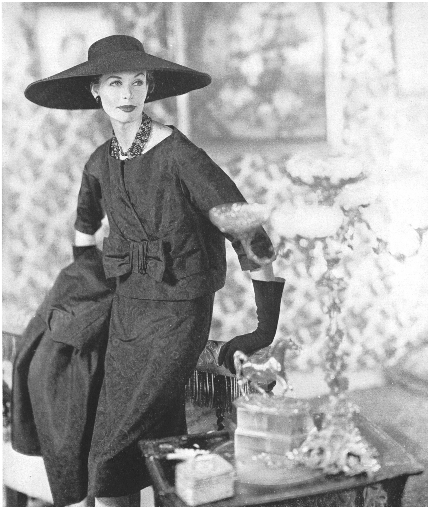
CHRISTIAN DIOR Faïlle chinée de L. Abraham & Cie, Soieries S.A., Zurich