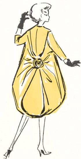
PIERRE CARDIN : manteau du soir en satin duchesse bleu turquoise ; rose du même tissu.

Toutes les collections sont sous le signe du trompe-l'œil. Et cela peut sans doute s'expliquer. La génération actuelle des modélistes est l'enfant du surréalisme. Elle est née après lui, mais elle a eu comme classiques les œuvres écrites, peintes, ou sculptées de cette école. Toute jeune, elle était déjà familière avec la Girafe en feu de Salvador Dali, que veille la femme aux cuisses hérissées de tiroirs. Elle a connu la ruée vers les antiquaires, la recherche des objets qui ne sont pas ce à quoi ils ressemblent. Et placée dans une époque où l'actualité et le souci du neuf sont des impératifs dévorants, elle retourne à ses sources. Ce n'est d'ailleurs pas la première fois que la couture s'évade de la simple notion du vêtement pour accéder à la fantaisie. Ce qui est nouveau, c'est la totalité de cette évolution : lorsque Poiret, un peu avant la guerre de 14, faisait scandale et bouleversait le petit univers des couturiers par ses conceptions hardies, c'était déjà le même élan spirituel qui l'animait. Paul Poiret eut le sort des précurseurs et le feu d'artifice retomba après les dernières fusées, mais les étincelles n'étaient éteintes qu'en apparence. Sous l'aiguillon de la demande mondiale de renouvellement, harcelés par la confection de luxe qui a fait des progrès remarquables, les jeunes modélistes, qui tous se connaissent, dont beaucoup sont amis, qui constituent une véritable école de Paris