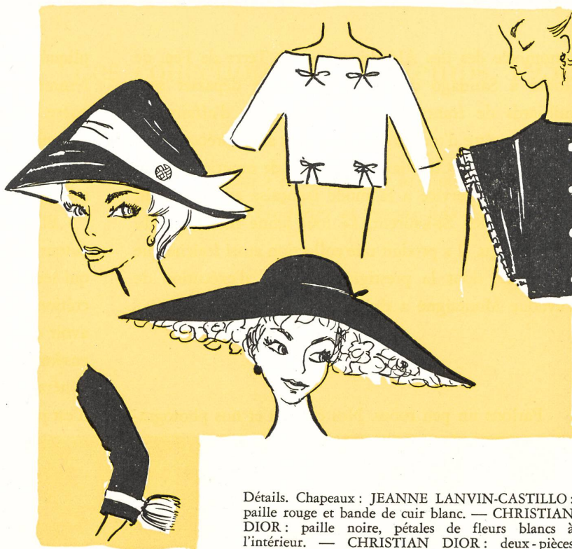
Détails. Chapeaux : JEANNE LANVIN-CASTILLO : paille rouge et bande de cuir blanc. — CHRISTIAN DIOR : paille noire, pétales de fleurs blancs à l'intérieur. — CHRISTIAN DIOR : deux-pièces avec quatre petits nœuds. — JEANNE LANVIN-CASTILLO : manche double avec tuyauté. — CHANEL : pompon de laine blanche et noire sur jersey noir.

PIERRE BALMAIN : organdi de soie blanc : le corsage ; organdi de soie noir sur blanc : la jupe. — PIERRE CARDIN : robe en lainage parme avec panneau détaché drapé dans le dos. — JEANNE LANVIN-CASTILLO : crêpe noir avec « ailes » en organdi blanc, chapeau vert absinthe.