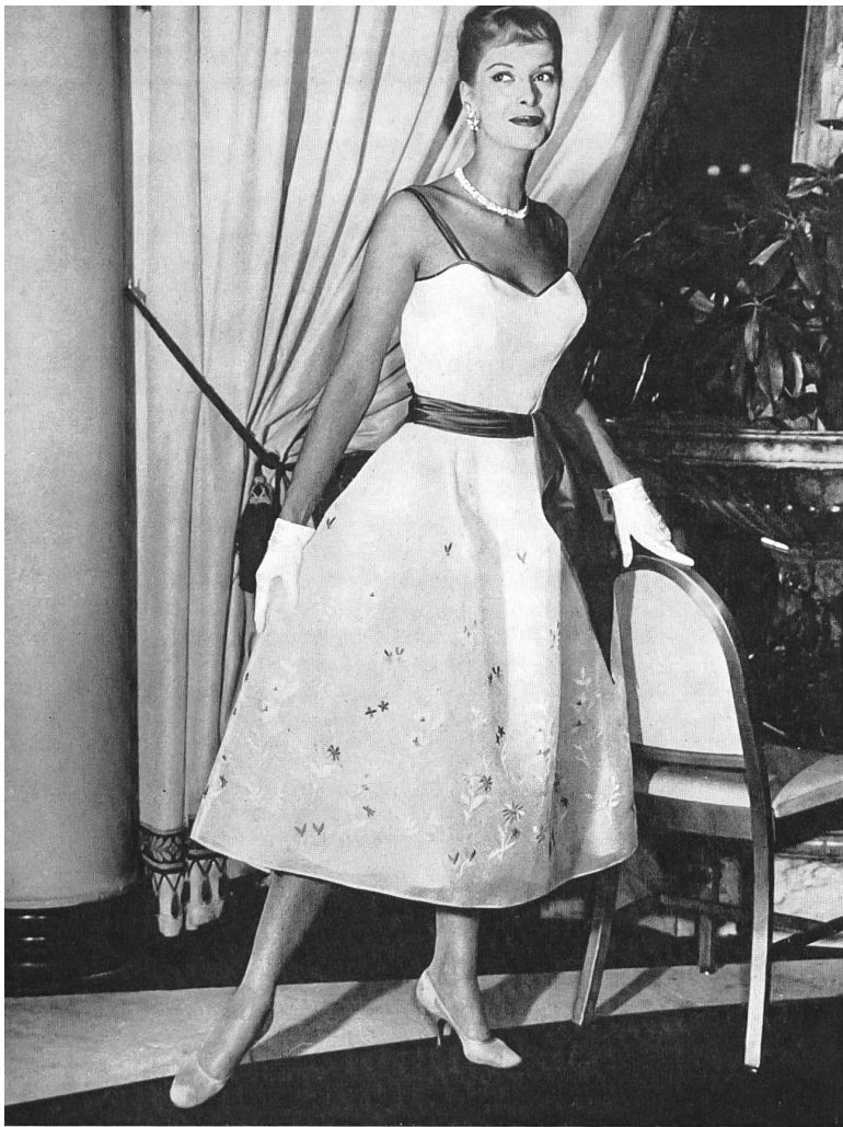
Embroidered white organdy with permanent finish. Model by Doge Separates, New York

tôt que de le trouser comme le fait la broderie ajourée, dite anglaise. Le dessin devient très important, ainsi que le choix des couleurs. En broderie, comme en impression, le dessin enrichi par la couleur peut se renouveler indéfiniment, tout en suivant progressivement les tendances changeantes de la mode. L'usage de plusieurs couleurs ouvre des horizons nouveaux à la broderie, qui n'a plus aucune raison de se stéréotyper dans les modèles classiques de broderies blanches, genre né durant les jeunes années de la reine Victoria, et répété avec succès jusqu'à nos jours.