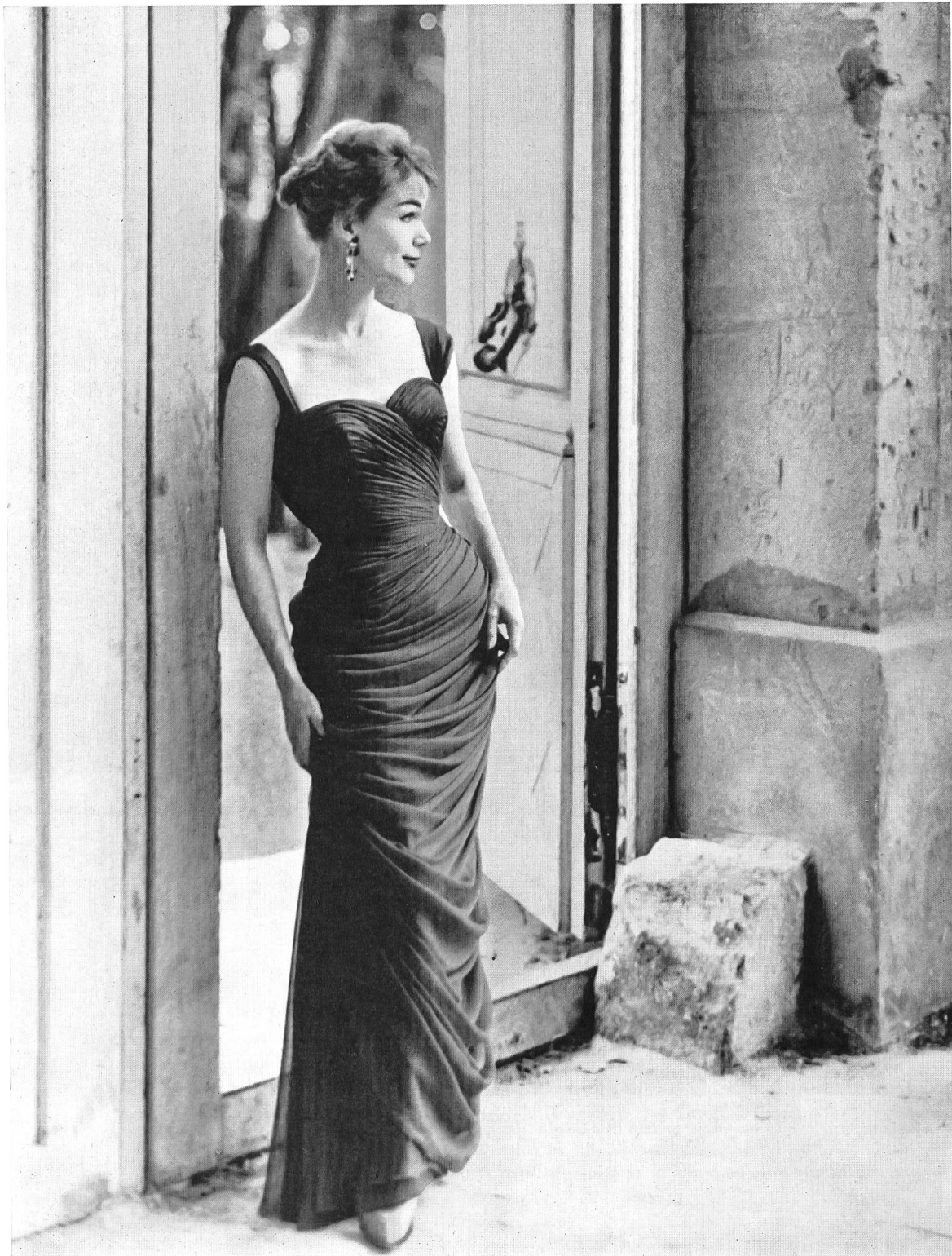
PIERRE BALMAIN Mousseline « Follette » de L. Abraham & Cie, Soieries S. A., Zurich