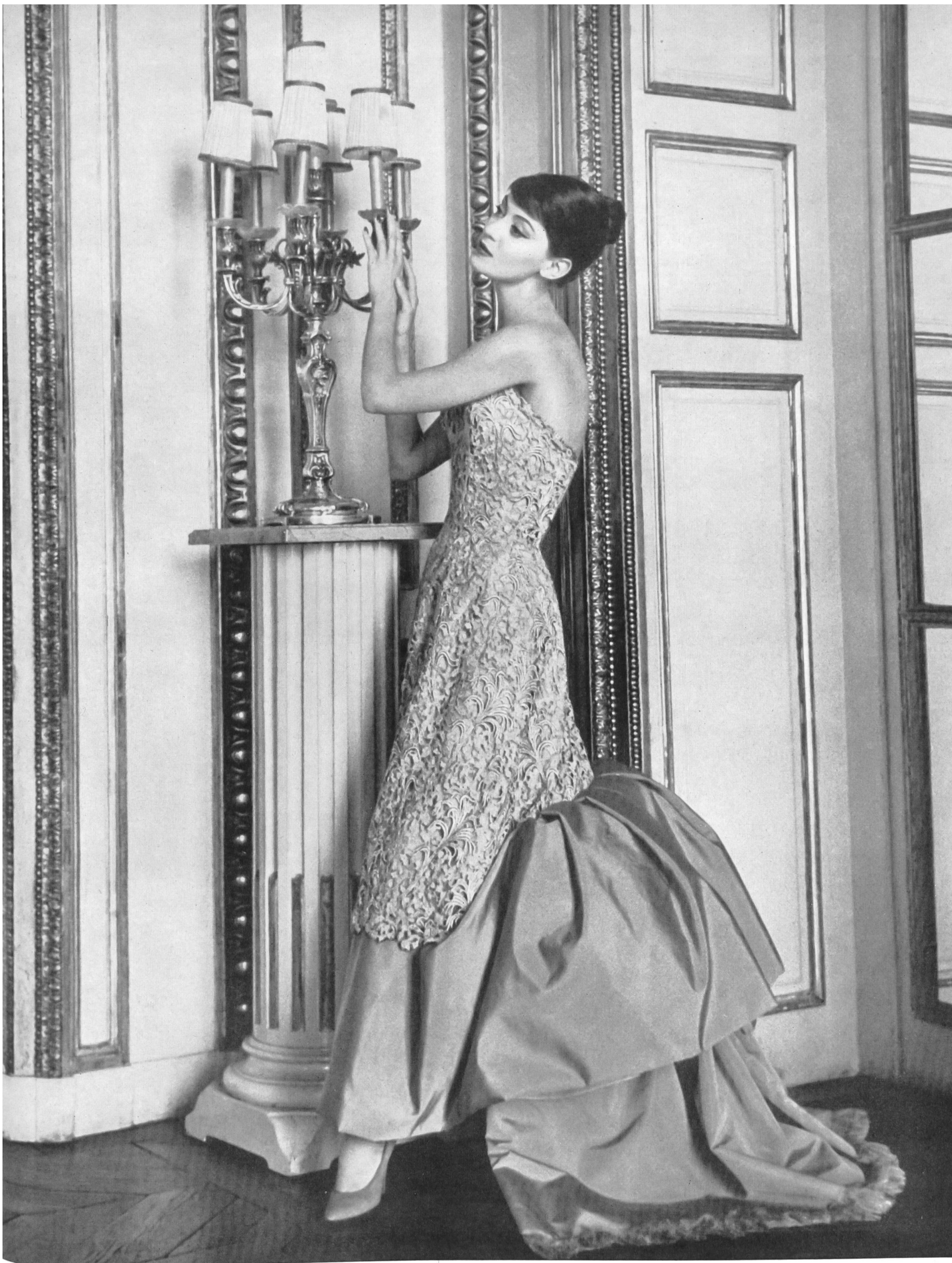
JEAN DESSES Guipure en lamé or de Forster Willi & Co., Saint-Gall Grossiste à Paris : Les Tisseurs B de M