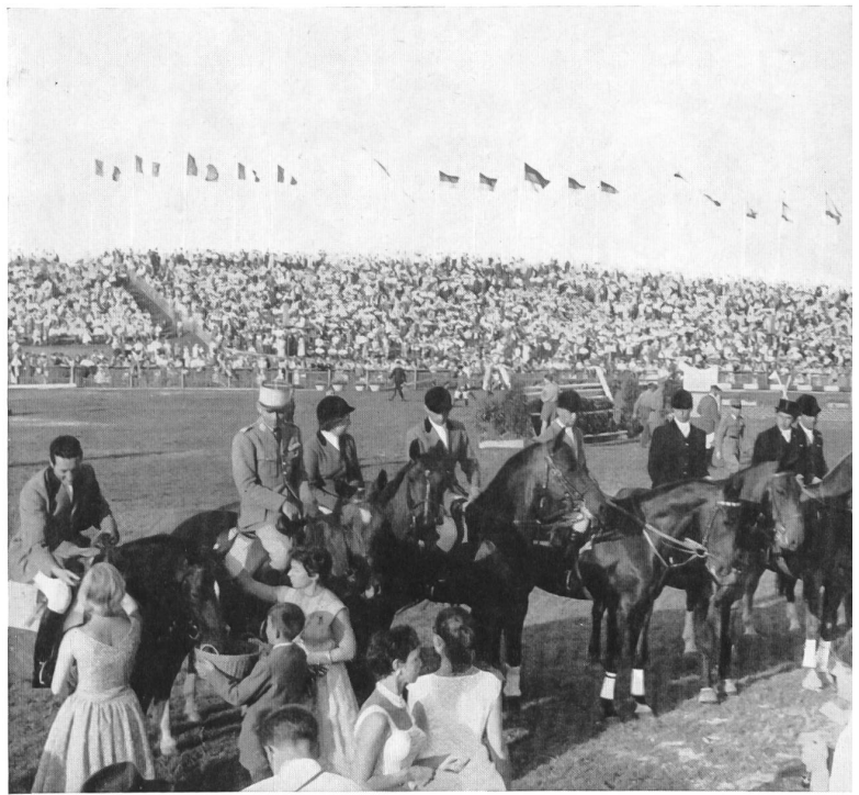
Prix des Banques saint-galloises, les vainqueurs.