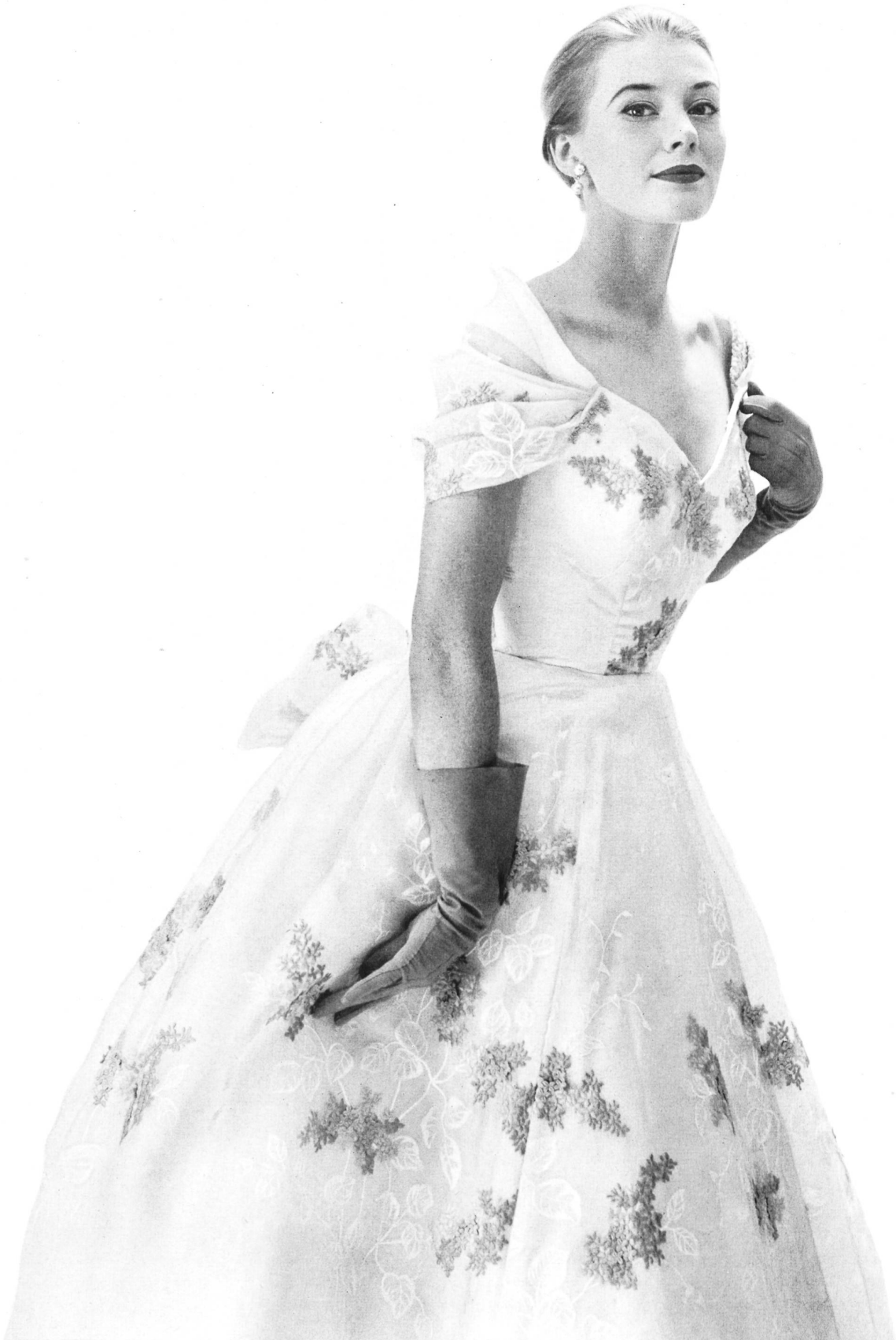
A. Naef & Cie, Flawil Organdi blanc brodé. White embroidered organdy. Organdi blanco bordado. Bestickter, weisser Organdi. Modèle: Algo, Zurich.