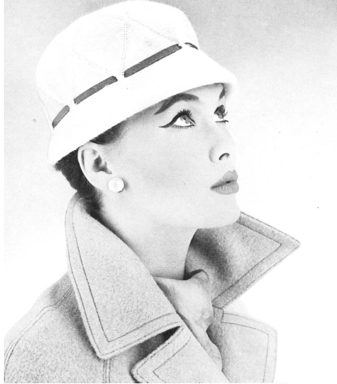
Cloche de mélusine avec ruban gros-grain et piqûres. Modèle suisse. Melusine cloche with grosgrain ribbon and stitching. Swiss model. Sombrero « cloche », de melusina con cinta de grosgrén y puntadas. Modelo suizo. Kleine Melusine-Cloche mit Grosgrainband und Steppgarnitur. Schweizer Hutmodell.

Le chapeau de feutre règne sur la mode d'hiver. Feutre souple et doux au toucher, ou terne dans le genre chiné avec un léger duvet de poils courts, mélusines brillantes comme de la soie. Toques drapées, casques arrondis couvrant les tempes ou volumineux et étirés en largeur. Vogue de ce qu'on appelle les « fausses nuances » en noir et en blanc : noir avec des reflets verdâtres ou bleuâtres, gris vert, blanc argenté, ou vert jaunâtre. Autres couleurs à la mode : bronze et vert chasseur, violet et prune, beige sable et brun, rouge vif et jaune très vif. Matières, formes et couleurs qui donnent aux chapeaux une allure très vivante.