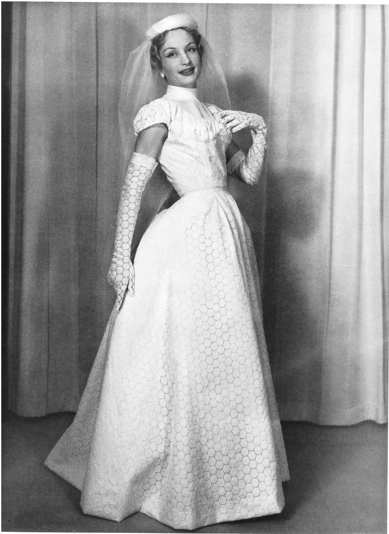
CHARLES MONTAIGNE Batiste brodée de Reichenbach & Co., Saint-Gall Montex, Paris