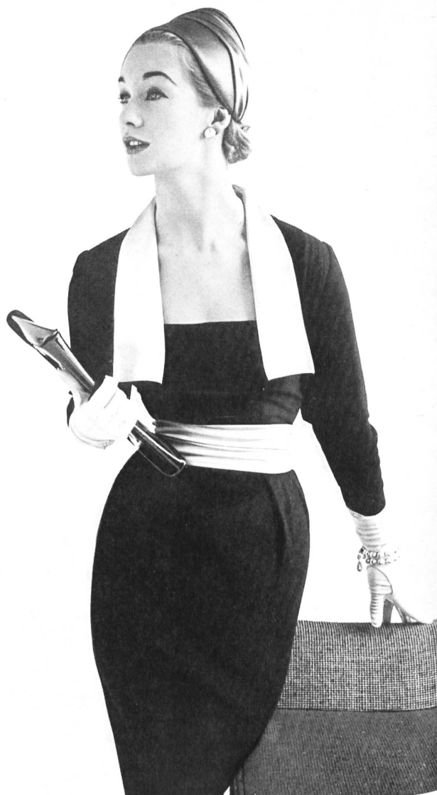
L. ABRAHAM & Co., SILKS Ltd., ZURICH

Dans les salons d'un des principaux importateurs de prêt à porter suisse, j'ai vu un certain nombre de collections de divers fabricants bien connus et qui se sont spécialisés dans la production de qualité. Il y avait un merveilleux deux-pièces (Egeka), parfait pour les soirées de