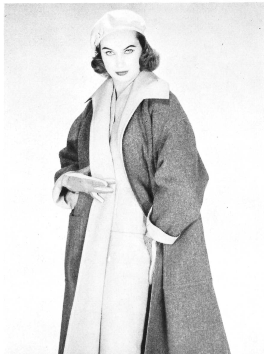
Tailleur en lainage fan- taisie ; manteau de voyage réversible tweed et gabardine