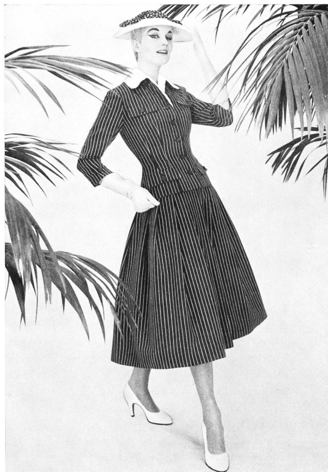
Ensemble robe-jaquette en fresco bleu et blanc

C'est ce dont on put se rendre compte lors de la manifestation en question, en examinant les étalages de tissus de laine artistement disposés et au cours du défilé.