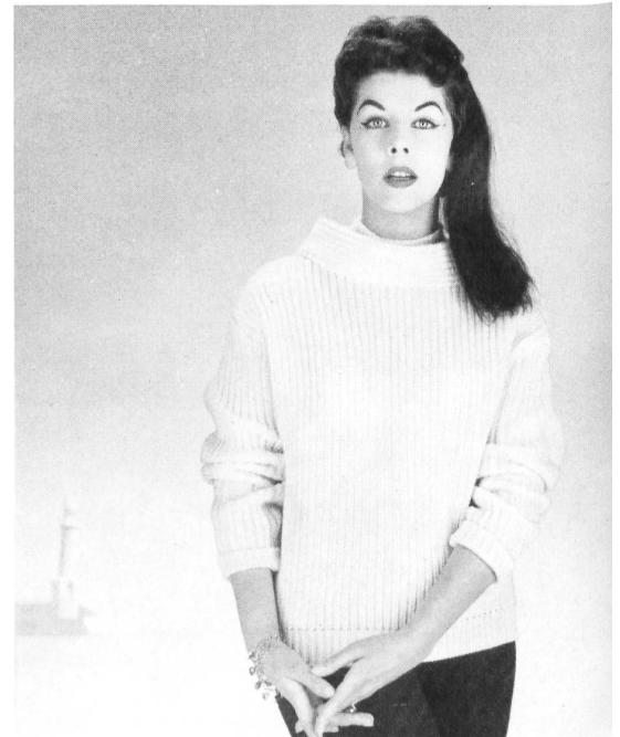
Pullover marin en tricot genre main

Nous reproduisons ici quelques-uns des nombreux modèles admirés à cette occasion.