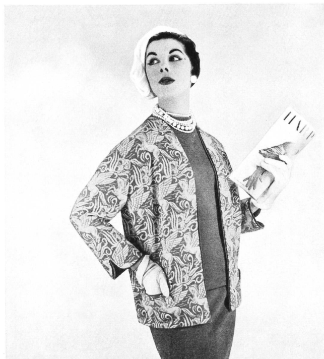
Ensemble trois-pièces en tricot wevenit-Jacquard