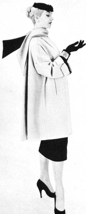
Manteau 7/8 en drap ficelle