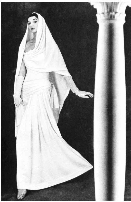
Robe du soir en jersey de laine blanc