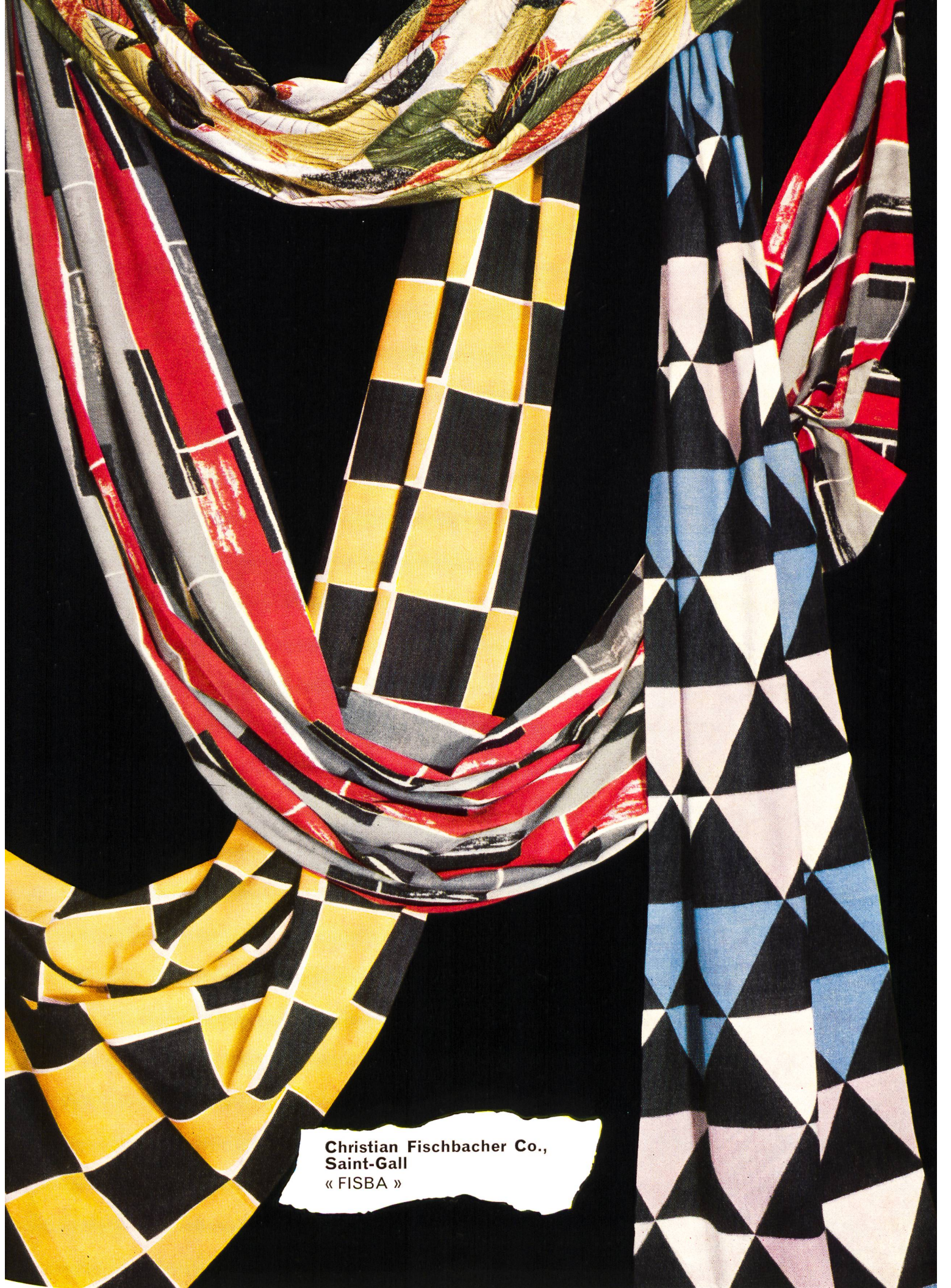
Christian Fischbacher Co., Saint-Gall « FISBA »