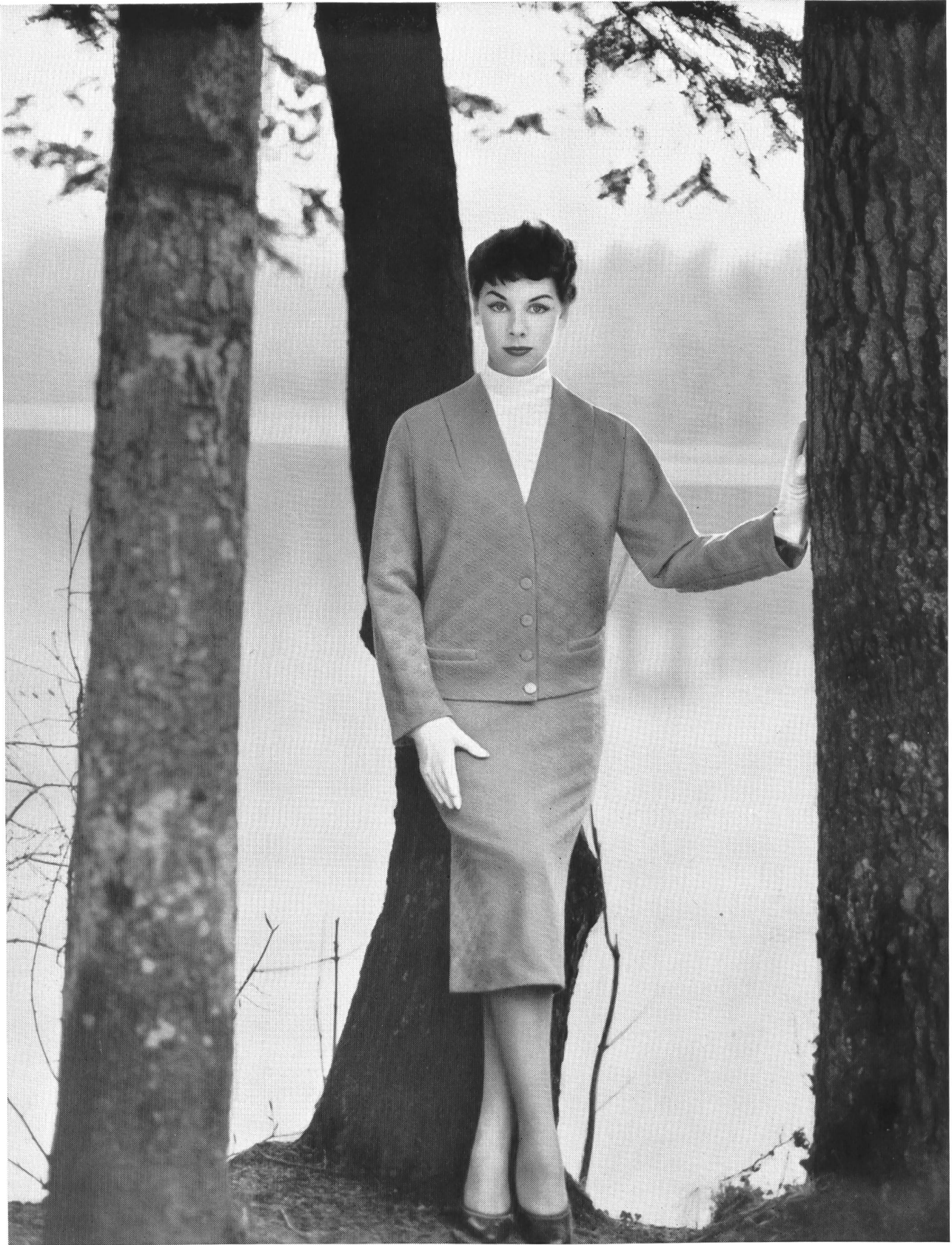
Ruepp & Cie S.A., Sarmenstorf « ALPINIT » Tricots et jerseys