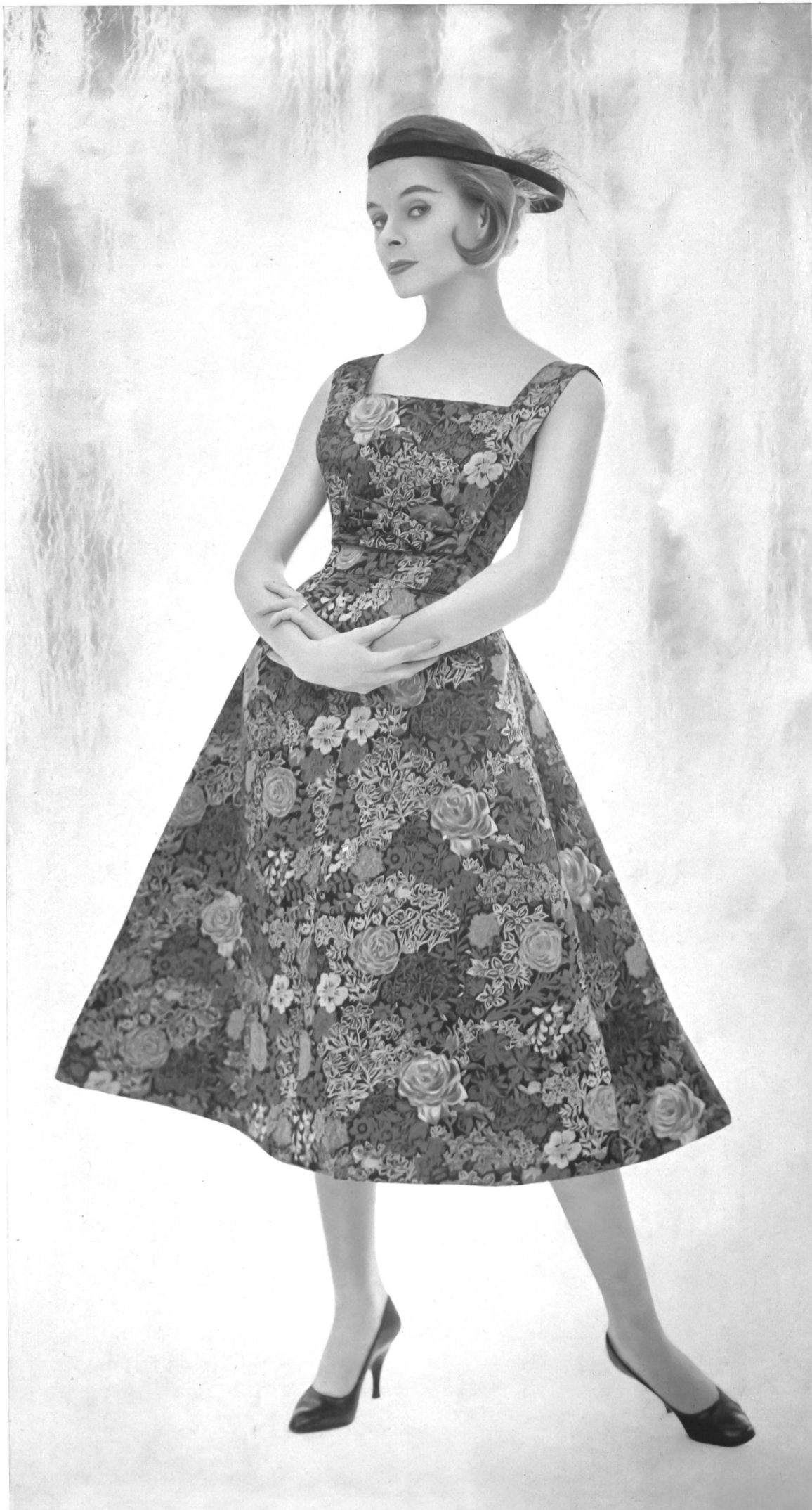
Rose Bertin S.A., Zurich Robe de cocktail en satin imprimé. Printed satin cocktail dress. Traje de cóctel de satén estampado. Cocktailkleid aus bedruck- tem Satin.