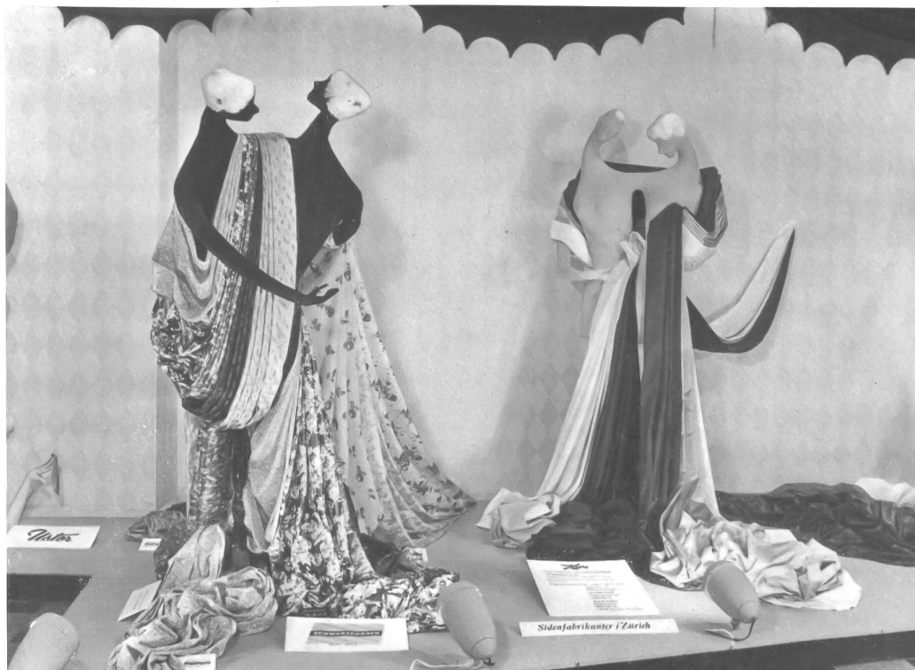
Un aspect de l'exposition de l'industrie des soieries.