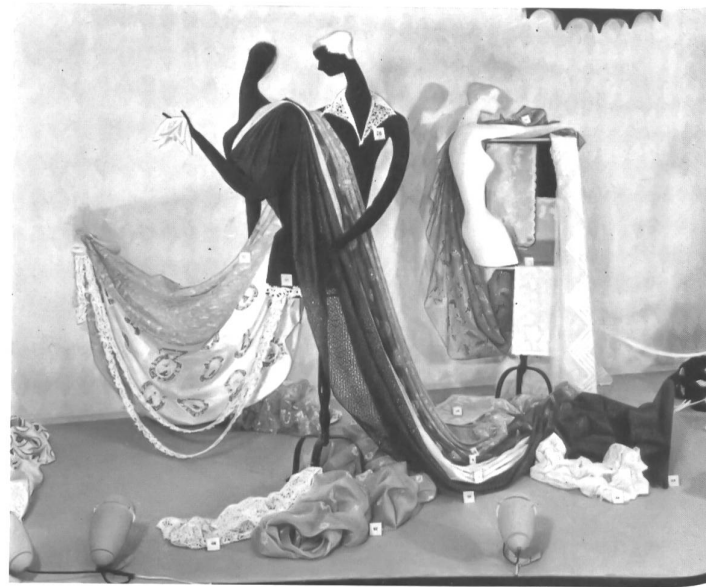
Broderies et cotons fins de Saint-Gall.

La « Semaine Suisse » de Stockholm a été un succès. Espérons qu'elle contribuera à développer durablement les relations commerciales suédo-suisse, comme le vœu en a été exprimé.