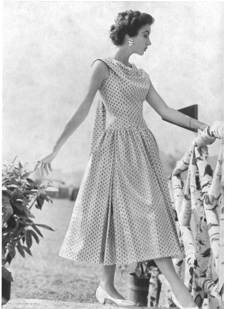
NELO - Silcosa Disciplined