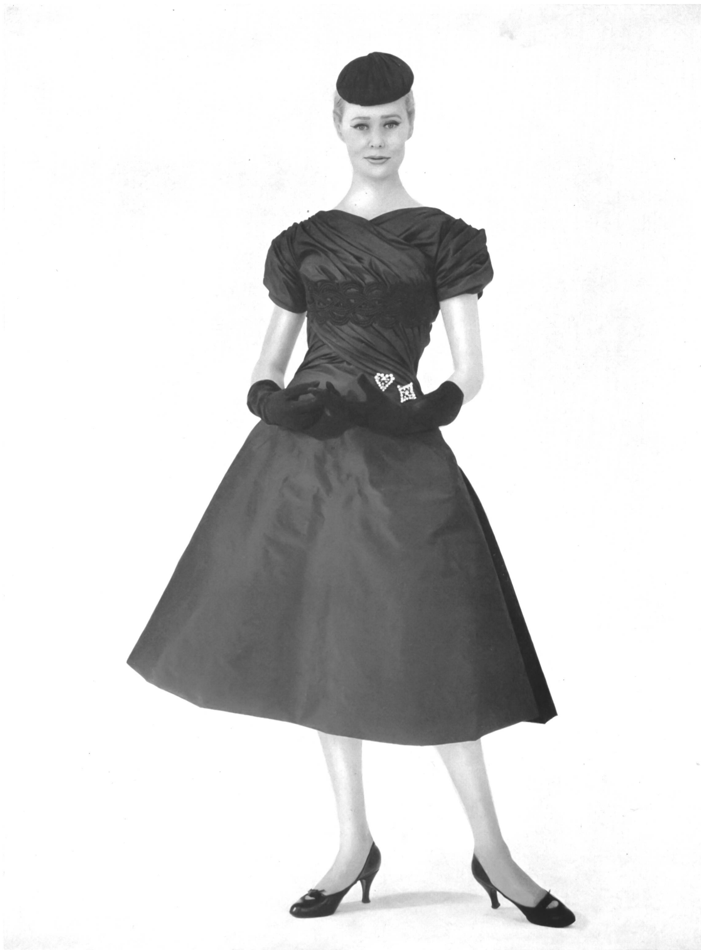
JEAN PATOU Garniture de galon brodé de A. Naef & Cie, Flawil. Placé par Inamo, Zurich.