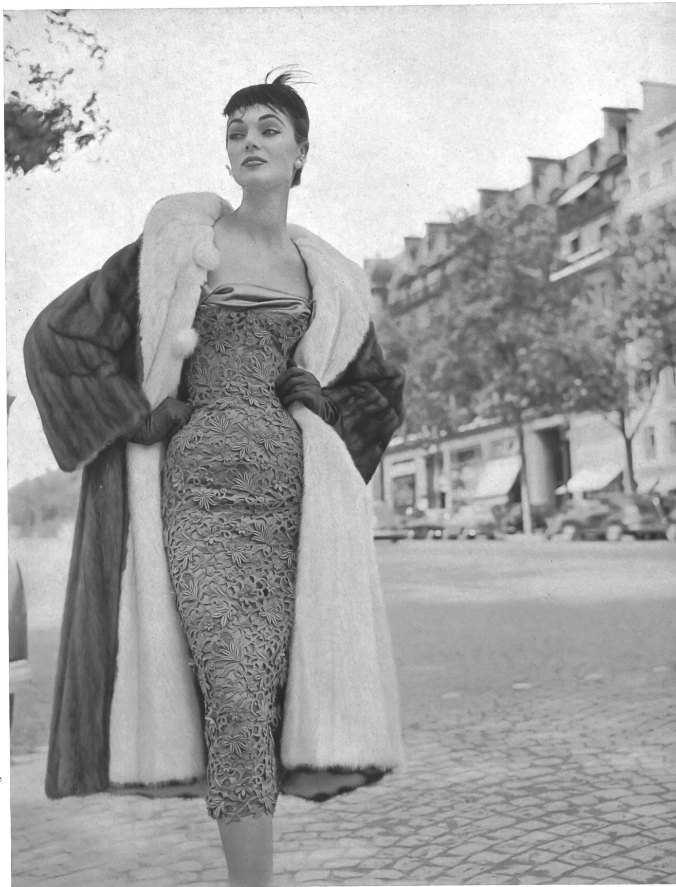
JACQUES FATH Belle dentelle guipure de Forster Willi & Co., Saini-Gall Grossiste à Paris: Pierre Brivet S.à r.l.