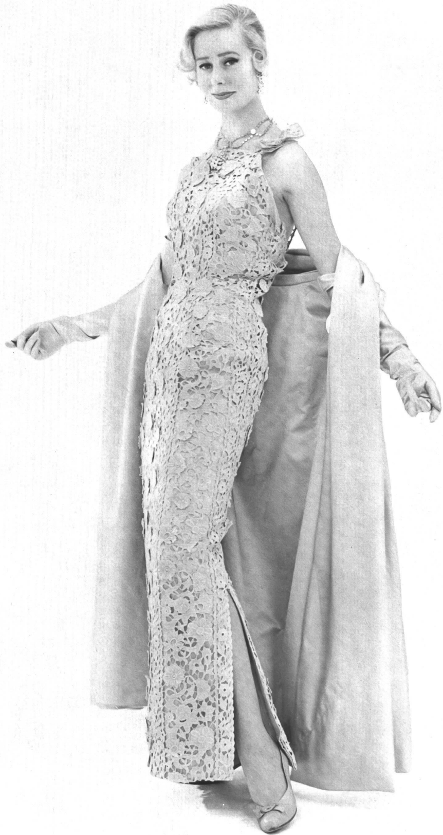
HUBERT DE GIVENCHY Belle guipure de Forster Willi & Co., Saint-Gall. Placé par Inamo, Zurich.