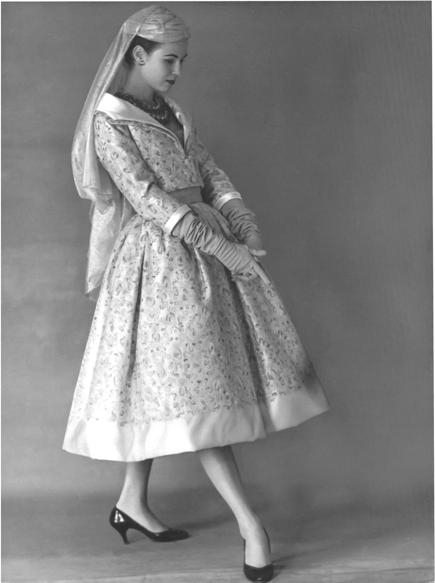
CHRISTIAN DIOR Satin duchesse rebrodé d'or de Rudolf Brauchbar & Cie, Zurich. Distribué par Montex, Paris.