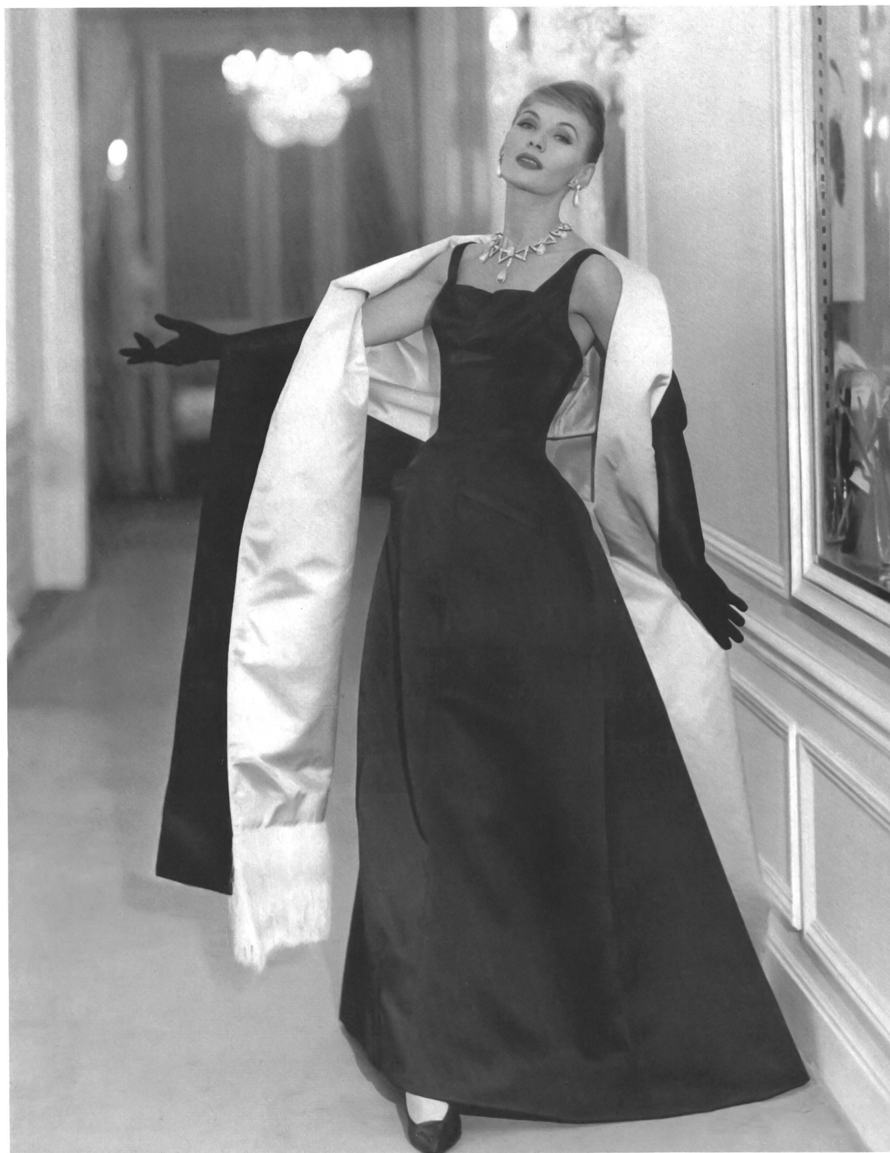
PIERRE BALMAIN Satin double face de L. Abraham & Cie. Soieries S. A., Zurich.