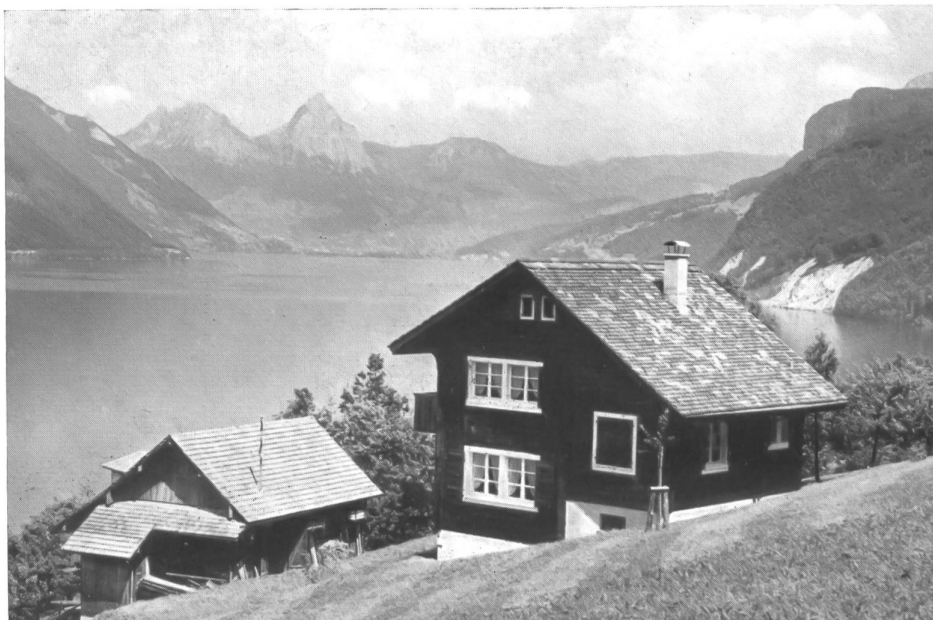
Une des maisons de vacances pour le personnel, à Beckenried près de Lucerne.

L'ouvrage commémoratif de la Filature de la Lorze doit être signalé comme un modèle du genre. Disposant d'une documentation abondante et complète, l'auteur en a tiré parti avec une rare compétence de sorte que, tout en retraçant l'histoire d'une entreprise, il a écrit un chapitre remarquablement fouillé du développement industriel et économique suisse durant les cent dernières années.