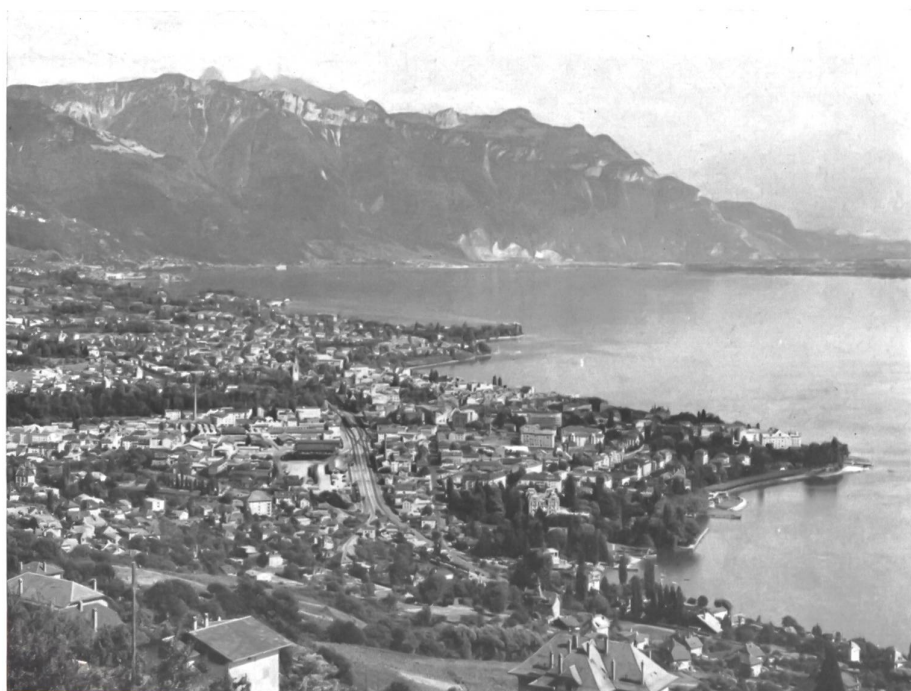
Vevey, où aura lieu en août prochain la « Fête des Vignerons ».

La dernière « Fête des Vignerons » eut lieu en 1927. La suivante s'annonce pour ce prochain mois d'août. Depuis des semaines déjà,