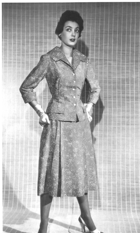
Siegfried Elias, Wien Reinseidener Honan von : Honan pure soie de : Emar S. A., Zurich