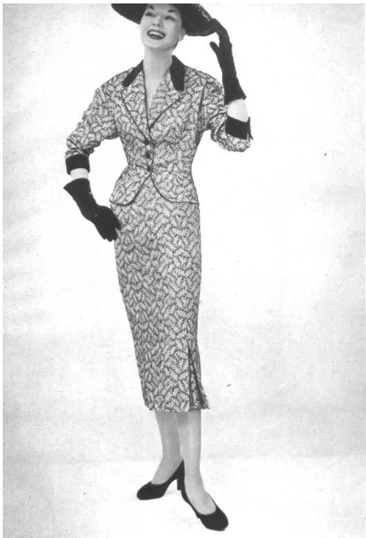
Jersey Mavèl, Amsterdam Panama façonné de Rudolf Brauchbar & Cie, Zurich