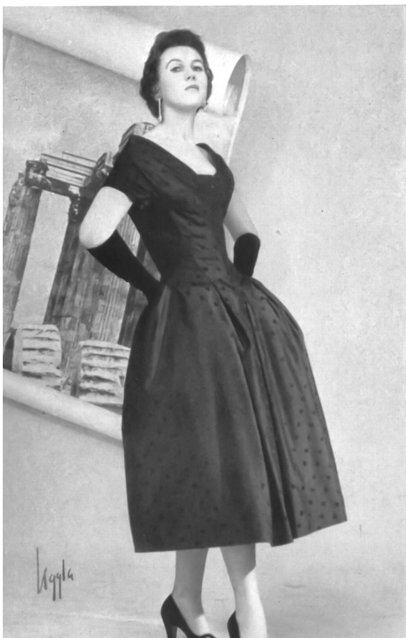
AB Martin-Konfektion, Stockholm Damas tussah pure soie de Emar S. A., Zurich