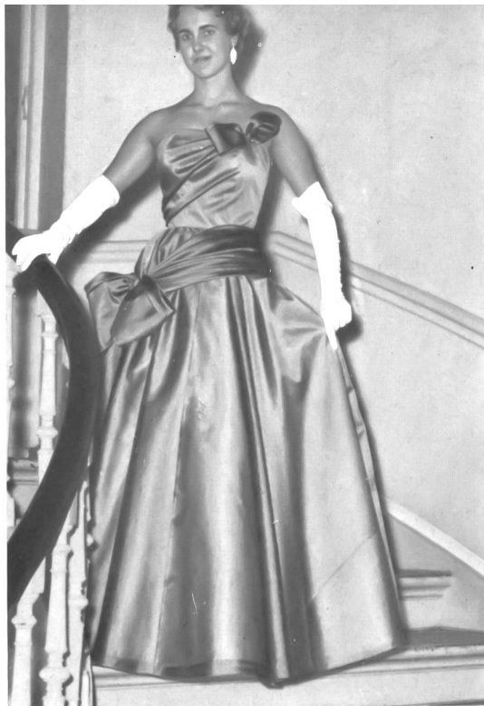
Honico A/S, Copenhagen Organza Cristalline de Emar S. A., Zurich