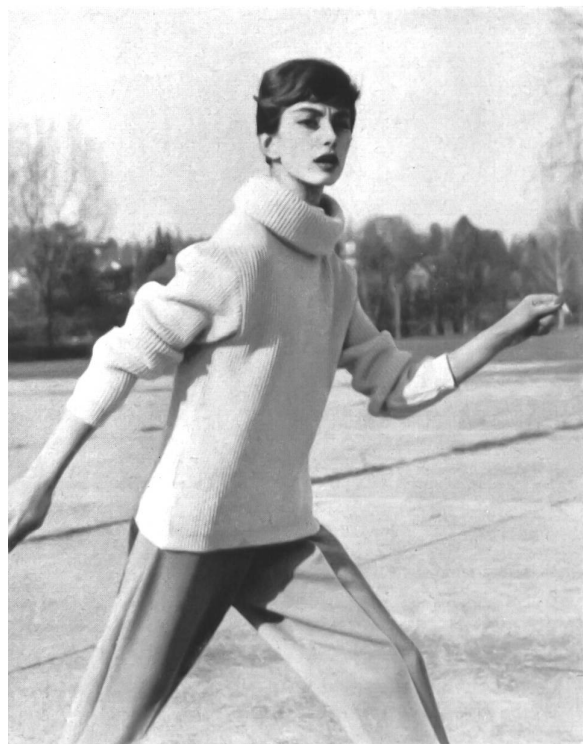
Pantalon d'après-ski beige et sweater ivoire.