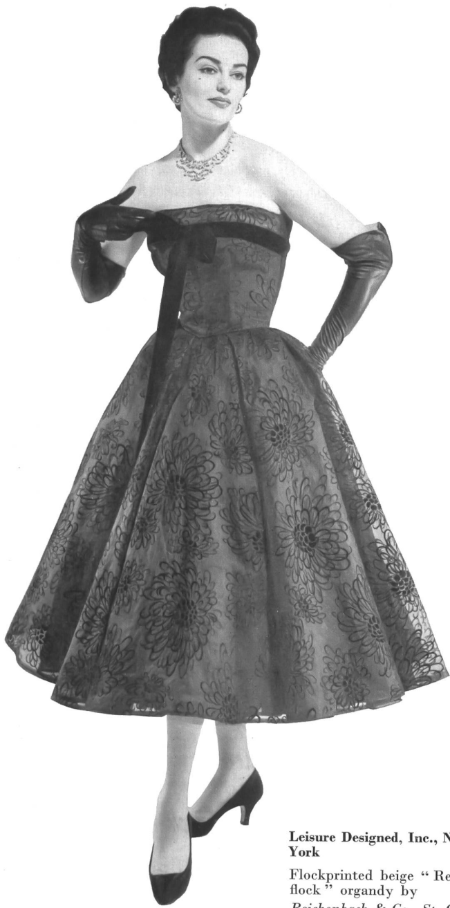
Leisure Designed, Inc., New York

Flockprinted beige "Reco-flock" organdy by Reichenbach & Co., St. Gall