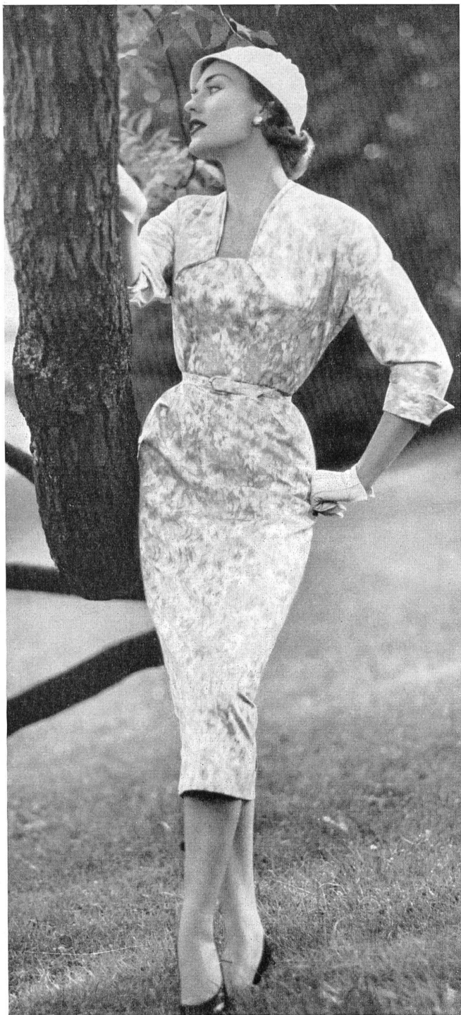
Kleid aus Baumwoll-chiné