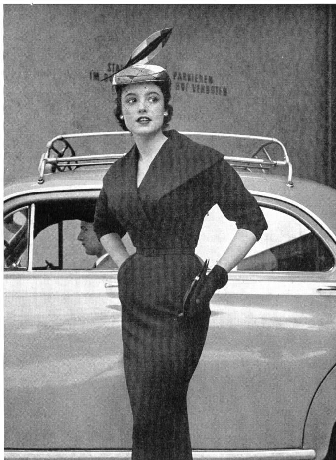
Modell Jaro, Stoff Baracca, L. Abraham & Cie, Zürich

BLUSEN UND KLEIDERFABRIK, SIHLPORTEPLATZ 3, ZÜRICH