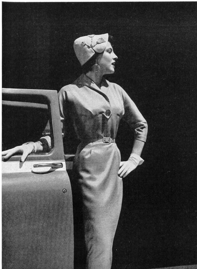
Modell Jaro, Stoff Belrobe, Heer & Co., Thalwil