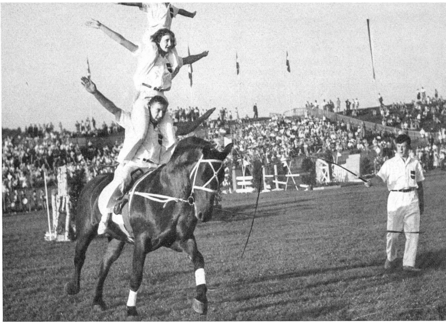
Le numéro de voltige de la jeunesse d'Elgg.