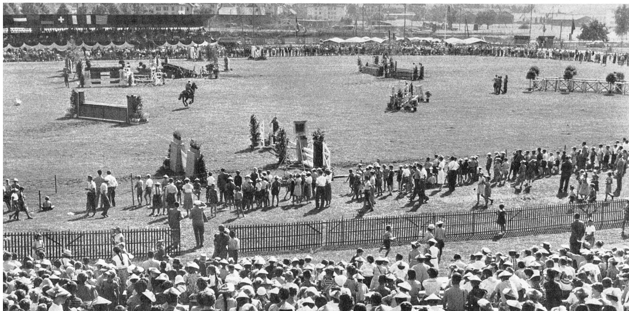
Le champ de courses de Breitfeld (Saint-Gall).