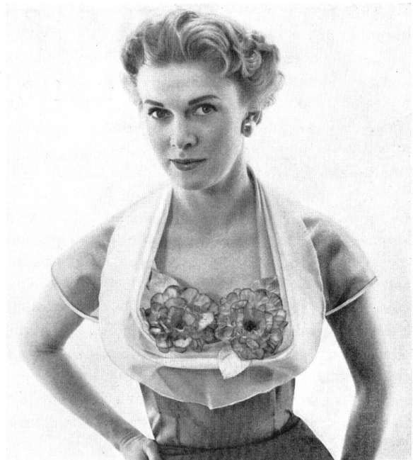
Kates C.L., London

Les magasins à prix moyens peuvent maintenant offrir de ces articles à des conditions acceptables et le succès de vente paraît assuré, en partie parce que le public voyage et peut comparer les qualités ici et là, en partie à cause de la bonne réputation des produits suisses ;