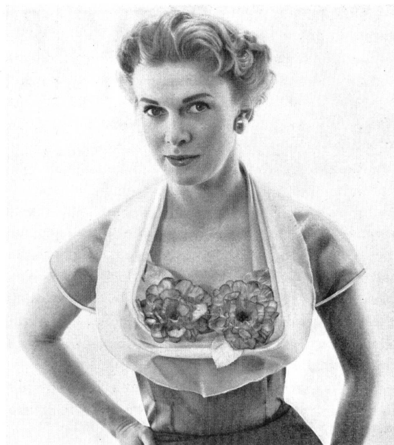
Kates C.L., London

Les magasins à prix moyens peuvent maintenant offrir de ces articles à des conditions acceptables et le succès de vente paraît assuré, en partie parce que le public voyage et peut comparer les qualités ici et là, en partie à cause de la bonne réputation des produits suisses ;