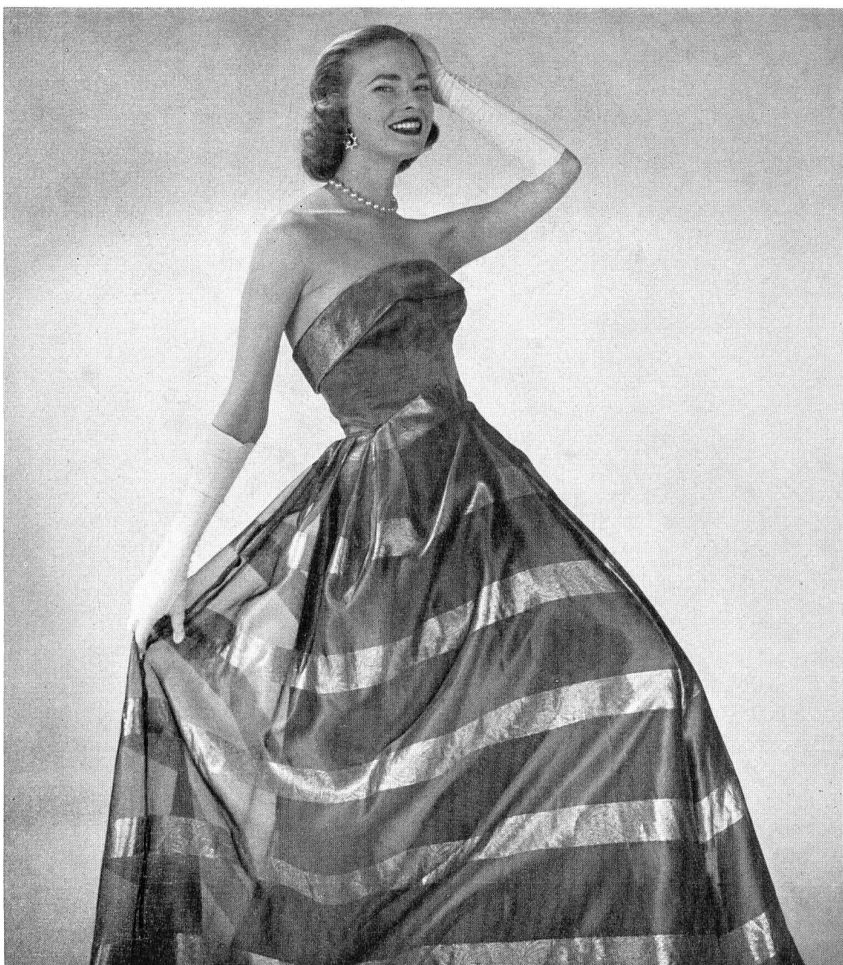
Frank Usher Ltd., London

Pour retrouver un peu d'assurance, je suis partie à la découverte dans les magasins de Londres, au hasard. J'avais cependant l'intention de dénicher certains articles suisses nouveaux sur le marché britannique. Ma première trouvaille fut un jupon bouffant, fabriqué pourtant dans un atelier londonien, mais avec du tulle de nylon apprêté suisse. Ce qu'il y a de merveilleux dans cet article c'est qu'il est extrêmement léger et facile à laver. Nul doute que ce ne soit un succès : il n'épaissit pas et fait paraître la taille et les hanches plus minces en élargissant la jupe en cloche.