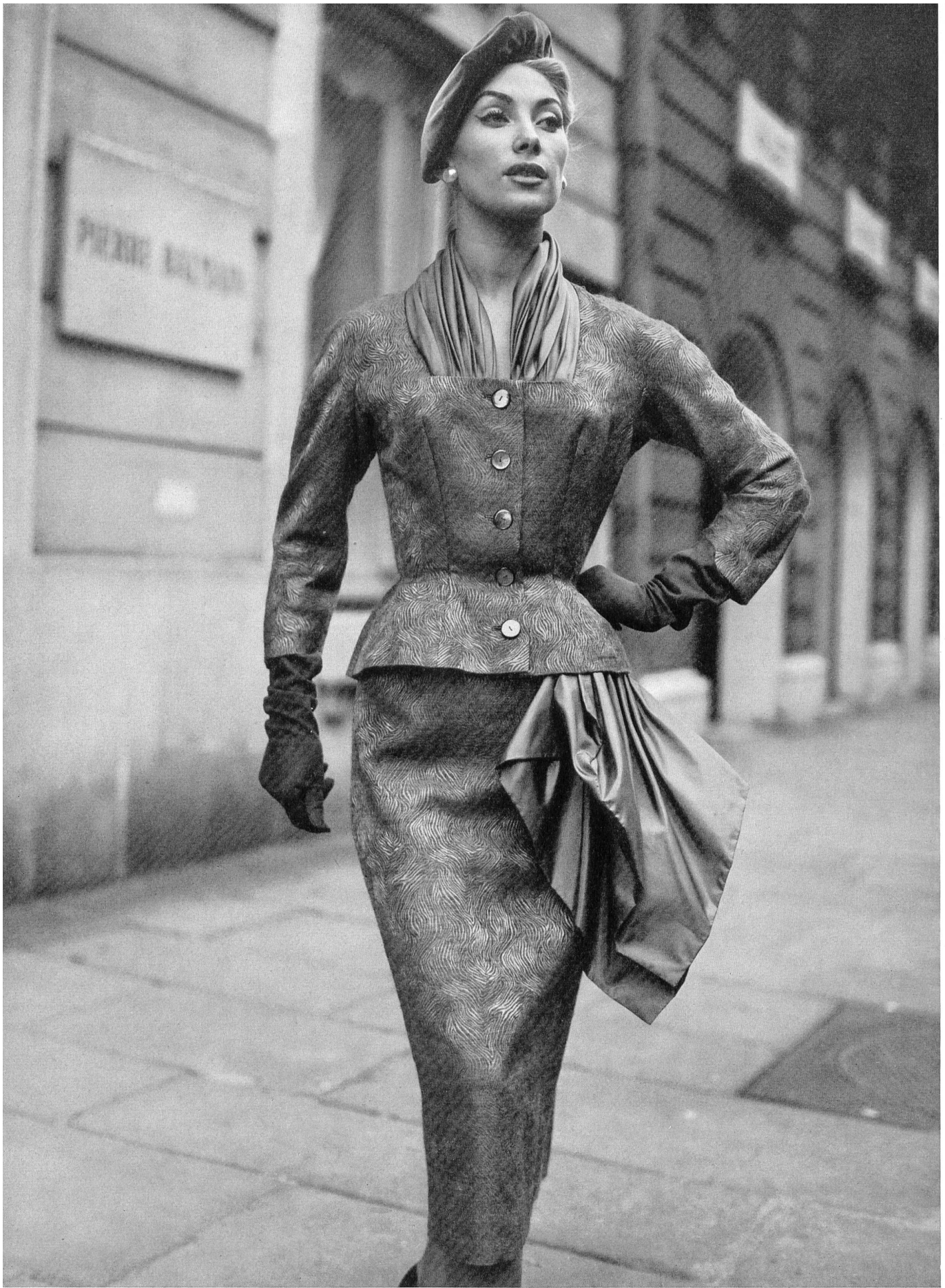
PIERRE BALMAIN Mohair façonné viscose/laine de Rudolf Brauchbar & Cie, Zurich