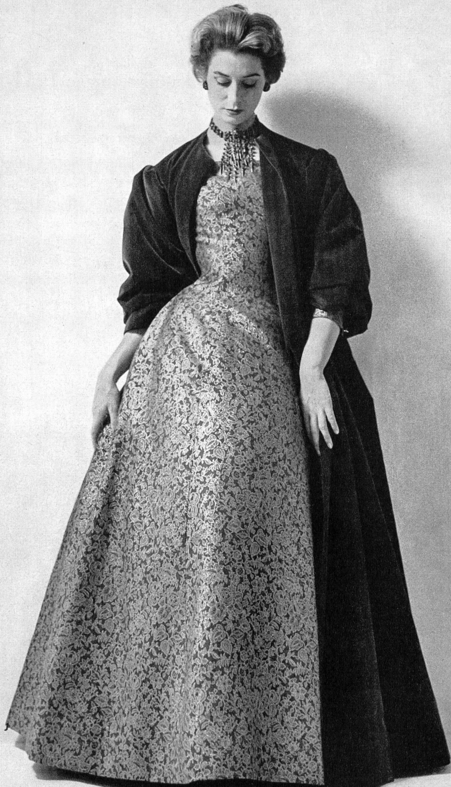
CHRISTIAN DIOR Tapira or de L. Abraham & Cie, Soieries S. A., Zurich