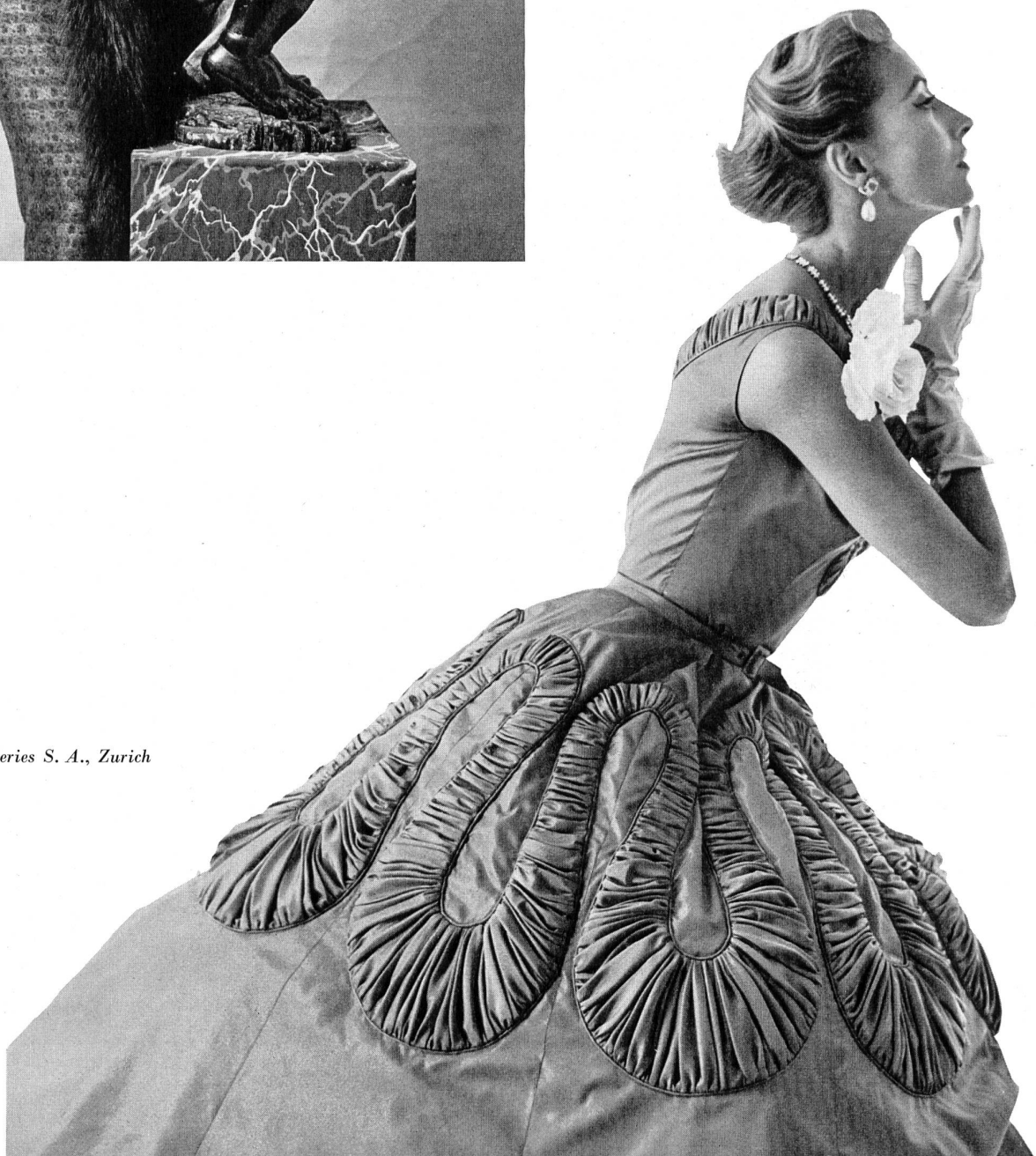
PIERRE BALMAIN Basma soie de L. Abraham & Cie, Soieries S. A., Zurich