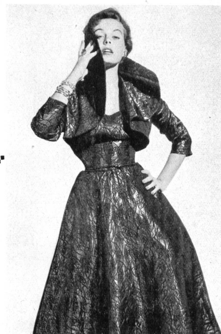
Matelassé façonné lamé. Modèle Hartnell Garment Co., Melbourne.