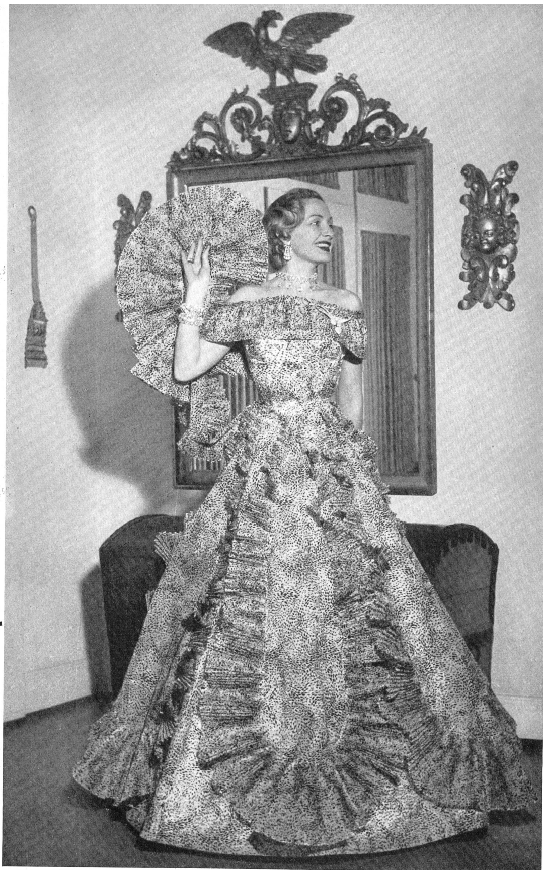
Flocosa, organdi de coton imprimé flock noir. Modèle Fred Spillmann, Bâle.