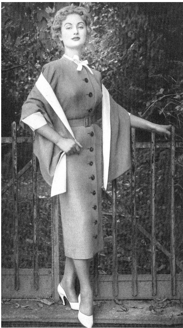
Tweed Belrobe fibranne. Modèle R. Cafader & Cie, Zurich.