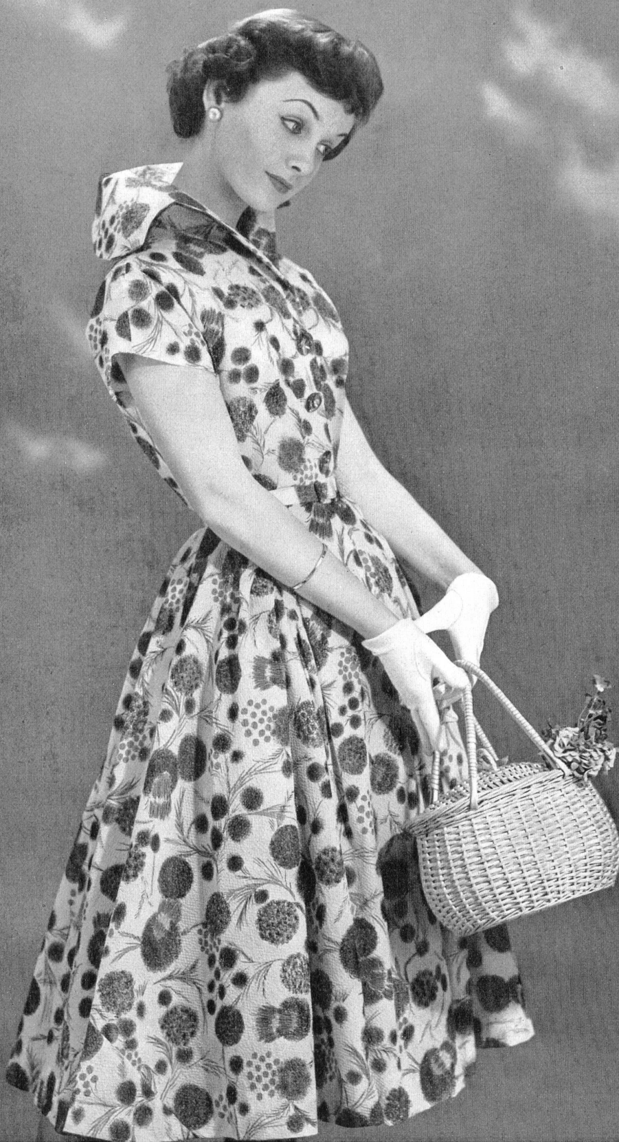
Nylon imprimé. Modèle Willy Meyer S. A., Zurich.