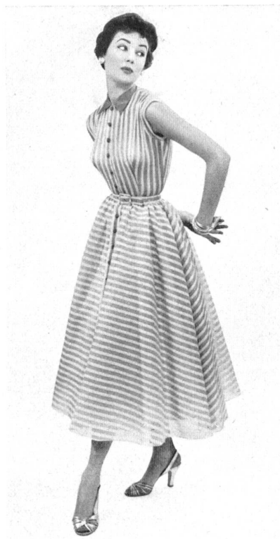
Farfalla barré. Modèle Susan Small Ltd., Londres.