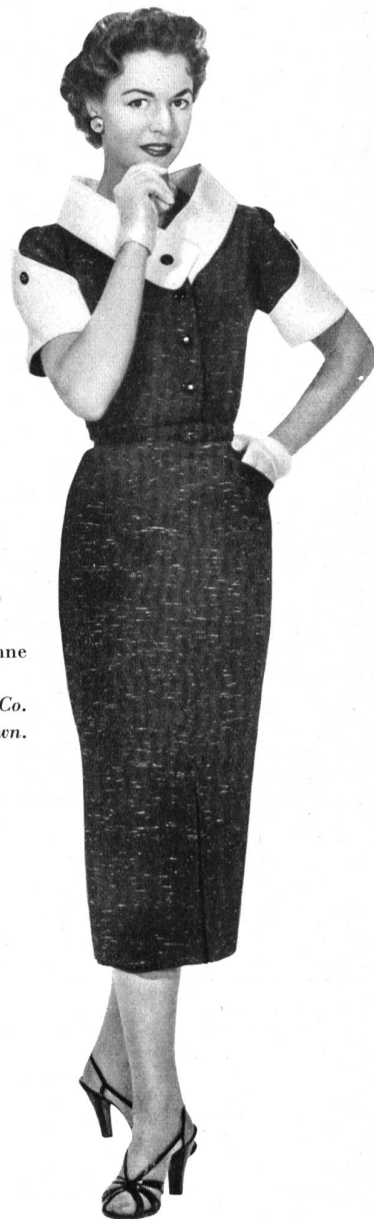
Toile Haruko, rayonne et fibranne.

Modèle Hellas Mfg. Co. (Pty) Ltd., Cape Town.