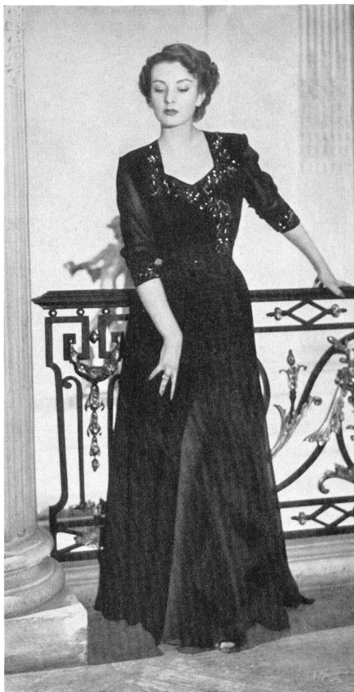
Crêpe de Chine imprimé, soie naturelle. Modèle Casa Mode Zoen, Milan.