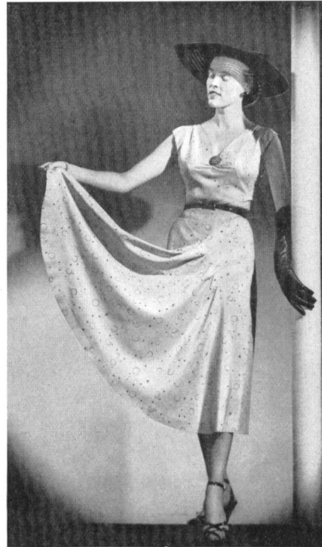
Kiang-Su imprimé. Modèle M. K. Manufacturers Ltd., Auckland.