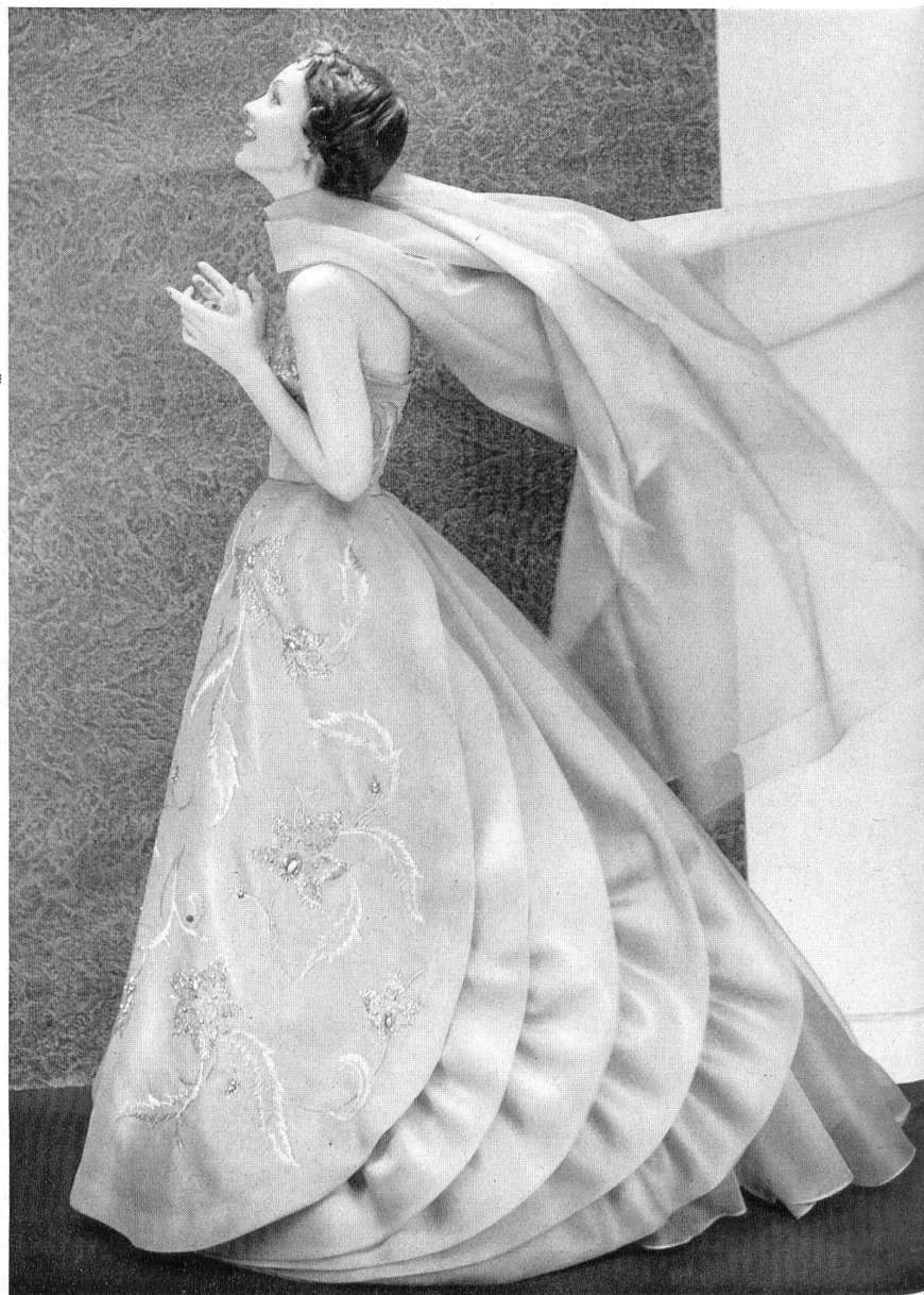
Organza pure soie. Modèle Marty & Cie, Zurich.