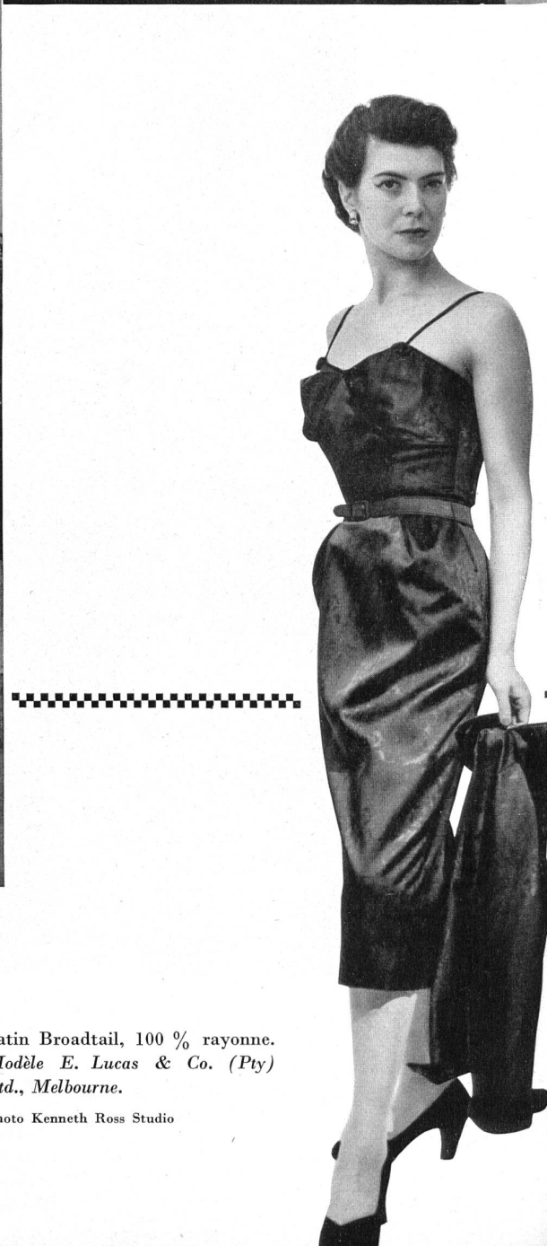
Satin Broadtail, 100 % rayonne. Modèle E. Lucas & Co. (Pty) Ltd., Melbourne.