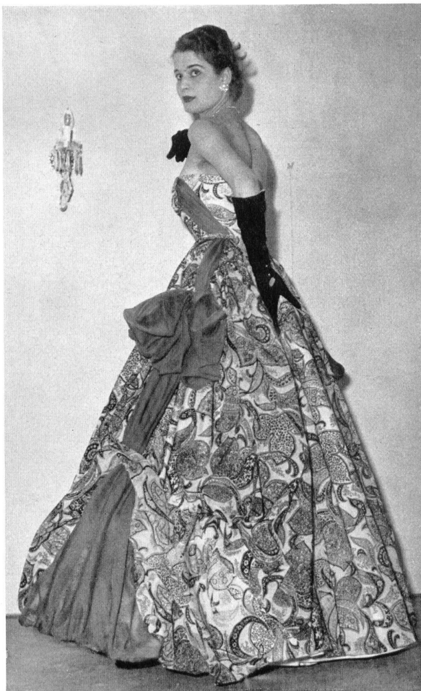
Taffetas « Papillon », soie naturelle imprimée. Modèle Sartoria Guidi, Florence.