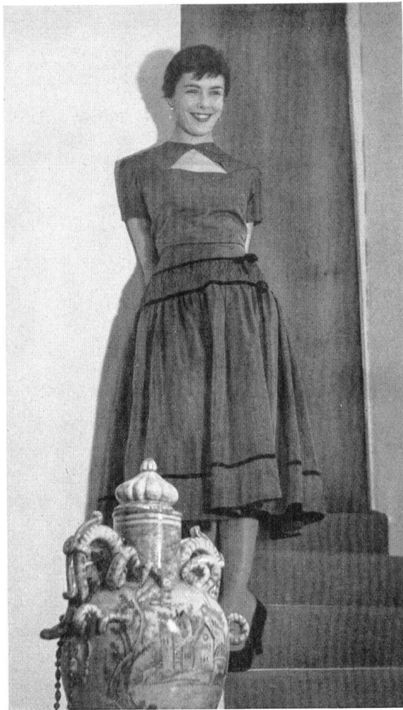
Taffetas shantung, soie naturelle.