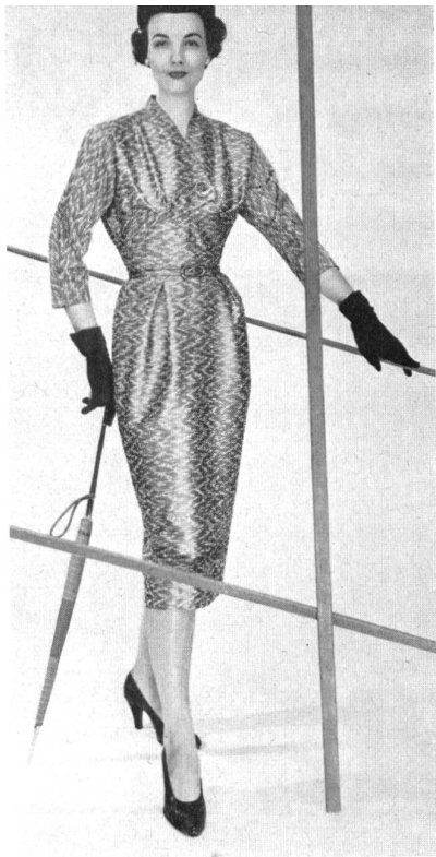
Marrakech façonné. Modèle Halldéns, Stockholm.