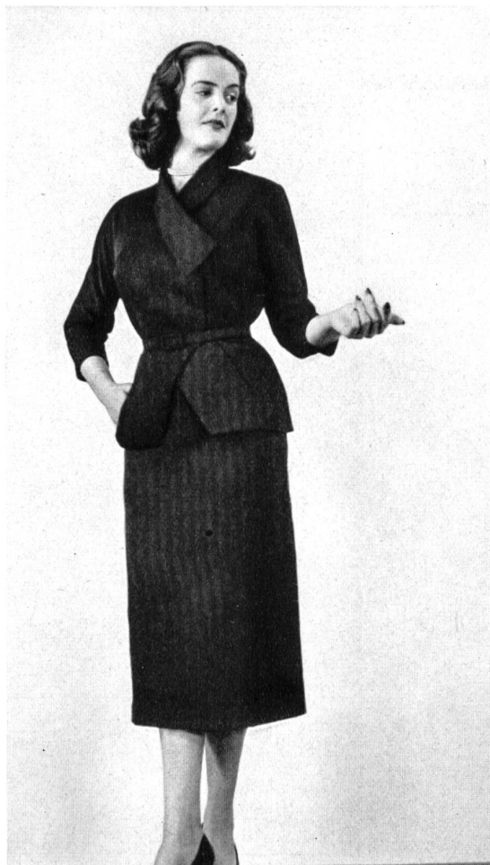
Grosgrain couture, rayonne et fibranne. Modèle Peggy Fashions (Pty) Ltd., Johannesburg.