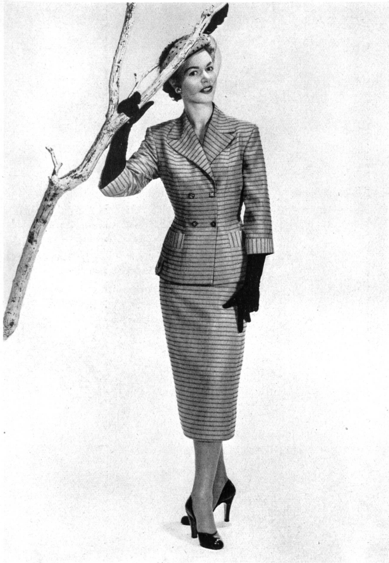
Fresco barré, rayonne et fibranne. Modèle Hellas Mfg. Co. (Pty) Ltd., Cape Town.