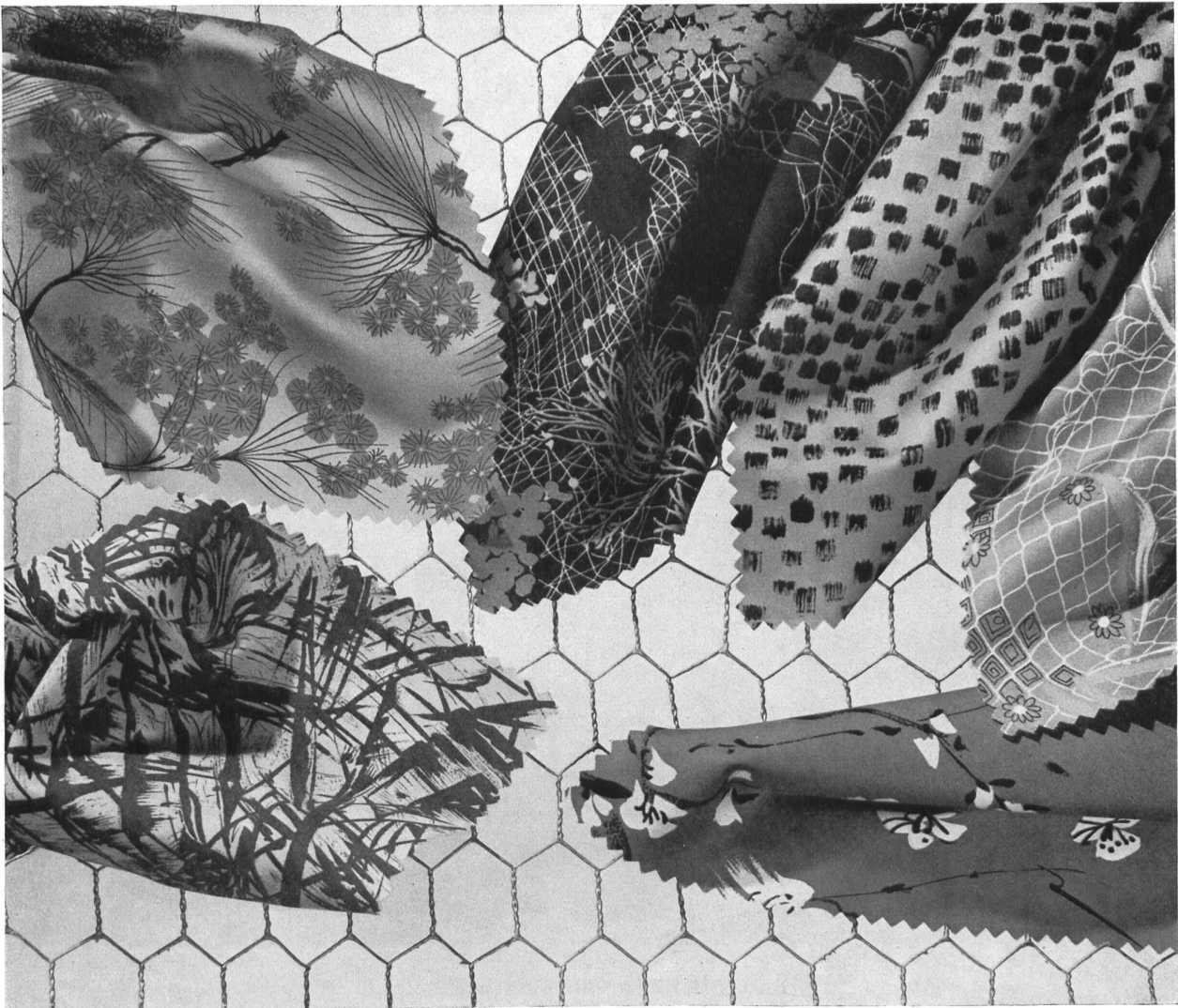
REICHENBACH & CO., ST-GALL « RECOSUPRA »

Popeline imprimée infroissable, dernières créations de la collection d'été 1954.