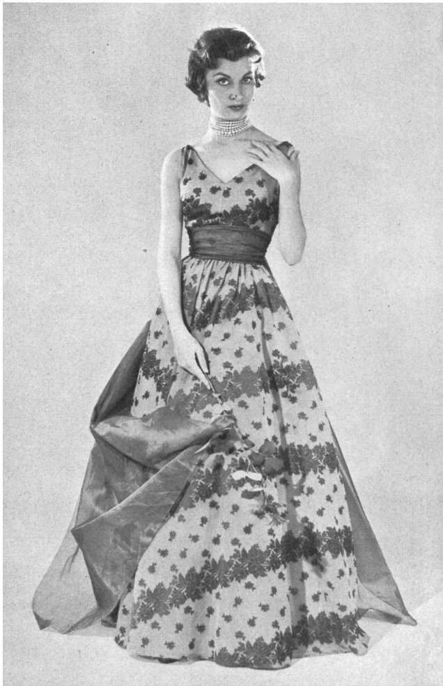
NICOL MODELLER A.-B., GÖTEBORG

La Suisse est, pour la Suède, un important fournisseur de produits textiles et d'habillement. Comme les habitants de beaucoup d'autres contrées septentrionales, les Suédois, s'ils sont sensibles à l'élégance, apprécient aussi beaucoup la qualité ; et cette qualité, ils savent qu'ils peuvent la trouver dans les produits suisses, que ce soient des vête-