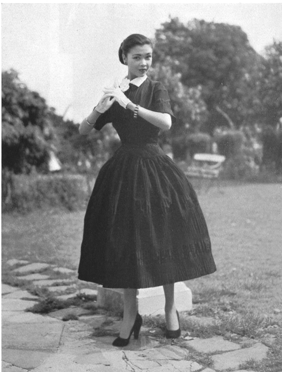
ROECLIFF & CHAPMAN, LONDON Afternoon or cocktail dress in Swiss gaufré black taffeta.

Cette clientèle jeune, dont l'effectif augmente constamment, offre aux fabricants et détaillants de grandes possibilités de vente ; les fabricants d'articles plus chers