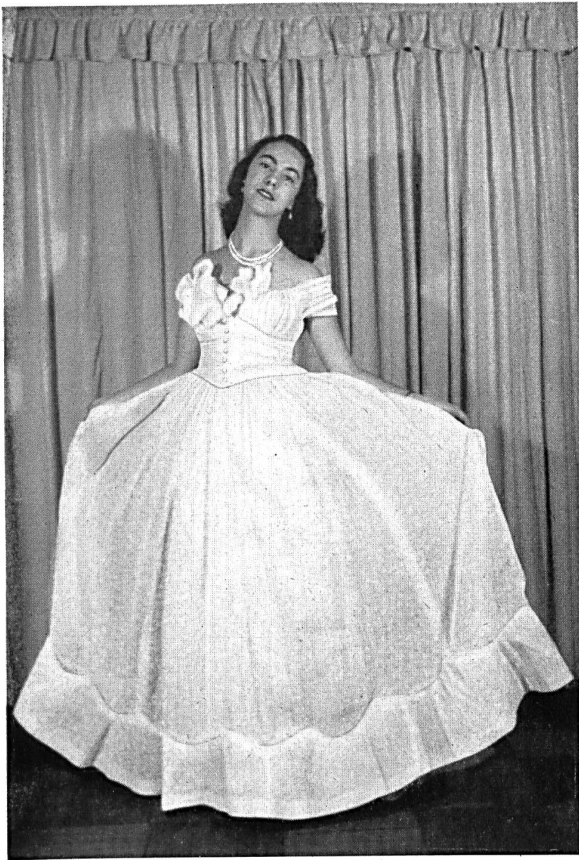
Miss Figueroa wears a white swiss organdy dress, MODEL MAR-BLAS, Santiago of Chile.

Although South American markets are often somewhat inaccessible to Swiss textile products, it should be mentioned that the difficulties are purely economic and financial in nature, some countries seeking rather to protect a rising national industry, others, such as Chile in parti-