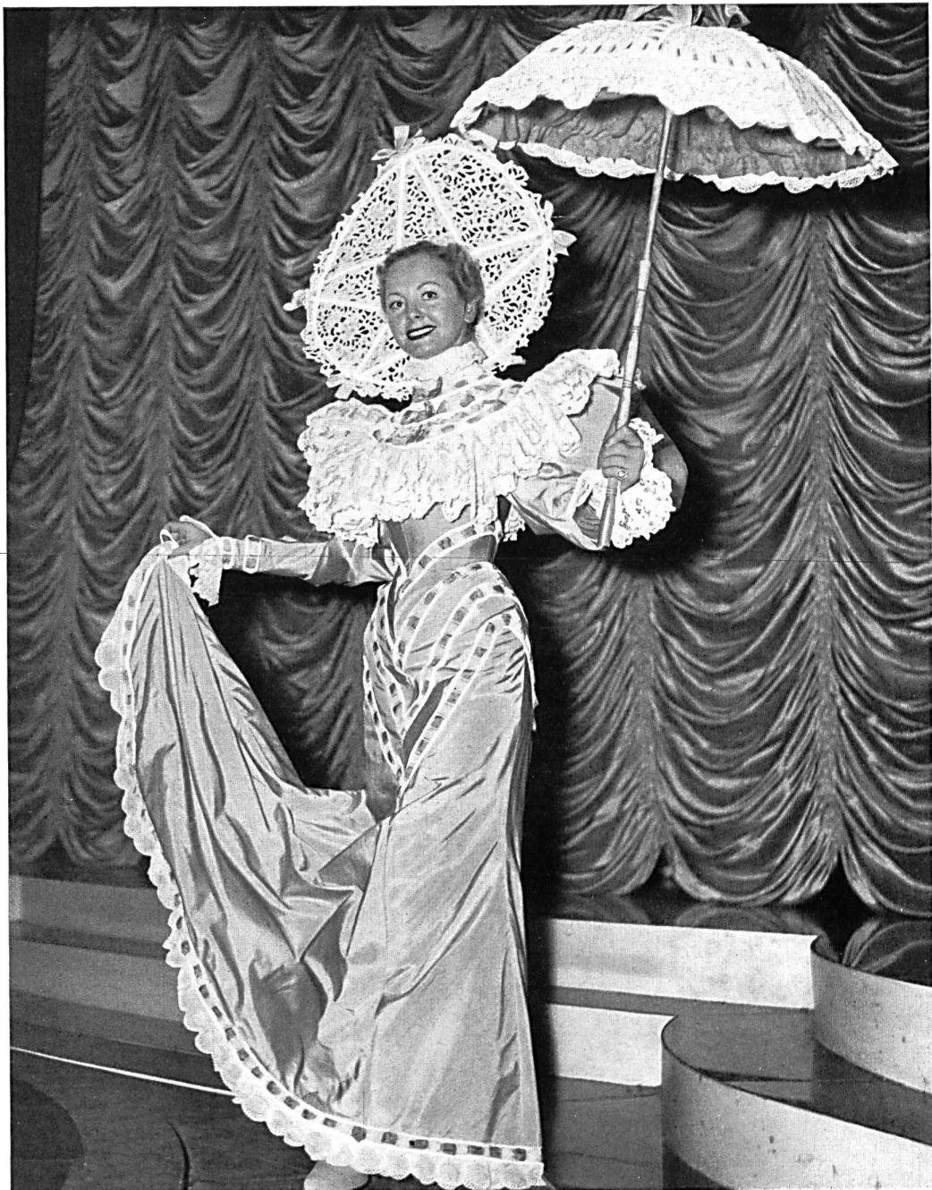
Guipure blanche, broderie anglaise, passe-ruban.