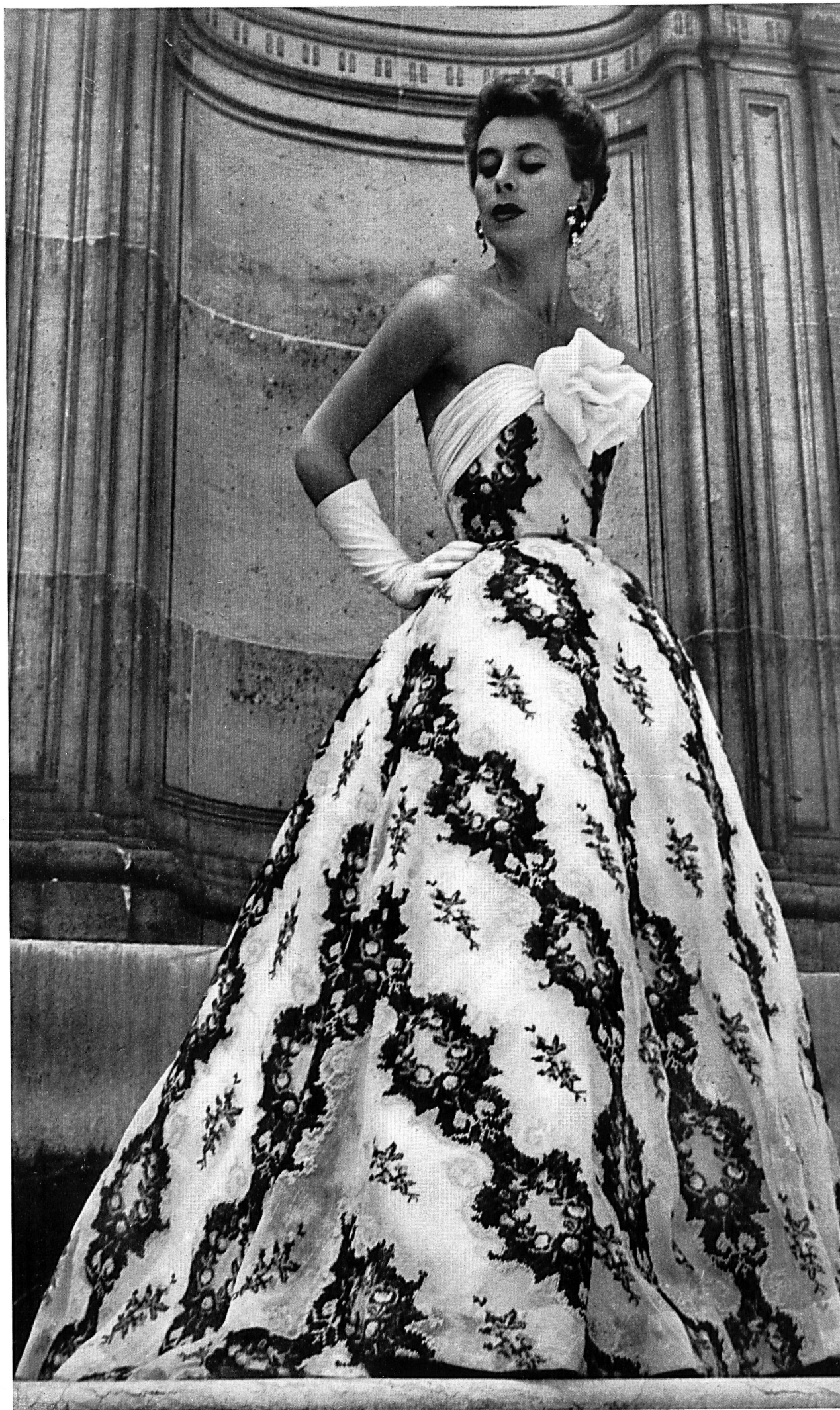
HUBERT DE GIVENCHY Broderie, imitation « tapisserie petit point », sur organdi, de Forster Willi & Co., St-Gall ; pla- cée par Inamo, Zurich.