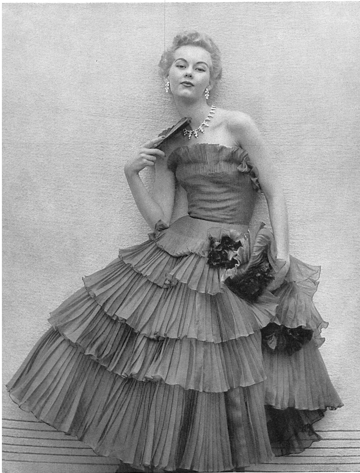
JEAN DESSÈS Basma soie de L. Abraham & Cie, Soieries S. A., Zurich.