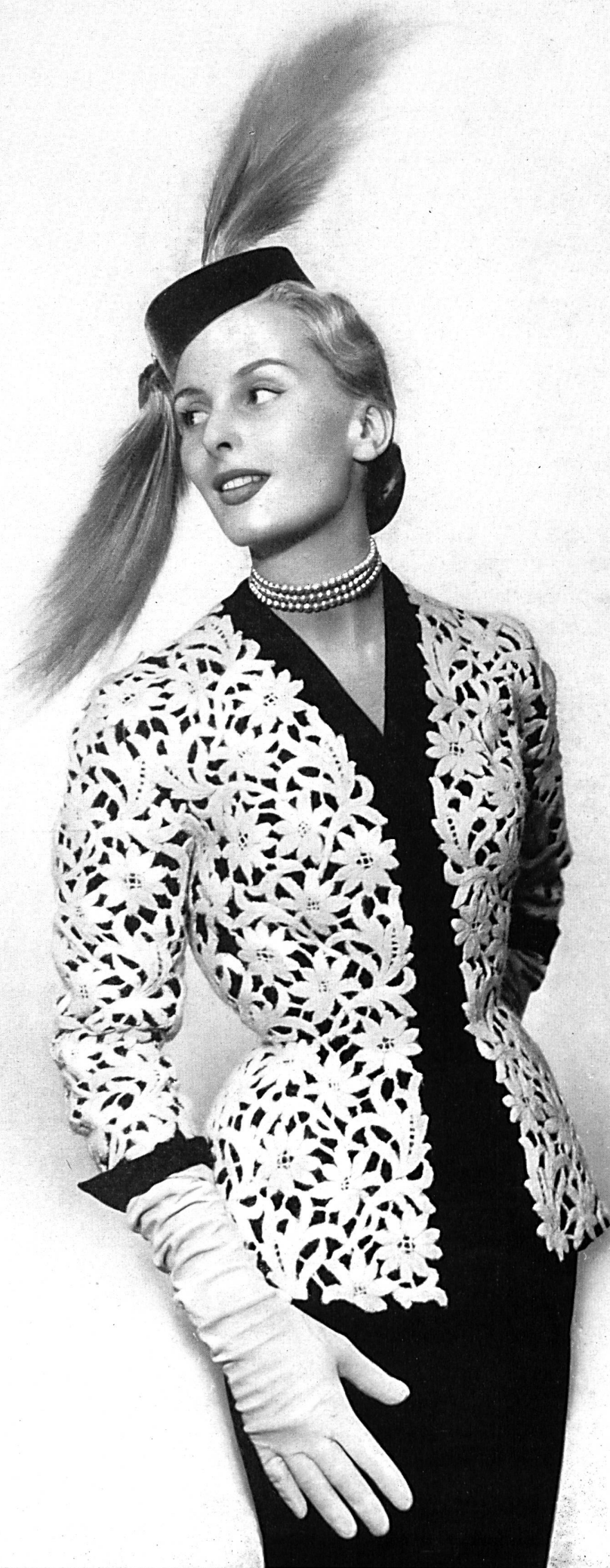
PIERRE BALMAIN Dentelle en guipure mohair de Forster Willi & Co., St-Gall ; grossiste à Paris : Châtillon, Mouly, Roussel S. A.