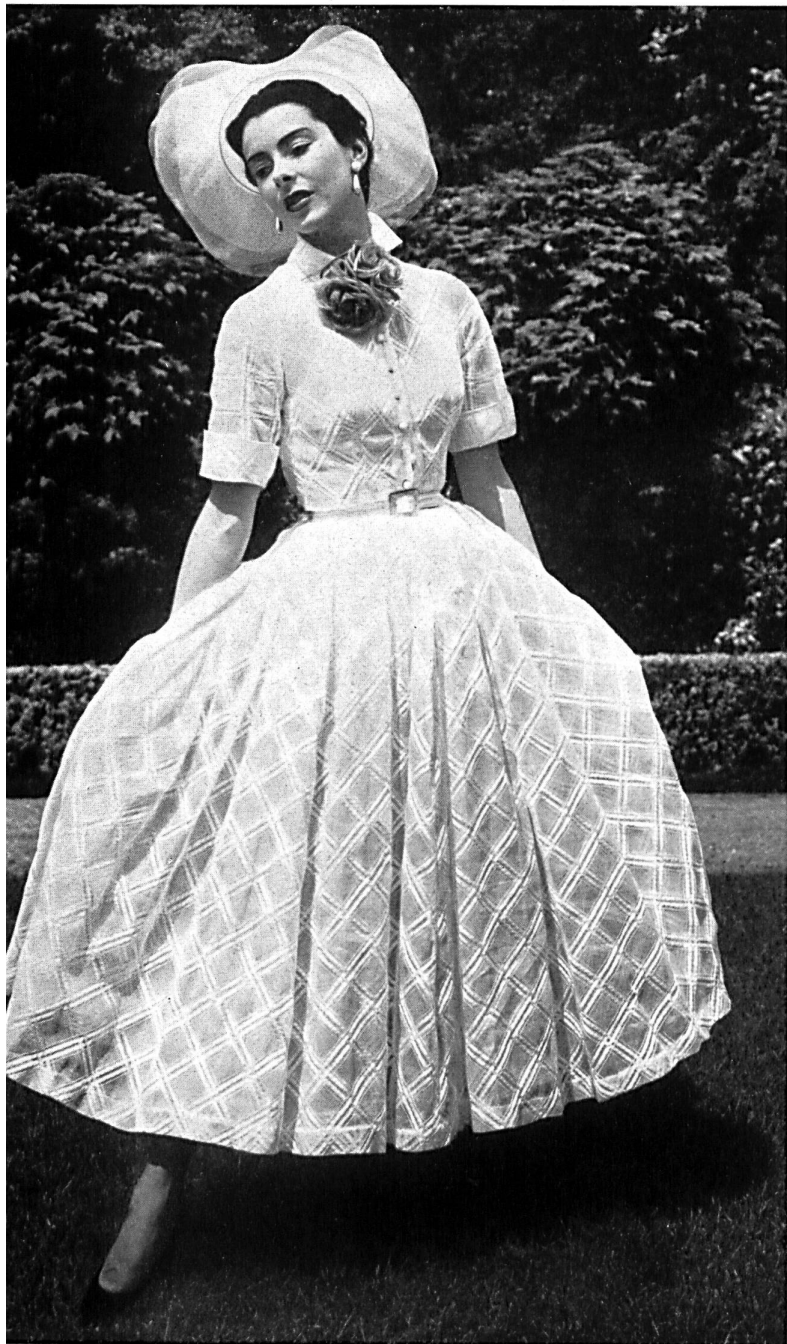
JACQUES HEIM Broderie sur organdi de Union S. A., St-Gall.