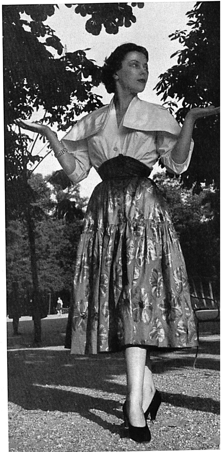
PAQUIN Percalè crêpée de Stoffel & Co., St-Gall.