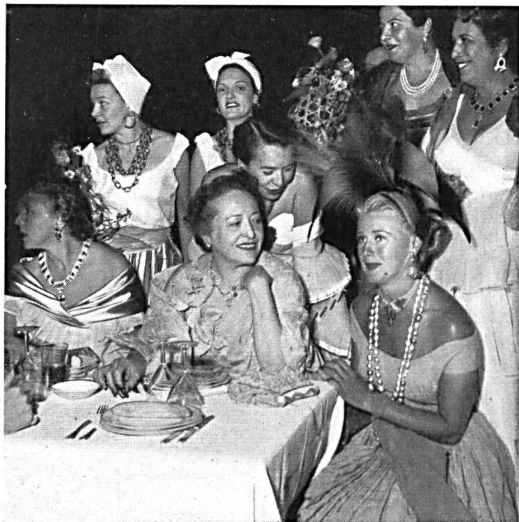
Madame Vargas, femme du président des Etats-Unis du Brésil (au centre) s'entretient avec la vedette Ginger Rogers.

Furthering a tradition established already many years ago by the big couturiers, Jacques Fath organizes receptions as amusing as they are bright, to which his castle of Corbeville, at some 30 miles from Paris, offers an ideal setting. At the beginning of August, this residence saw some eighteen hundred people who came at the invitation of Mr. and Mrs. Jacques Fath to celebrate a « Carnival at Rio » that was rendered more genuine through the presence of a great number of Brazilians, in the first row of whom, we must name Senhora Vargas, wife of the President of Brazil, who came purposely from Rio for the occasion. Mr. Assis de Chateaubriant, a big Brazilian newspaper editor, was also present. In this exotic atmosphere, the cabaret, stage and screen, Paris, Hollywood and the Orient, diplomacy, finance and titled people, Arts, couture, press, brushed shoulders and danced until morning to the tune of an orchestra specially brought by air from Rio. Variety entertainments — among them those of the master of the house himself were much admired — enlivened an atmosphere already very gay. We cannot for lack of space, give a fuller account of this very successful party, which was the most outstanding event of the summer season, besides, all the newspapers have spoken of it, therefore we only content ourselves in reproducing here a few snapshots.