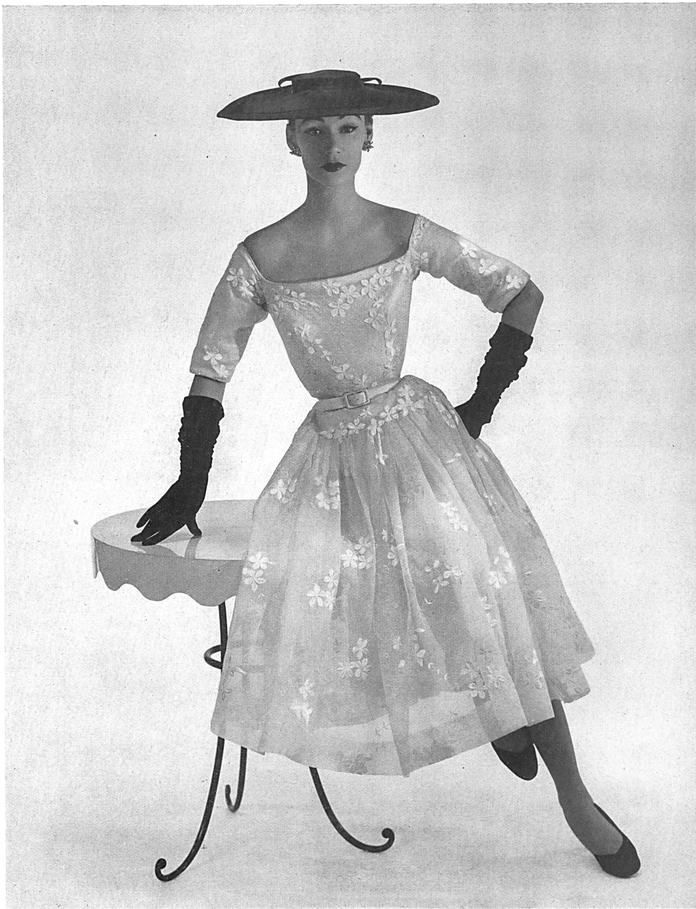
BALENCIAGA Organdi brodé de J. G. Nef & Cie, Hérisau.