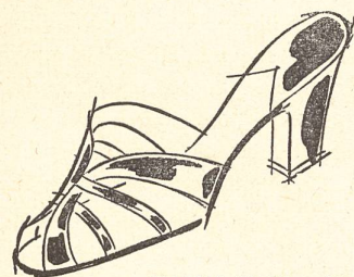
BALLY - Modèles déposés.