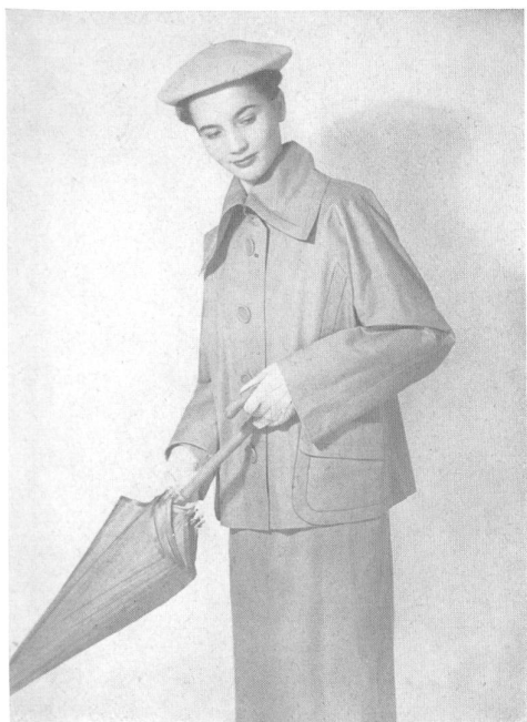
Jaquette très vague avec un large col nouveau très alluré et poches pratiques; jupe assortie.