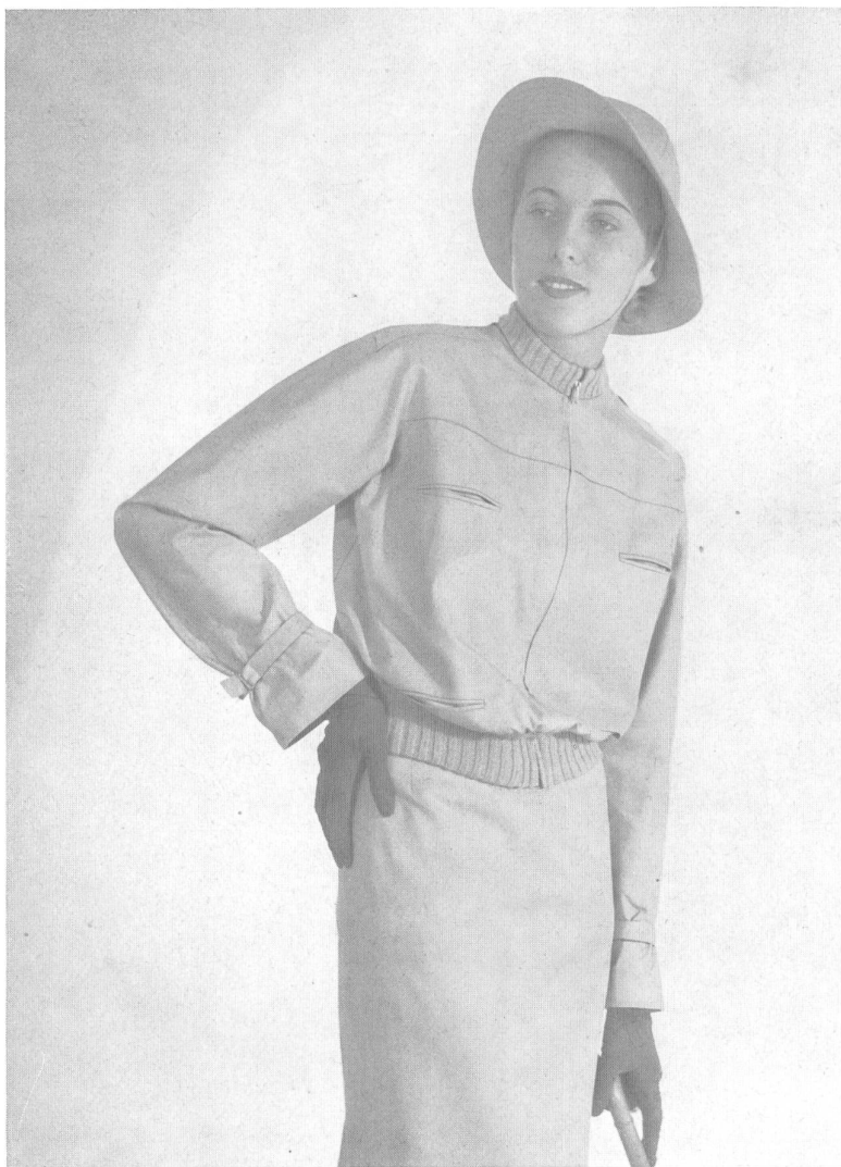
Blouson de golf à côtes en tricot ton sur ton, fermeture éclair; jupe assortie.

Le « mauvais temps » n'est plus l'ennemi de la femme et de l'élégance ! Ces ravissants vêtements de pluie et de plein-air permettent à la femme de braver les éléments sans renoncer à être habillée avec chic. Il s'agit de costumes et de deux pièces d'un genre absolument nouveau, en gabardine de coton de haute qualité, à double imprégnation hydrofuge permanente, de la qualité qui était utilisée jusqu'aujourd'hui uniquement pour la fabrication d'imperméables et de blousons ou jaquettes de sport. Très originaux et très racés, ces ensembles jeunes et sympathiques, qui donnent à la femme la possibilité d'être toujours correctement et élégamment habillée par temps douteux, conviennent parfaitement bien à la pratique des sports, au tourisme en auto ou en avion, aux randonnées à bicyclette, au golf, au camping, etc. On les trouve en quinze coloris environ, des teintes pastel aux couleurs plus vives et soutenues. Ajoutons que l'on peut porter séparément jupes et jaquettes ou blousons, ce qui permet d'en varier et d'en étendre l'usage.