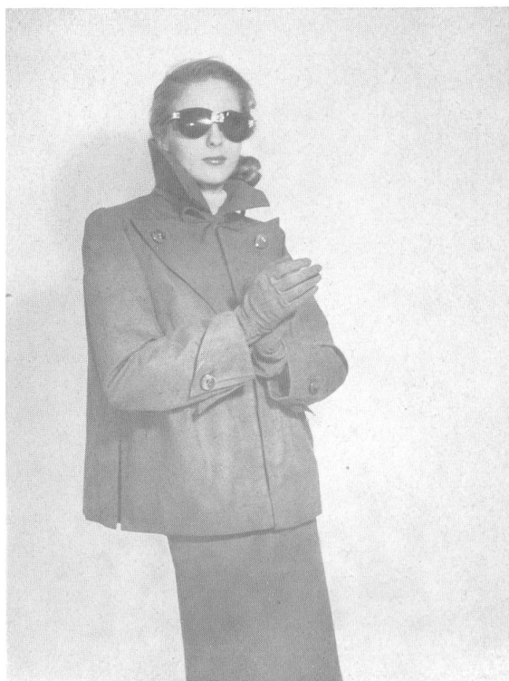
Ensemble très chic et très sportif, jaquette vague avec col pouvant être porté rabattu ou relevé, fermeture éclair; jupe assortie.

Modèles de la S.A. Jacob Scherrer, Fabrique de lingerie et de robes, Romanshorn