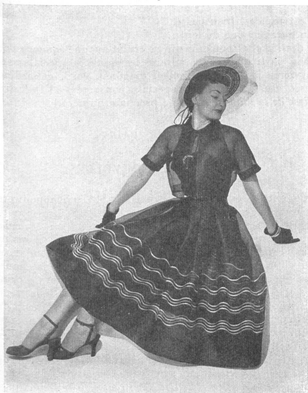
Robe d'après-midi de Aldrich en organdi suisse marine.

Les cotons fins suisses : batiste, voile, dotted Swiss, organdi, etc., ont été présentés sous forme de modèles d'été de trente-sept fabricants américains de confection.