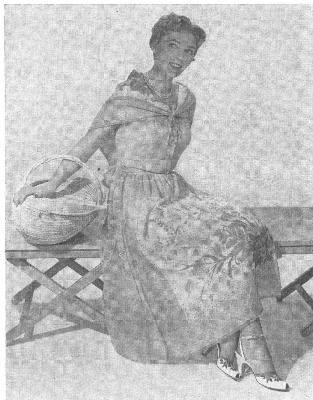
Robe de « L'Aiglon » en voile suisse infroissable.

Il s'agissait de montrer que les tissus de coton fins tels qu'ils sont fabriqués en Suisse, conviennent particulièrement bien aux modes et climats américains, pour toutes les occasions de la journée ou du soir, non seulement à cause de leur qualité intrinsèque et de leur fraîcheur au