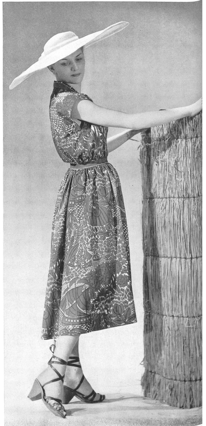
MOLYNEUX Rudolf Brauchbar & Cie, Zurich