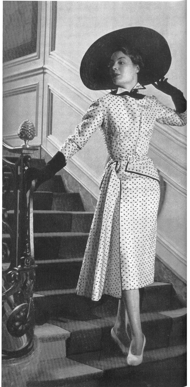
JACQUES FATH L. Abraham & Cie Soeries S. A., Zurich