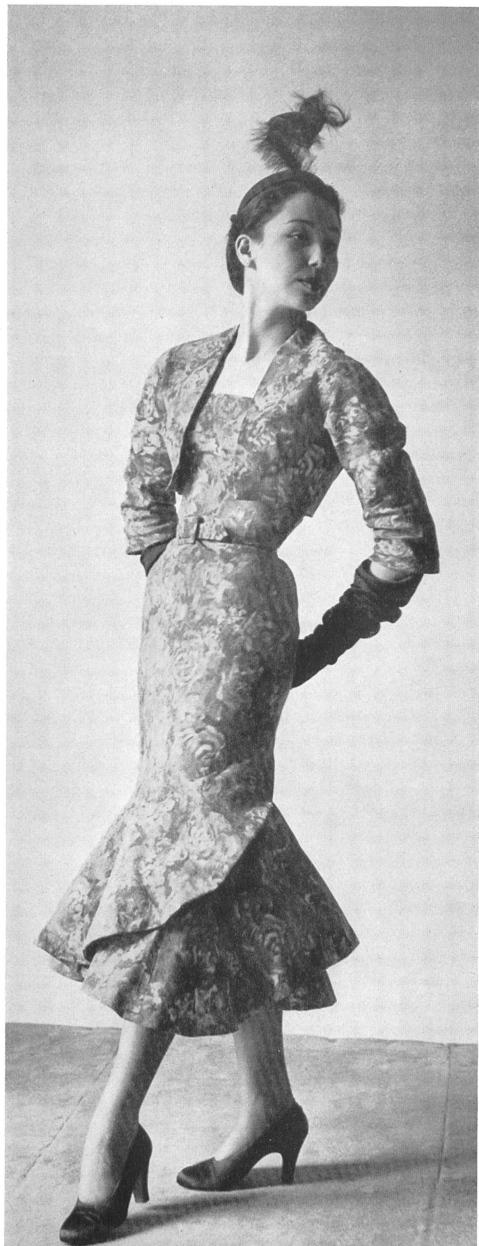
BALENCIAGA L. Abraham & Cie Soieries S. A., Zurich INAMO, ZURICH

CHRISTIAN DIOR → L. Abraham & Cie Soieries S. A., Zurich INAMO, ZURICH