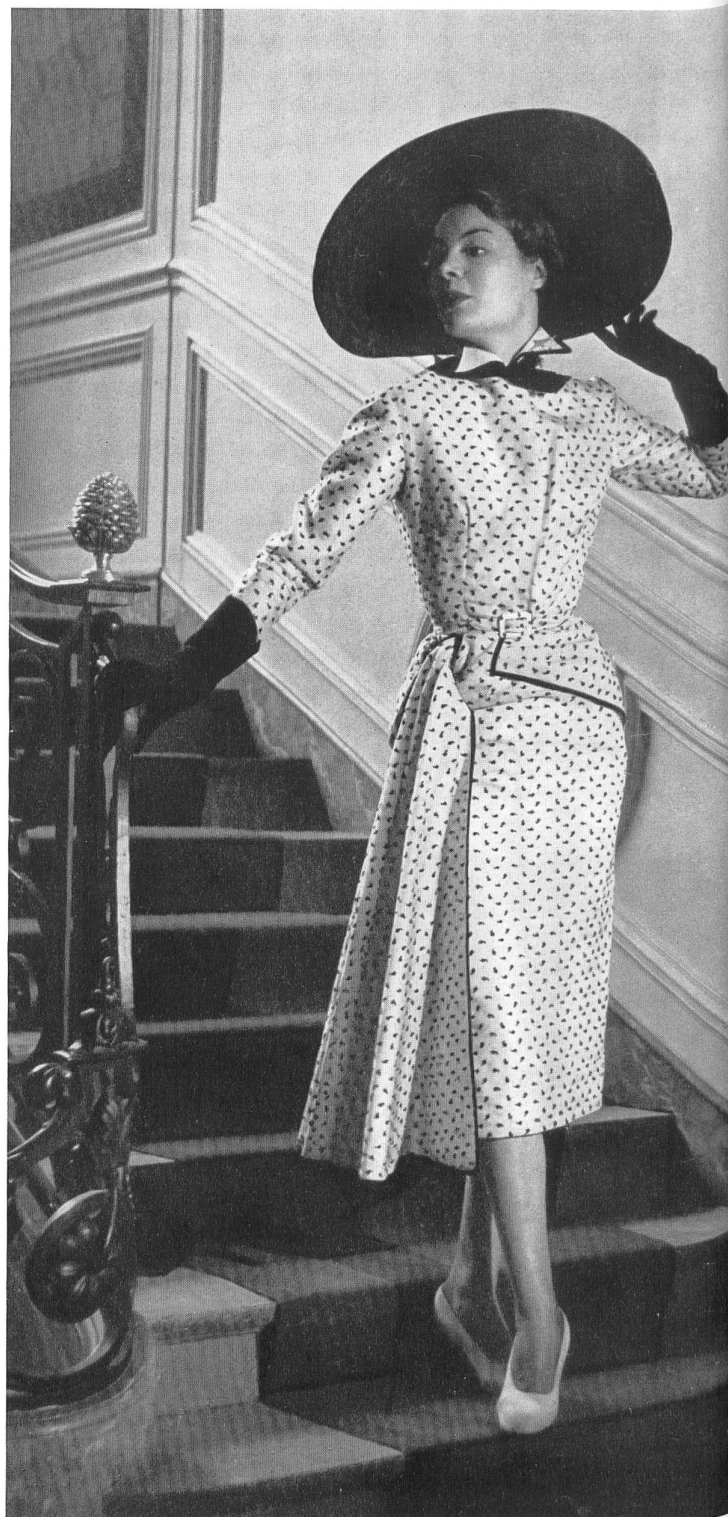
JACQUES FATH L. Abraham & Cie Soieries S. A., Zurich

CHRISTIAN DIOR → L. Abraham & Cie Soieries S. A., Zurich INAMO, ZURICH