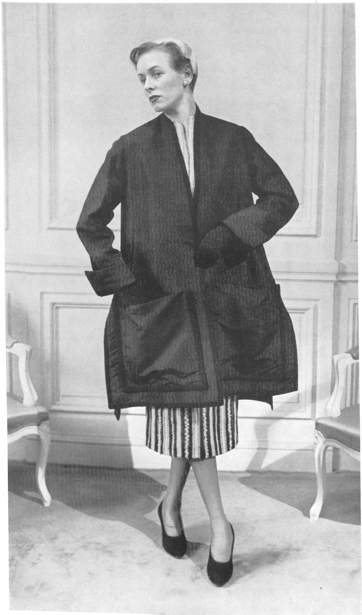
CHRISTIAN DIOR S. A. Stünzi Fils, Horgen