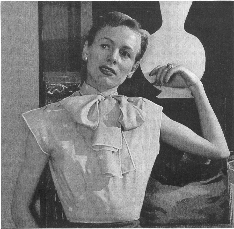
PIERRE BALMAIN L. Abraham & Cie Soieries S. A., Zurich