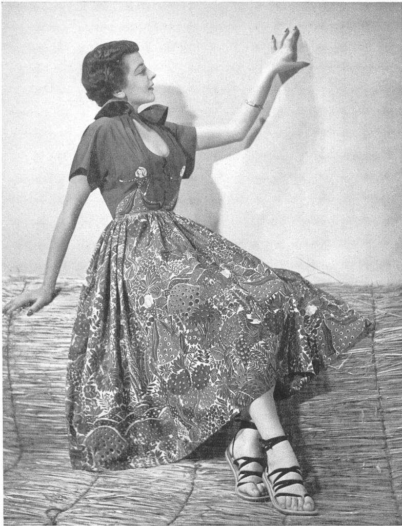
RAPHAEL Rudolf Brauchbar & Cie, Zurich