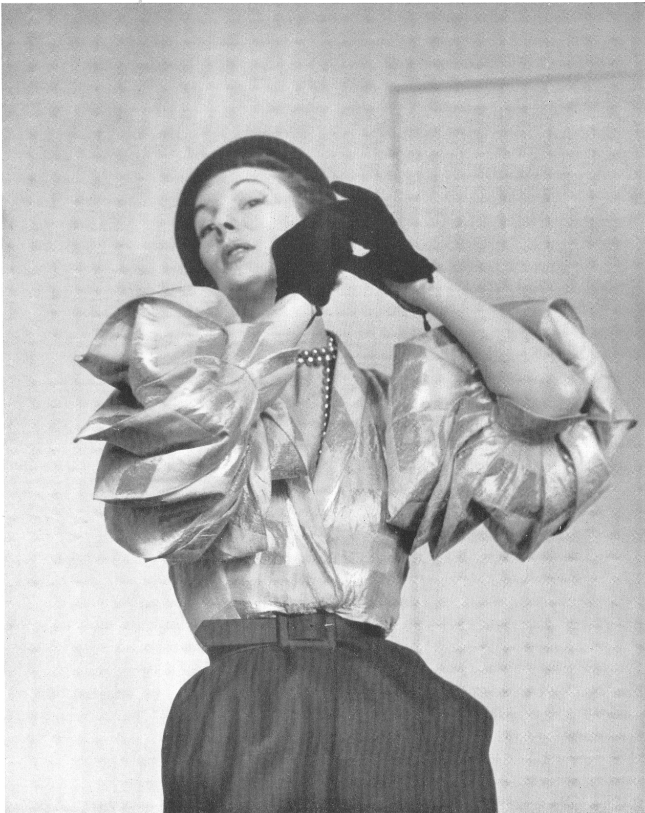
SCHIAPARELLI Heer & Co. S. A., Thalwil INAMO, ZURICH