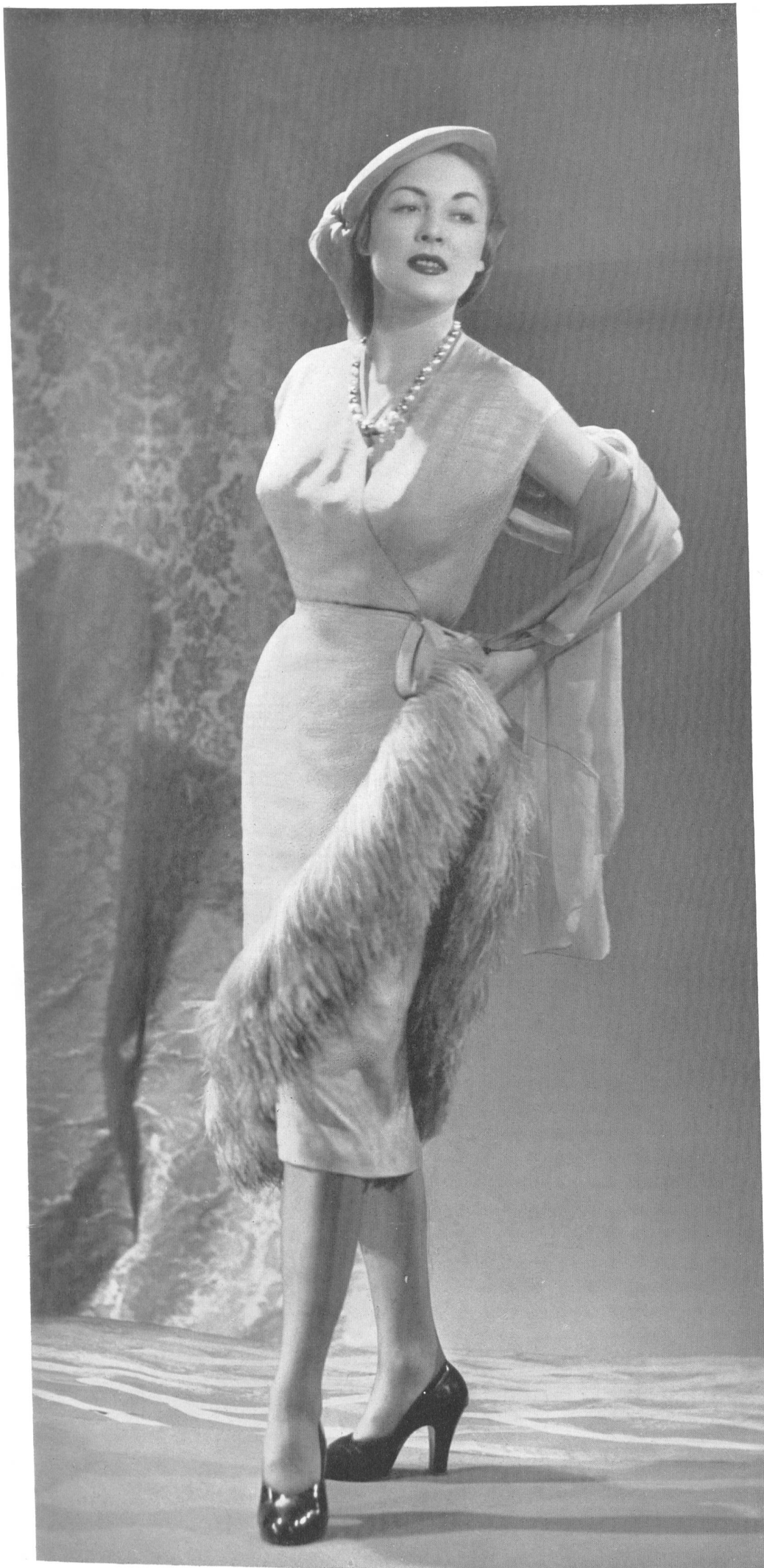
PIERRE BALMAIN Rudolf Brauchbar & Cie, Zurich