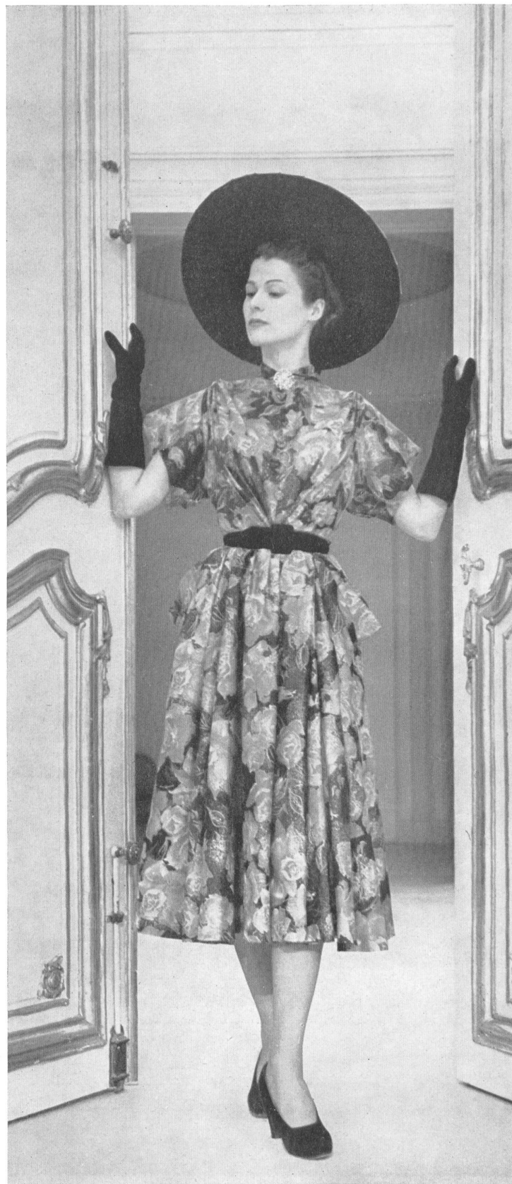
MANGUIN Emar S. A., Zurich INAMO, ZURICH