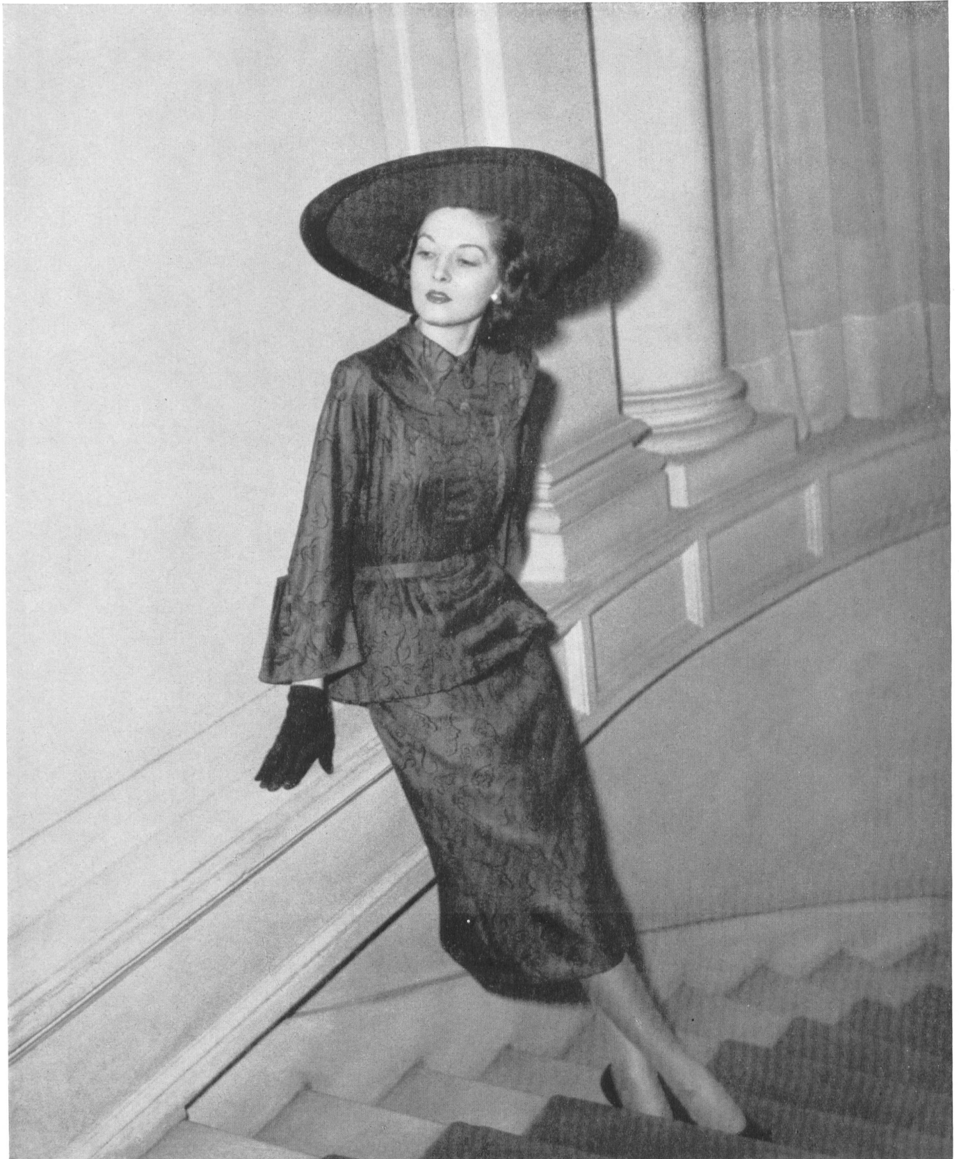
ROBERT PIGUET Rudolf Brauchbar & Cie, Zurich