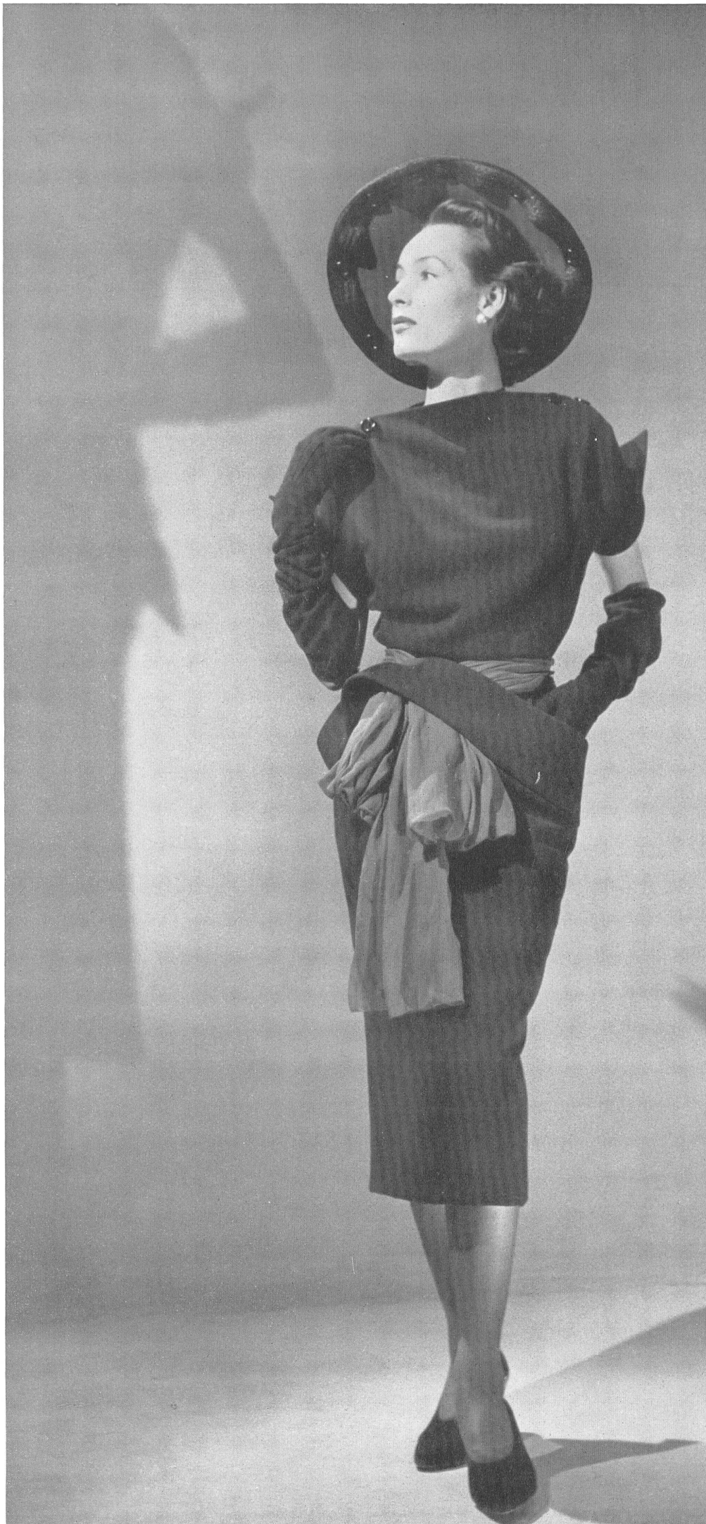
CHRISTIAN DIOR Emar S. A., Zurich INAMO, ZURICH