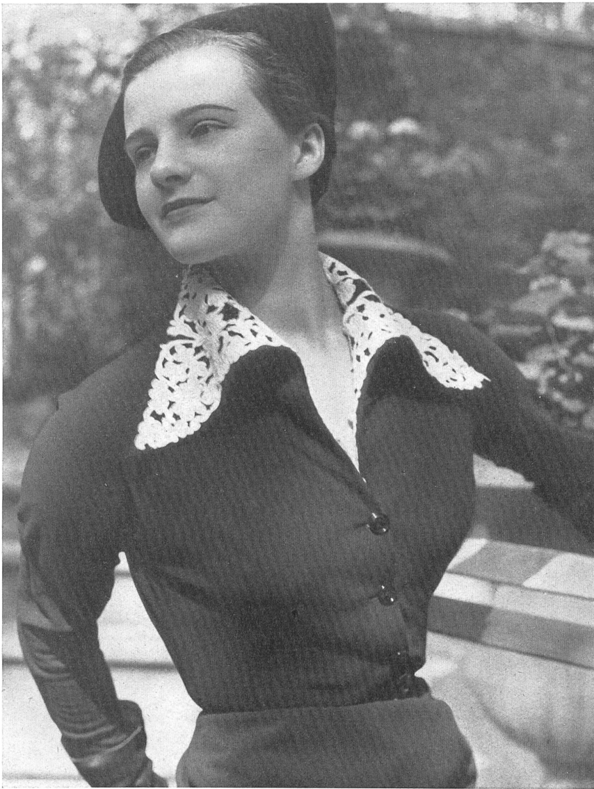
JACQUES FATH Hufenus & Cie, St-Gall PIERRE BRIVET FILS, PARIS