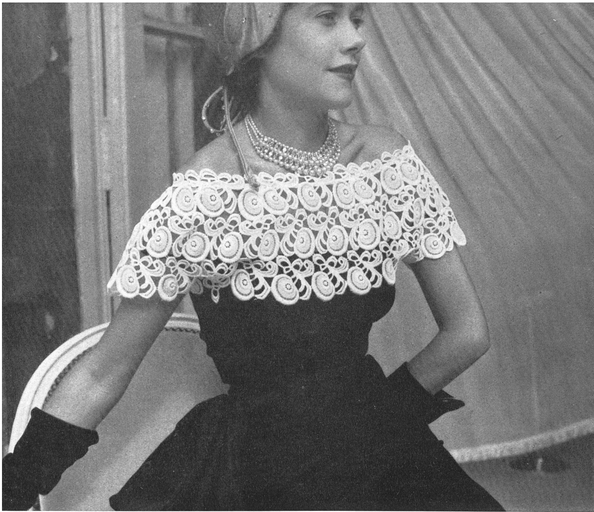
MAGGY ROUFF Union S. A., St-Gall PIERRE BRIVET FILS, PARIS