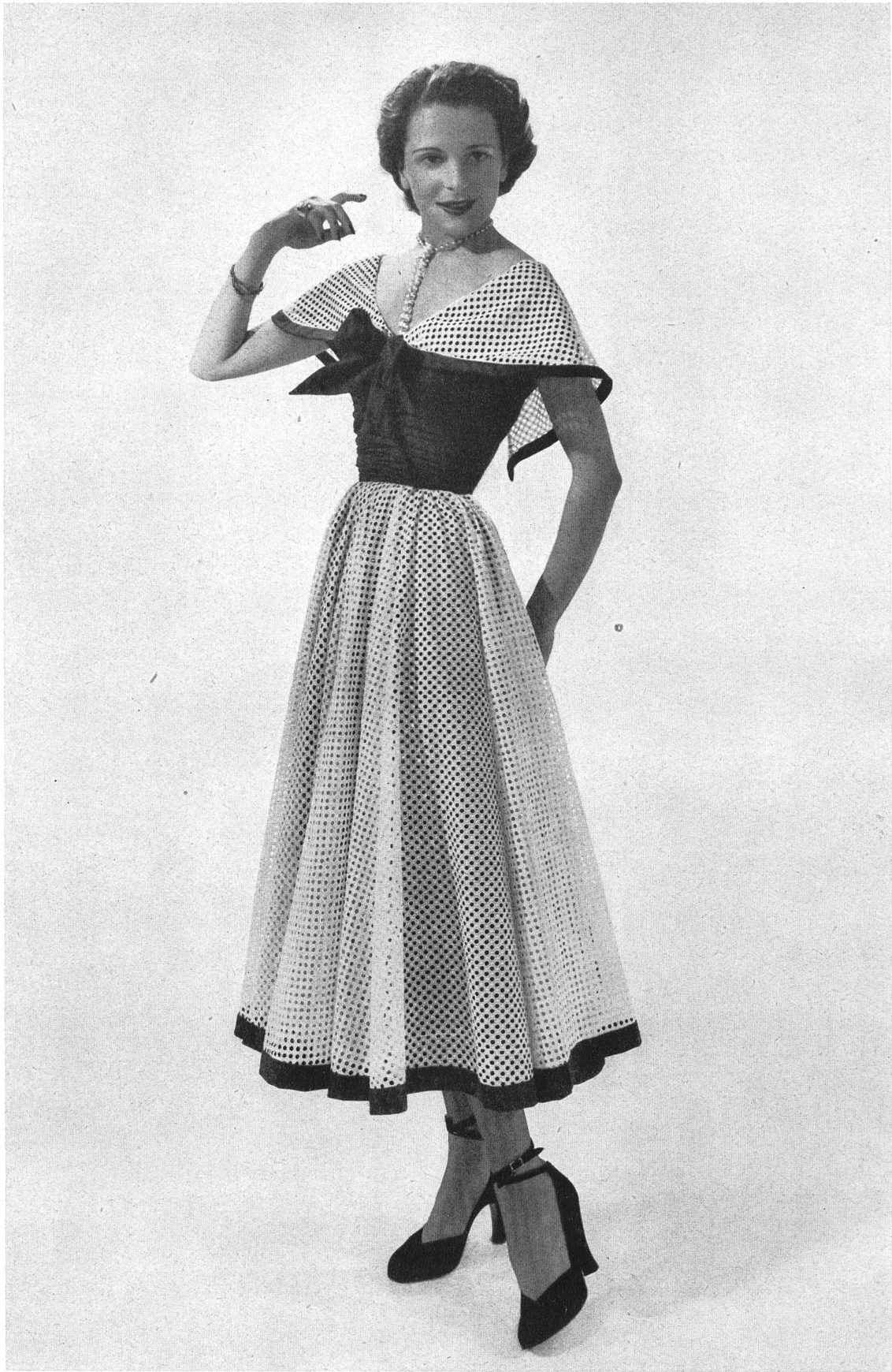
NINA RICCI J. G. Nef & Cie, Hérissau GUITRY, PARIS