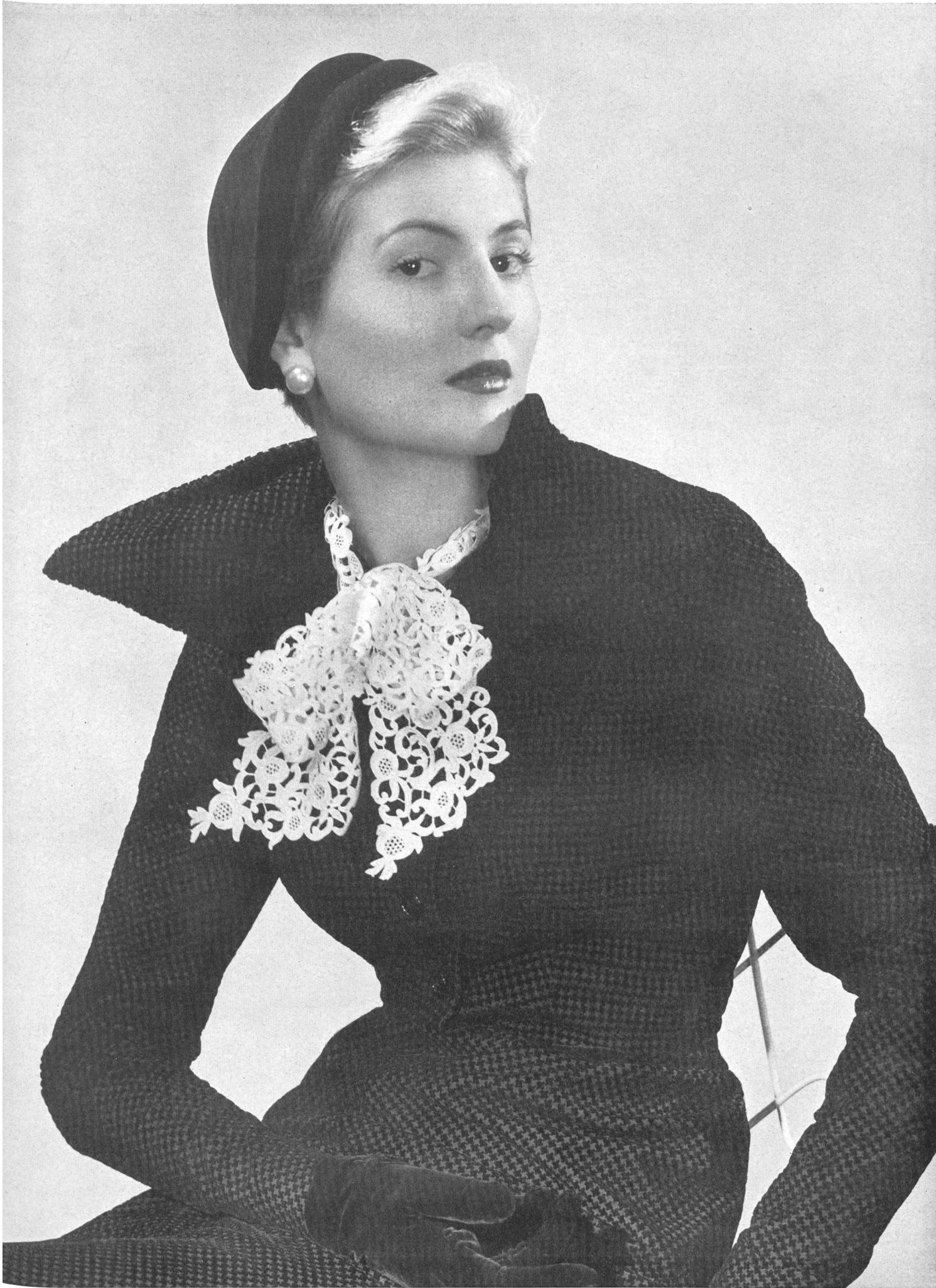
JACQUES FATH Union S. A., St-Gall PIERRE BRIVET FILS, PARIS