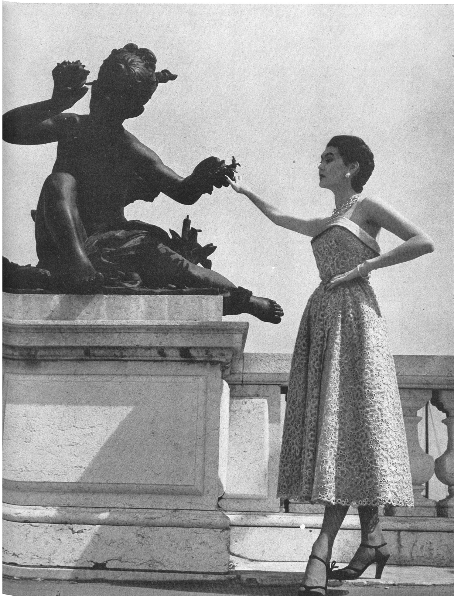
CHRISTIAN DIOR A. Naef & Cie, Flawil INAMO, ZURICH