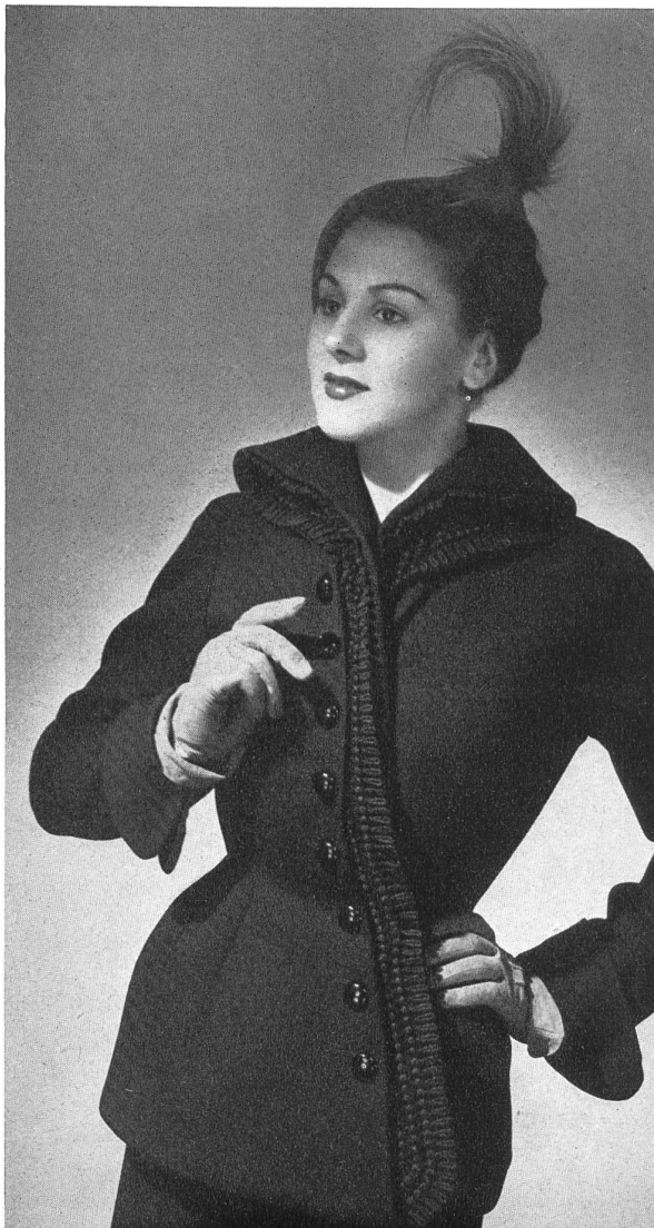
MARCEL ROCHAS Forster Willi & Cie, St-Gall THIÉBAUT-ADAM, PARIS