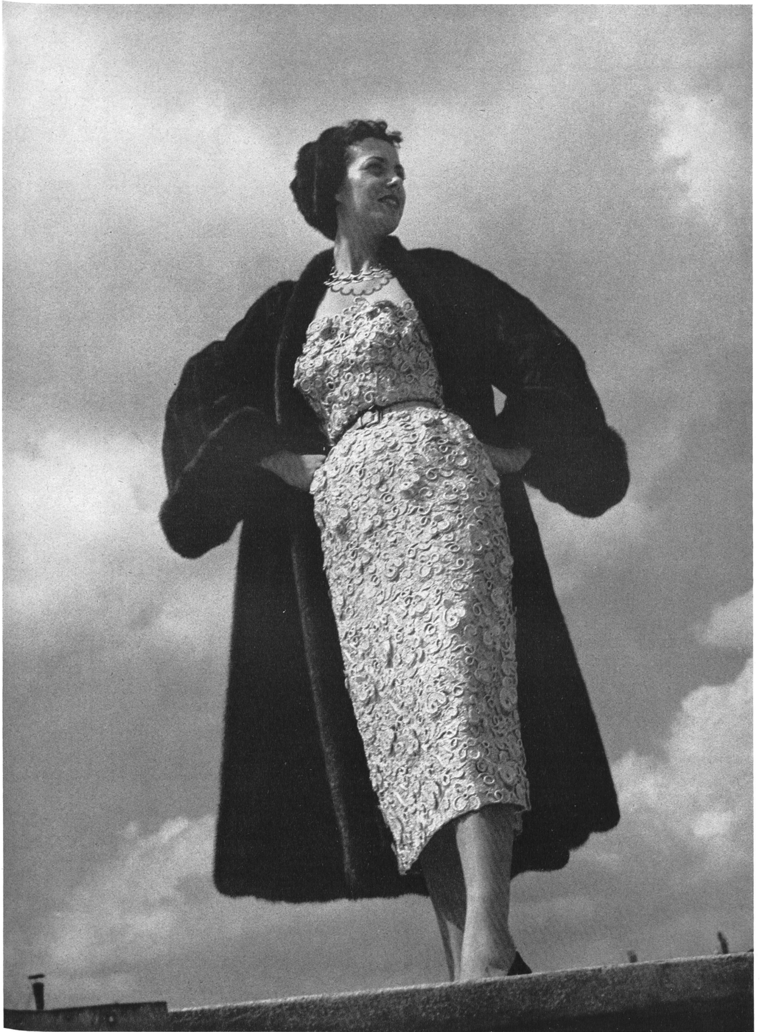
CHRISTIAN DIOR Forster Willi & Cie, St-Gall INAMO, ZURICH