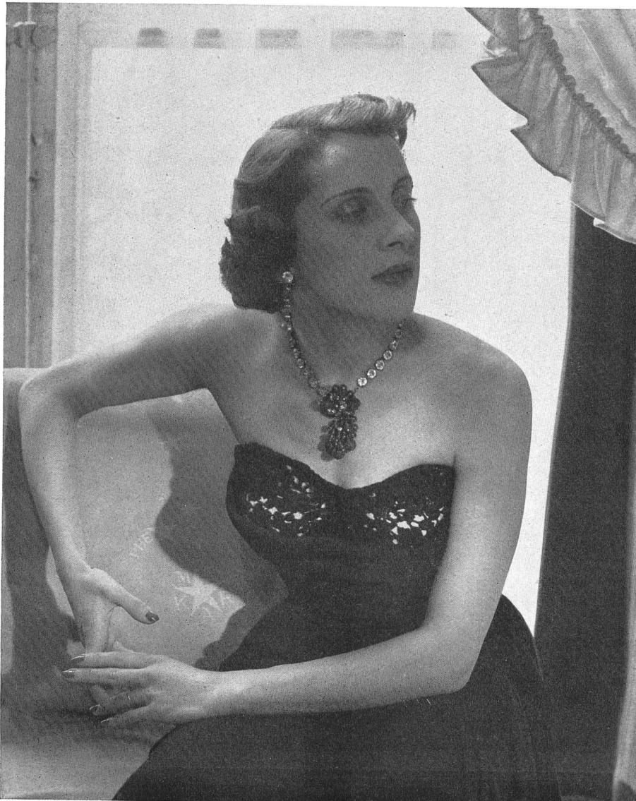
SCHIAPARELLI Walter Schrank & Co., St-Gall THIÉBAUT-ADAM, PARIS