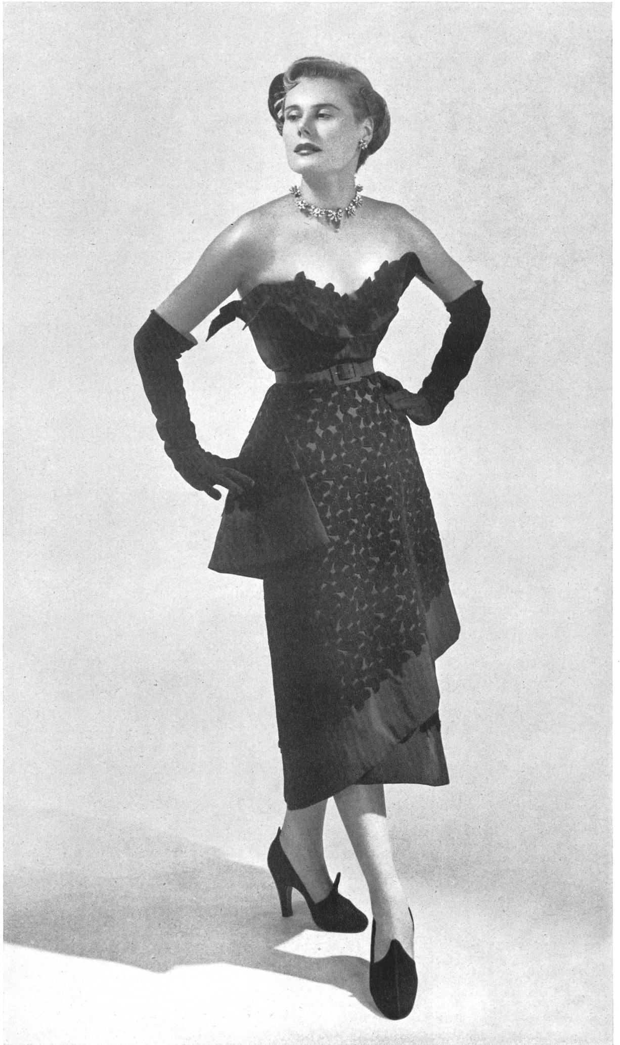
JEAN DESSÈS Forster Willi & Cie, St-Gall THIÉBAUT-ADAM, PARIS