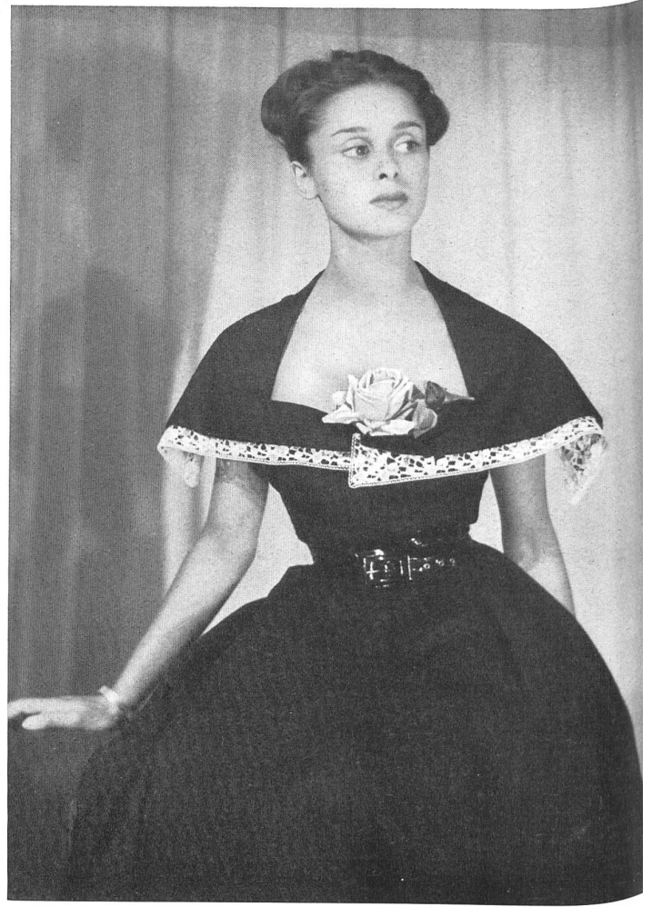
PIERRE BALMAIN Forster Willi & Cie, St-Gall PIERRE BRIVET FILS, PARIS