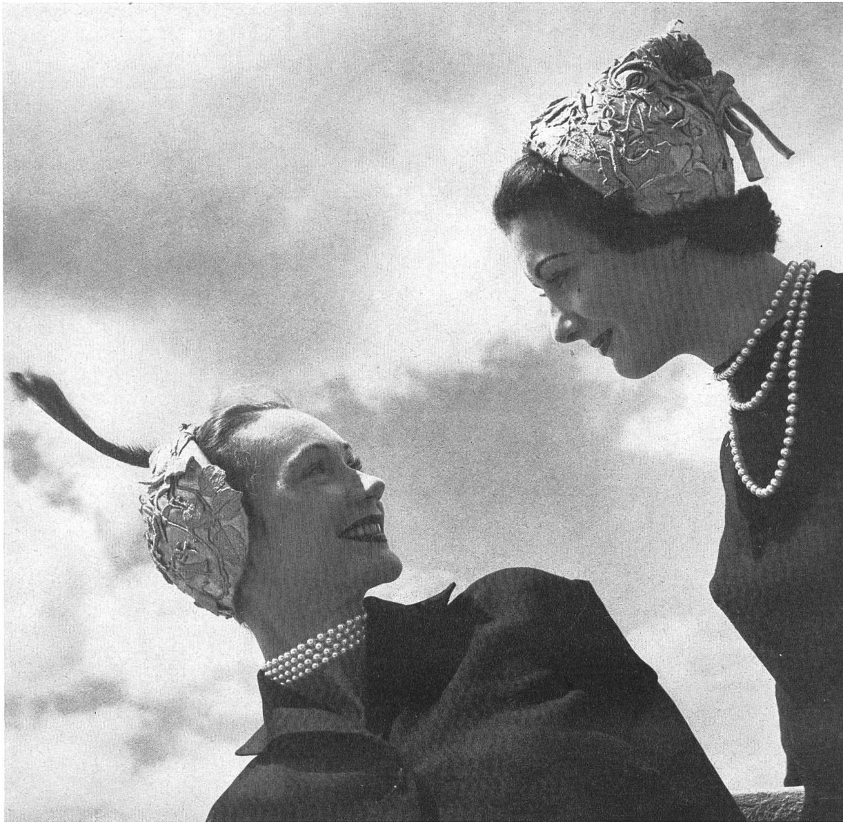
LEGROUX SOEURS Forster Willi & Cie, St-Gall INAMO, ZURICH