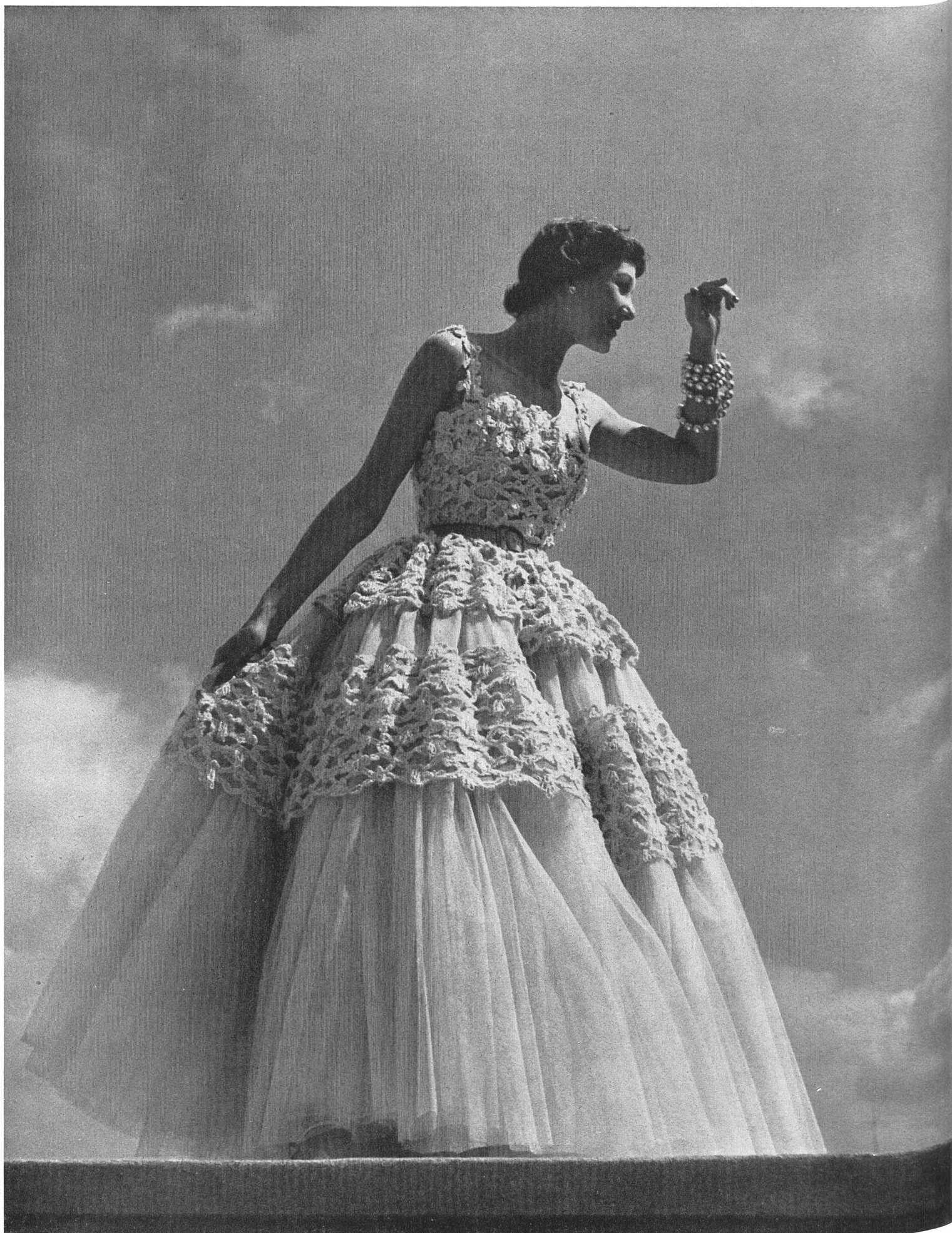
CHRISTIAN DIOR A. Naef & Cie, Flawil INAMO, ZURICH