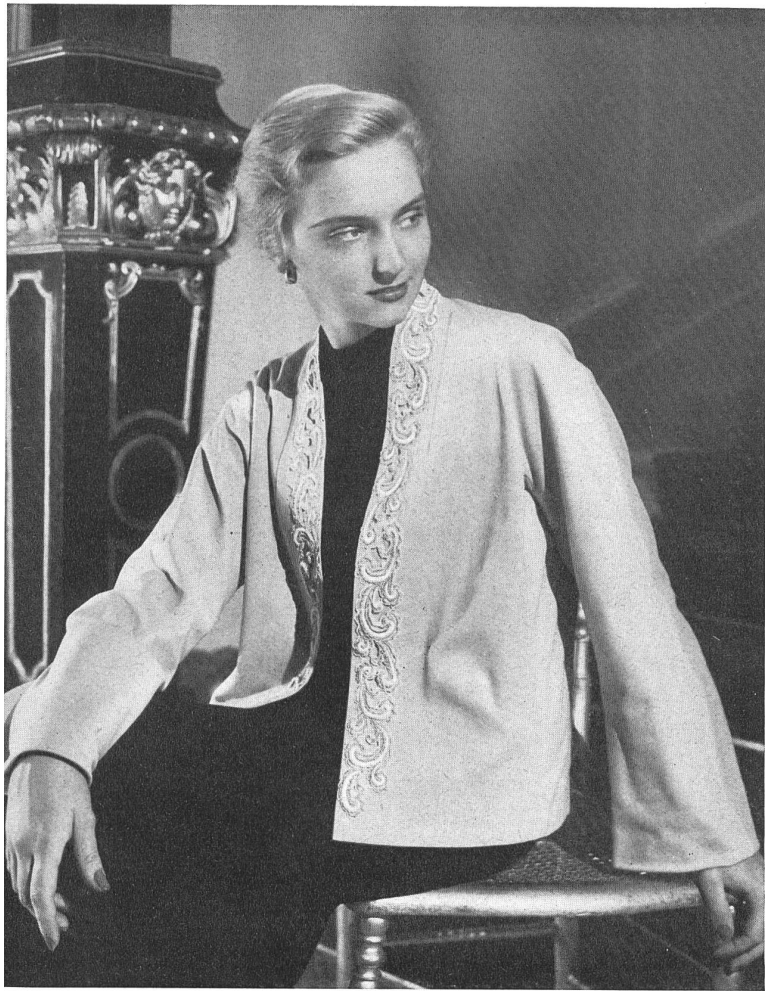
PERLENE Hufenus & Cie, St-Gall PIERRE BRIVET FILS, PARIS