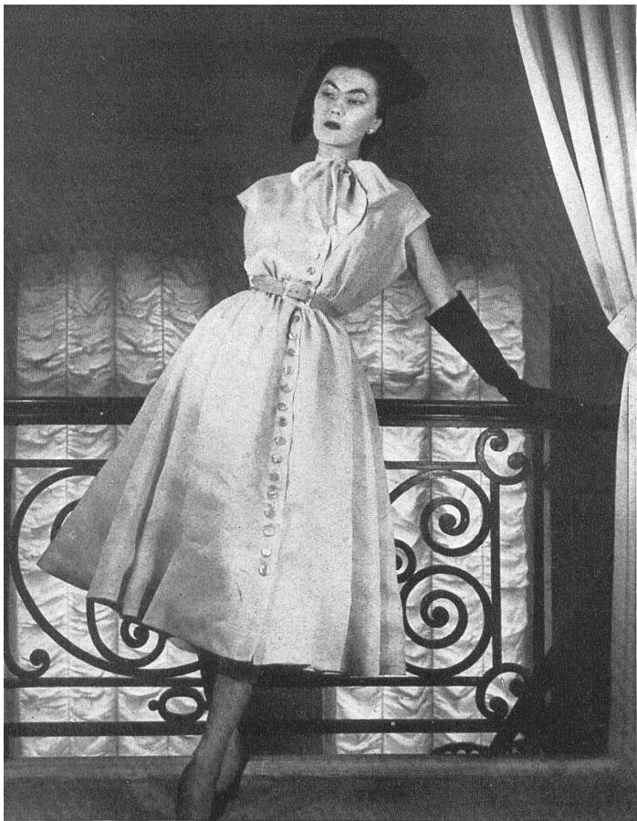
CHRISTIAN DIOR Heer & Cie S. A., Thalwil INAMO, ZURICH