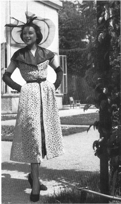
MARCEL ROCHAS Walter Schrank & Cie, St-Gall THIEBAUT-ADAM, PARIS