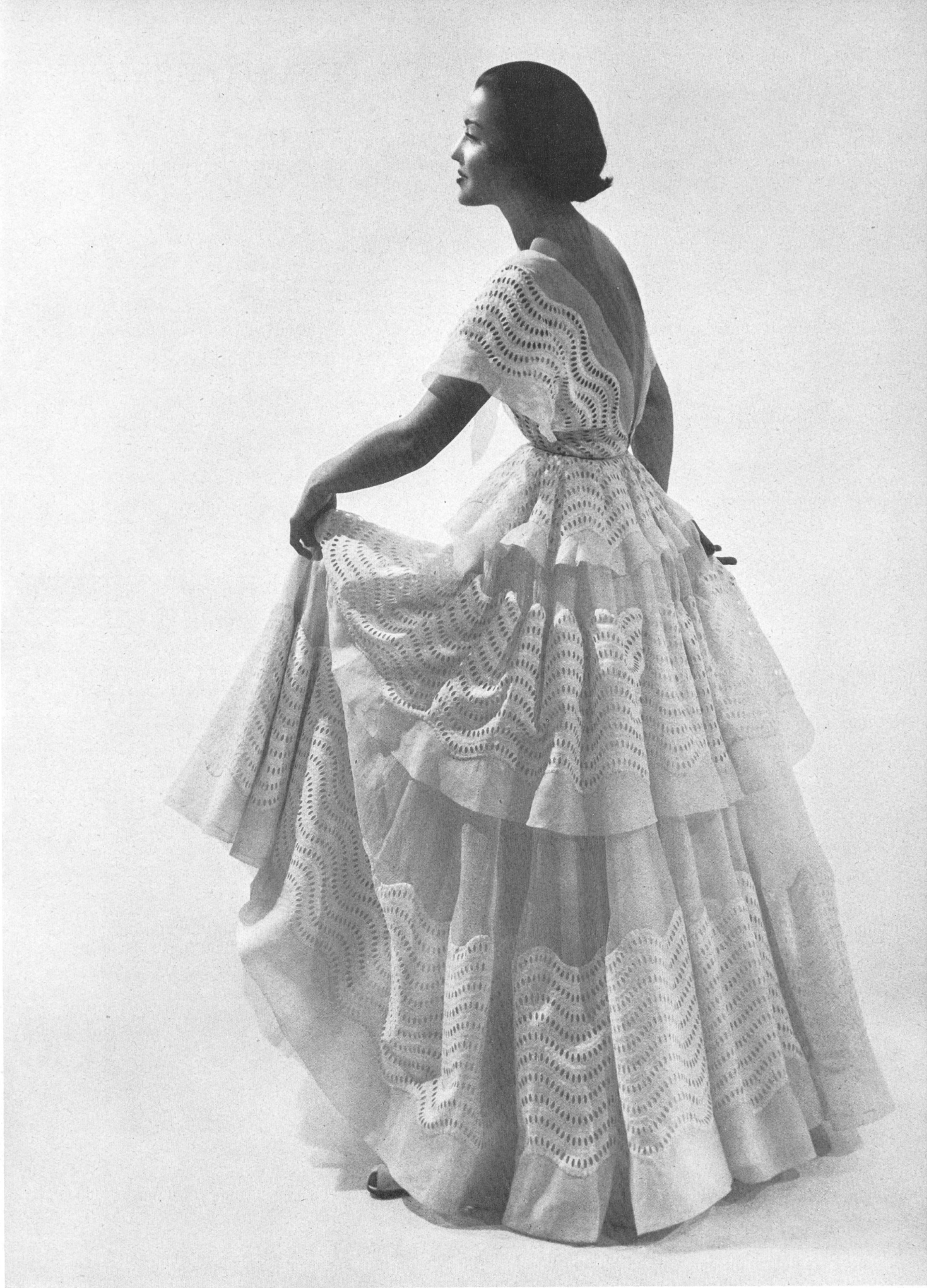
NINA RICCI J. G. Nef & Cie, Hérisau M. GUITRY, PARIS