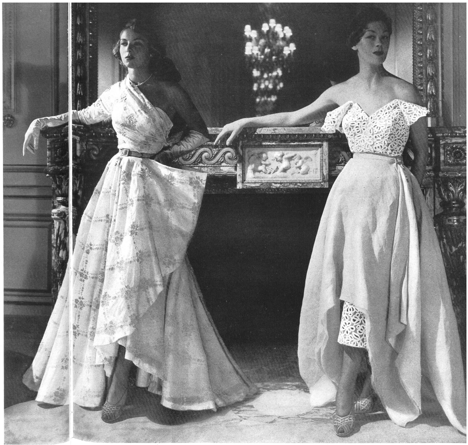
JEAN DESSÈS Walter Stark, St-Gall THIEBAUT-ADAM, PARIS