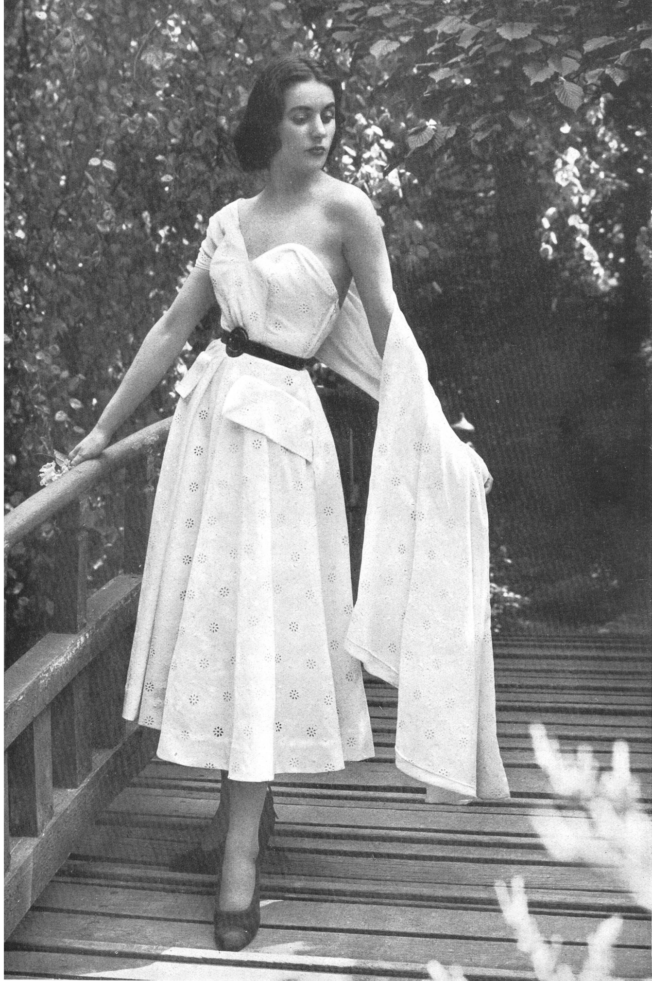
MARCEL ROCHAS Union S. A., St-Gall THIEBAUT-ADAM, PARIS