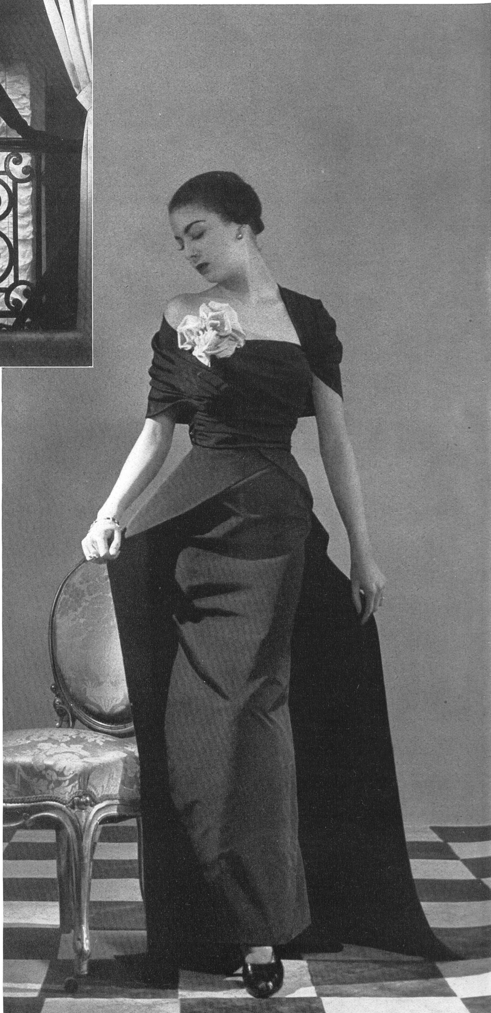
MOLYNEUX L. Abraham & Cie, Soieries S. A., Zurich