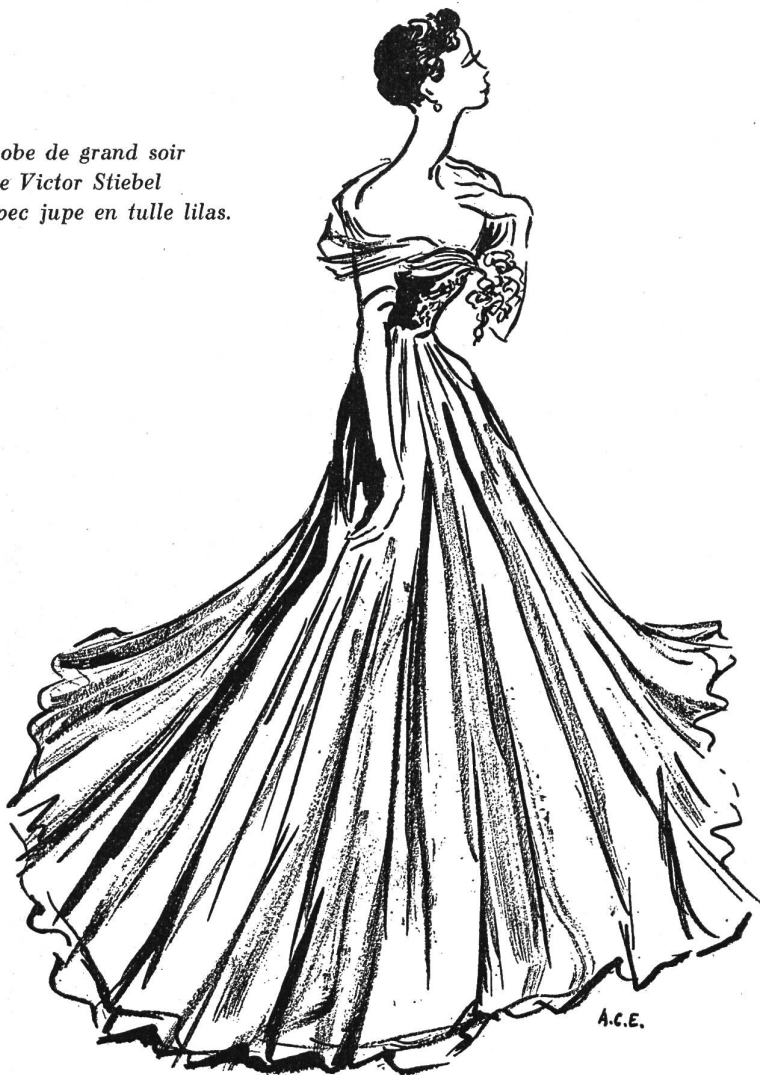
Robe de grand soir de Victor Stiebel avec jupe en tulle lilas.