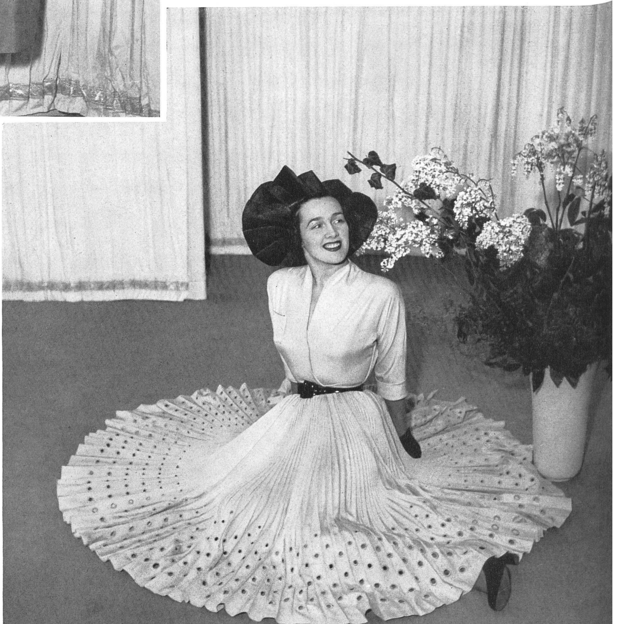
MARCEL ROCHAS Rudolf Brauchbar & Cie, Zurich