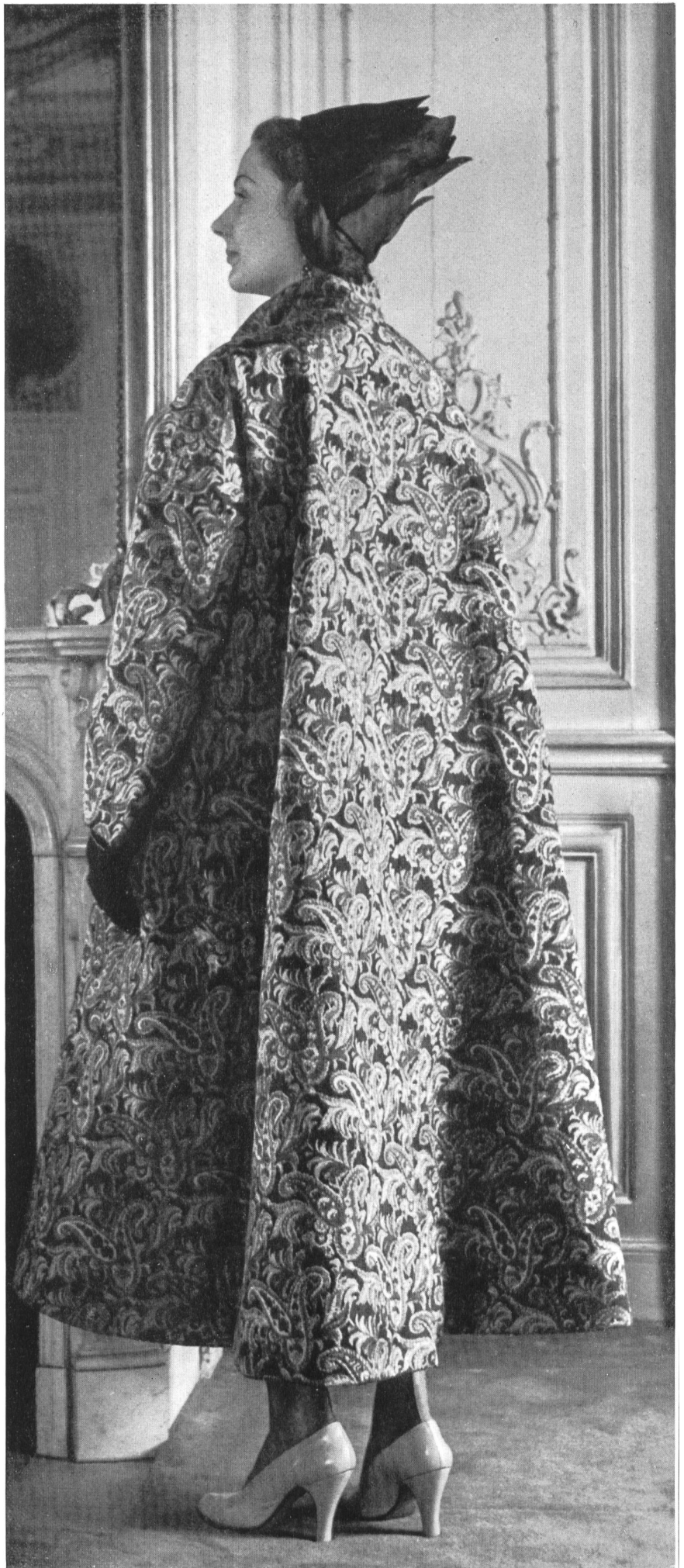
SCHIAPARELLI L. Abraham & Cie, Soieries S. A., Zurich