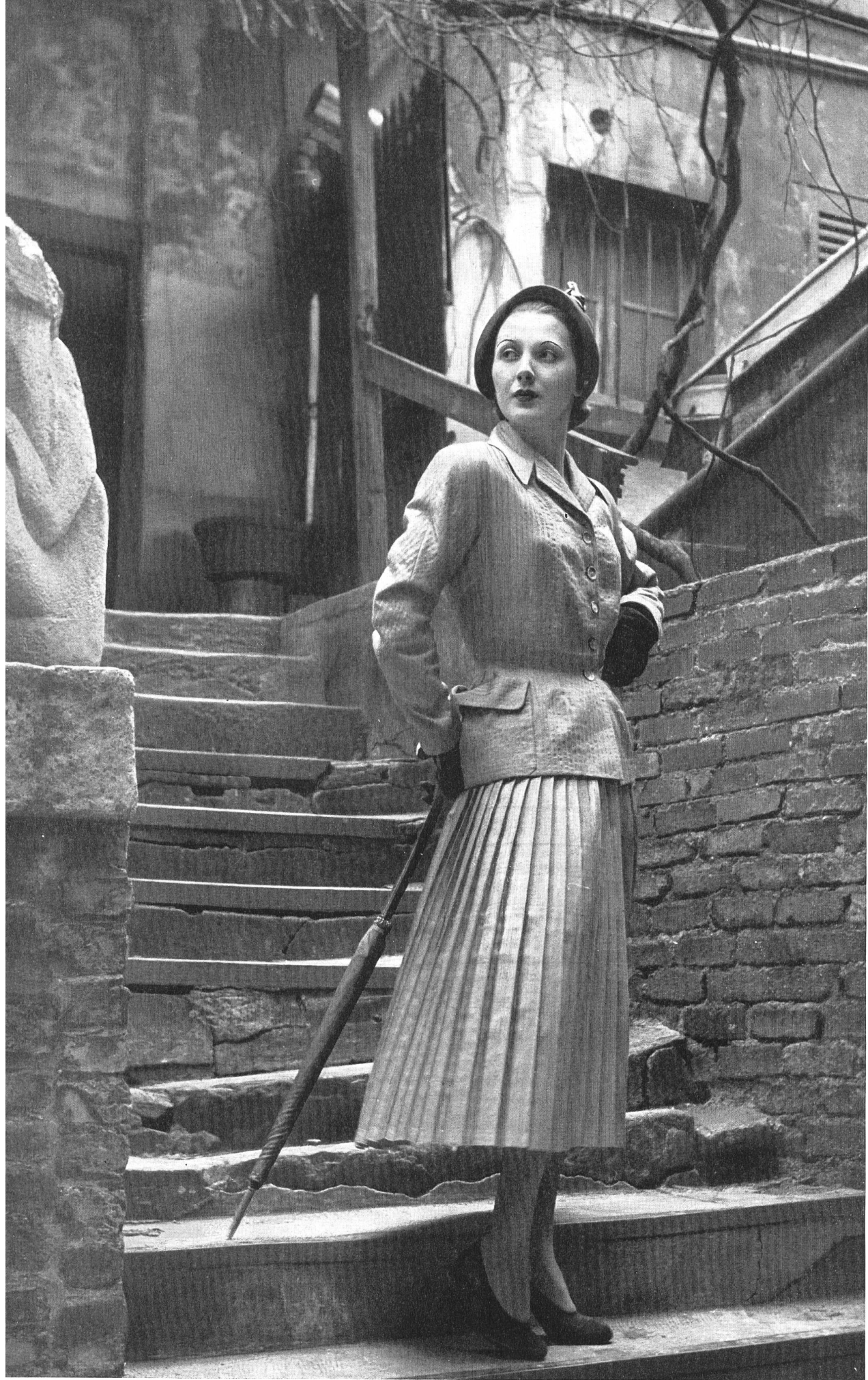
JACQUES GRIFFE L. Abraham & Cie, Soieries S. A., Zurich