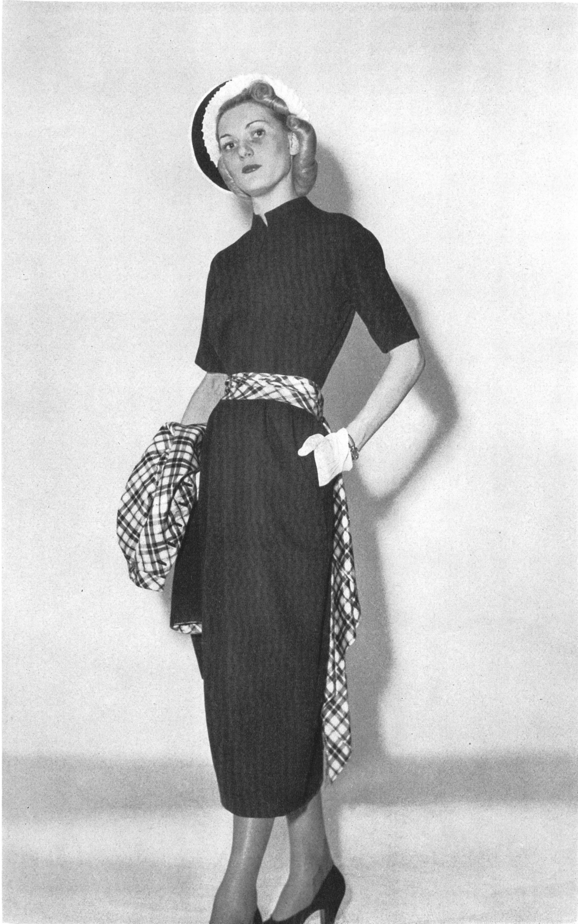
MOLYNEUX Rudolf Brauchbar & Cie, Zurich