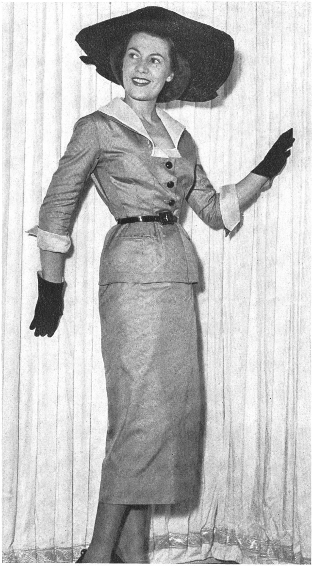
MARCEL ROCHAS Rudolf Brauchbar & Cie, Zurich