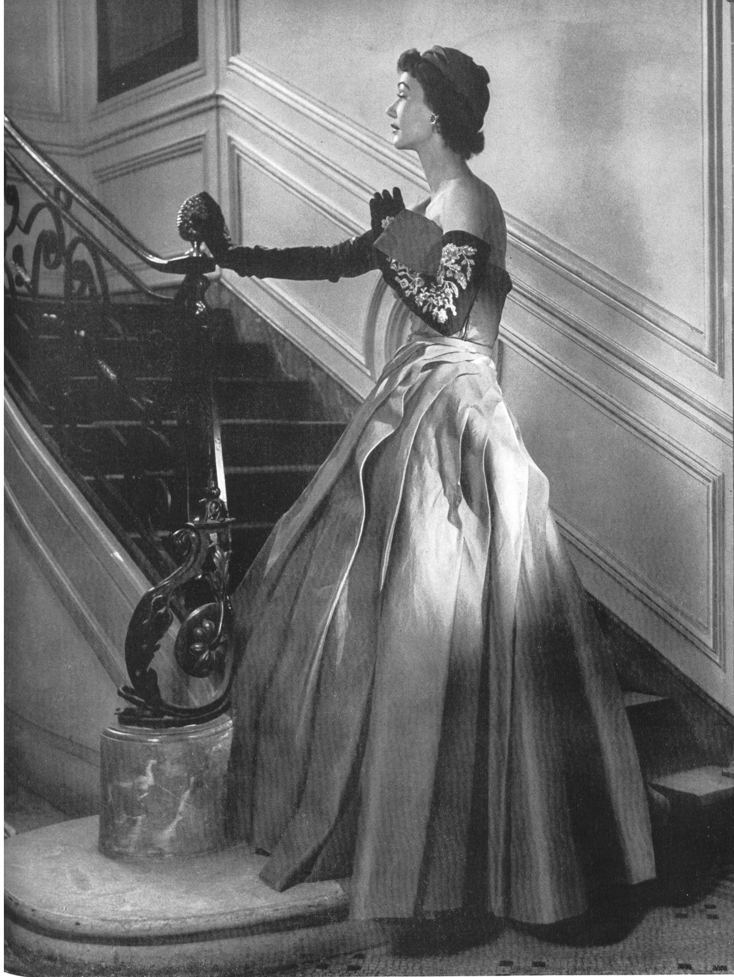
JACQUES FATH L. Abraham & Cie, Soieries S. A., Zurich