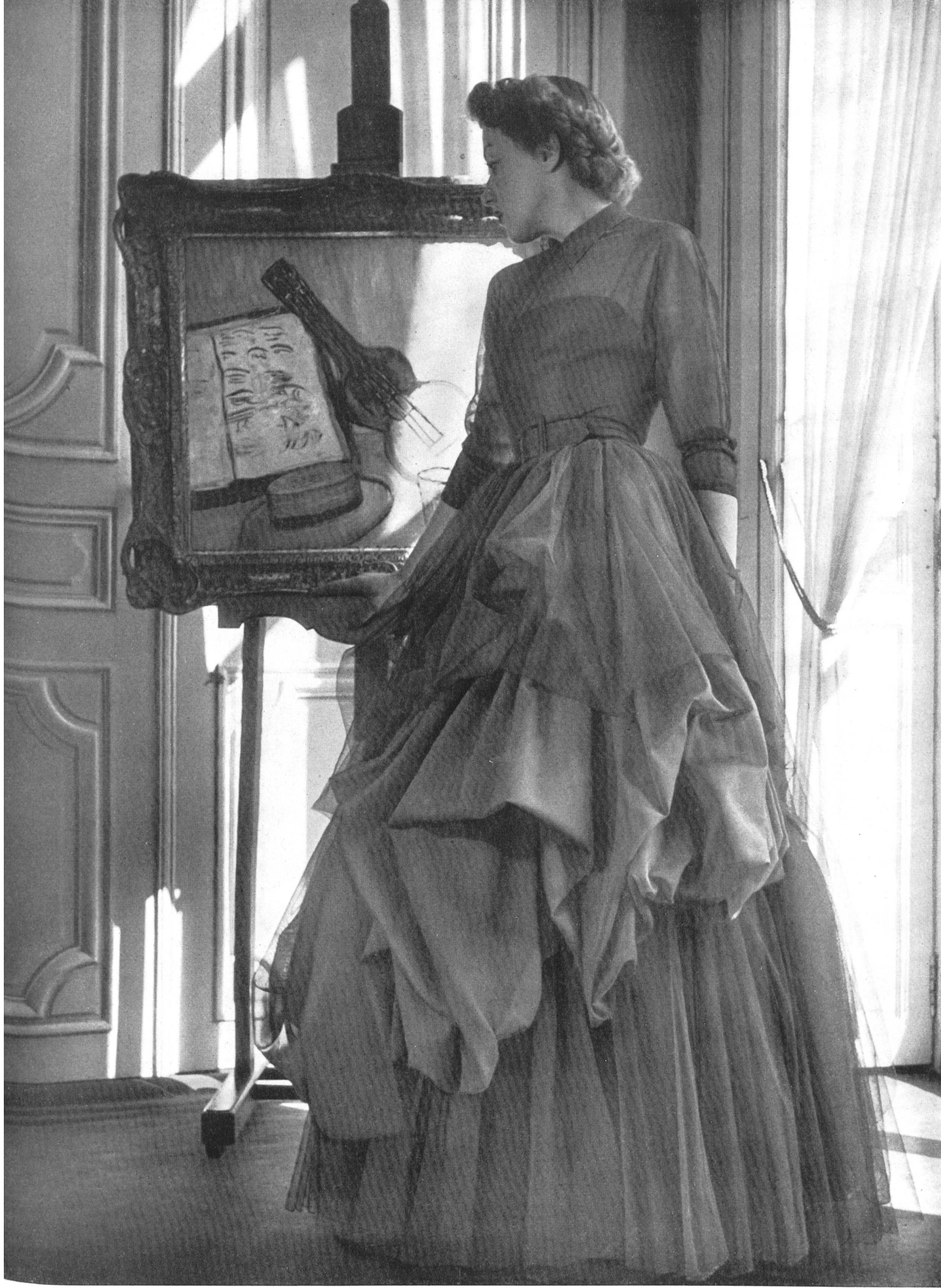
RAPHAEL Heer & Cie S. A., Thalwil INAMO, ZURICH