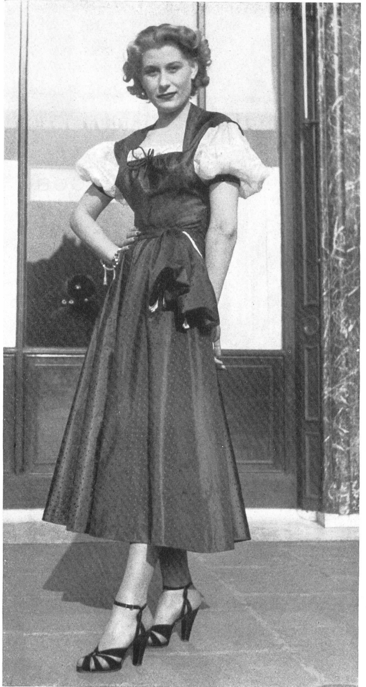
AGNÈS DRECOLL Rudolf Brauchbar & Cie, Zurich