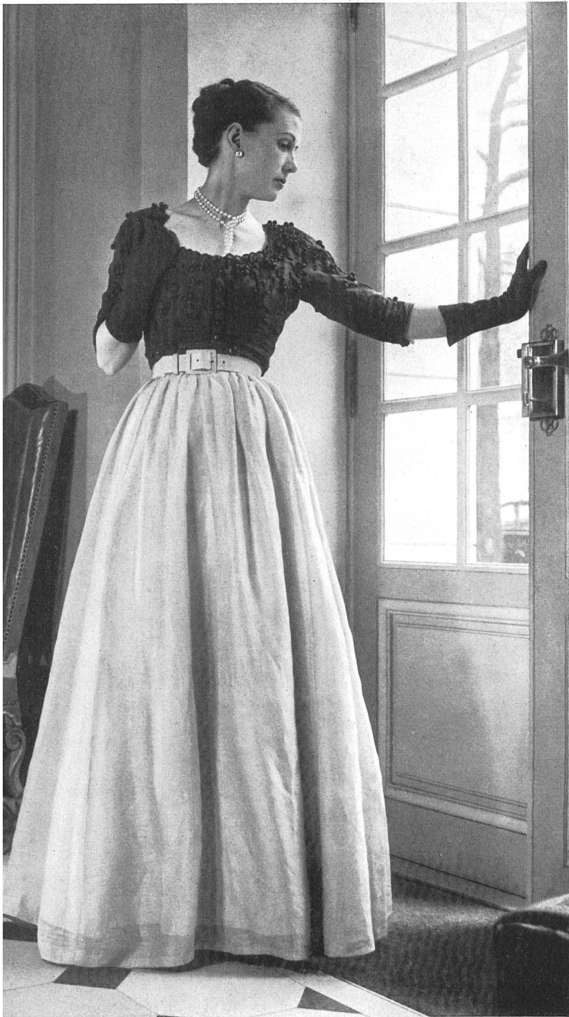
BALENCIAGA Heer & Cie S. A., Thalwil INAMO, ZURICH