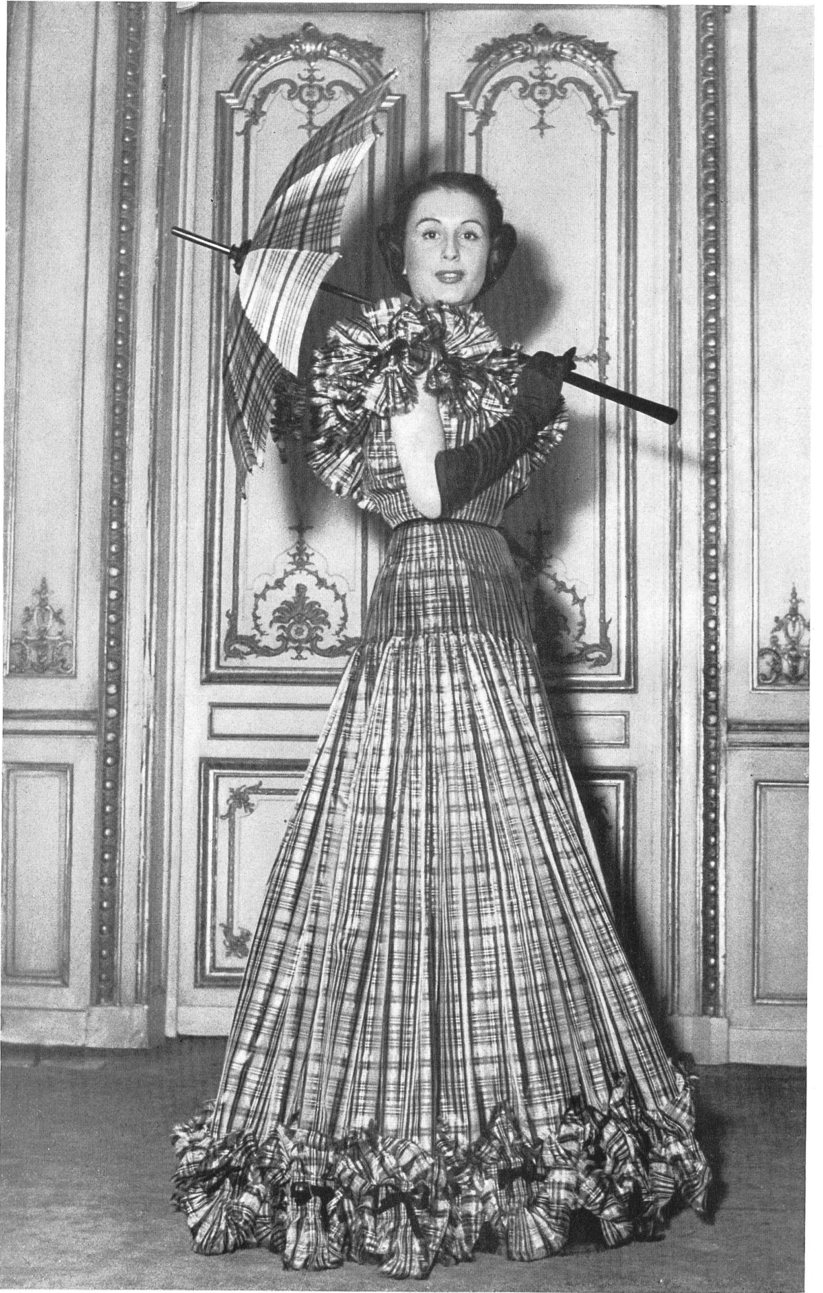
MARTIAL & ARMAND Rudolf Brauchbar & Cie, Zurich