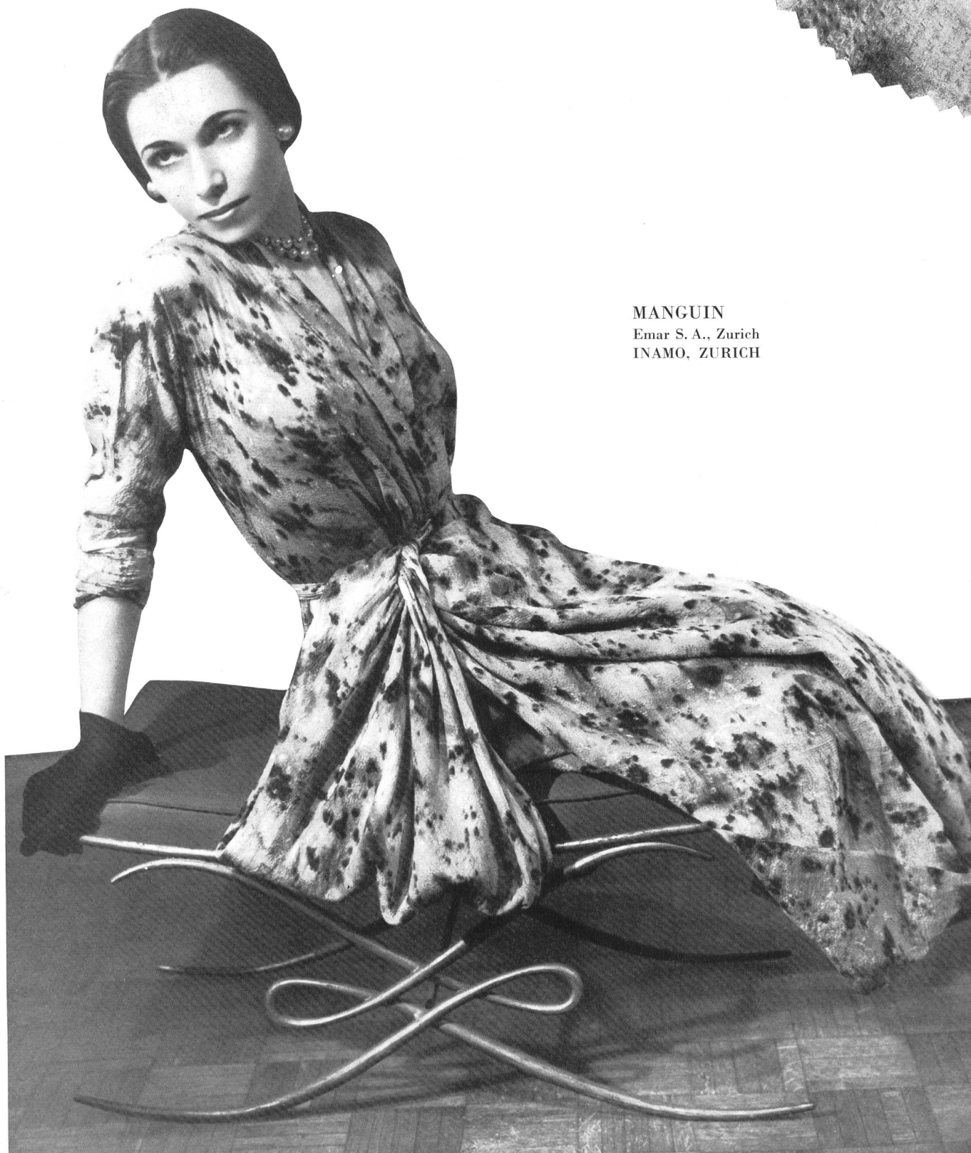
MANGUIN Emar S. A., Zurich INAMO, ZURICH