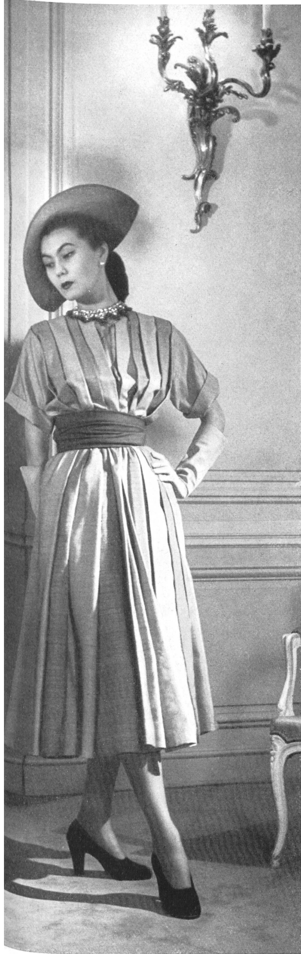
CHRISTIAN DIOR L. Abraham & Cie, Soieries S. A., Zurich