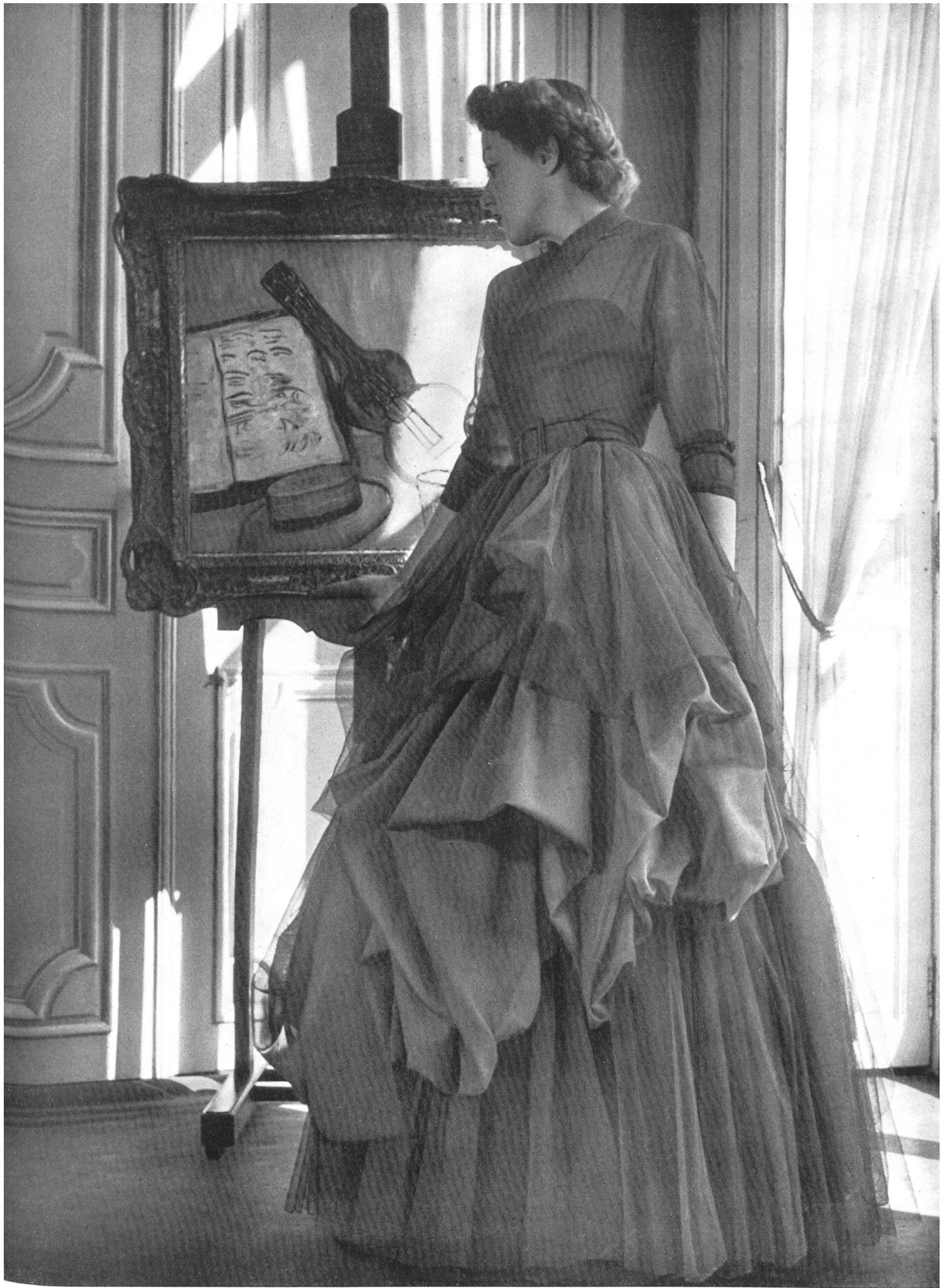
RAPHAEL Heer & Cie S. A., Thalwil INAMO, ZURICH