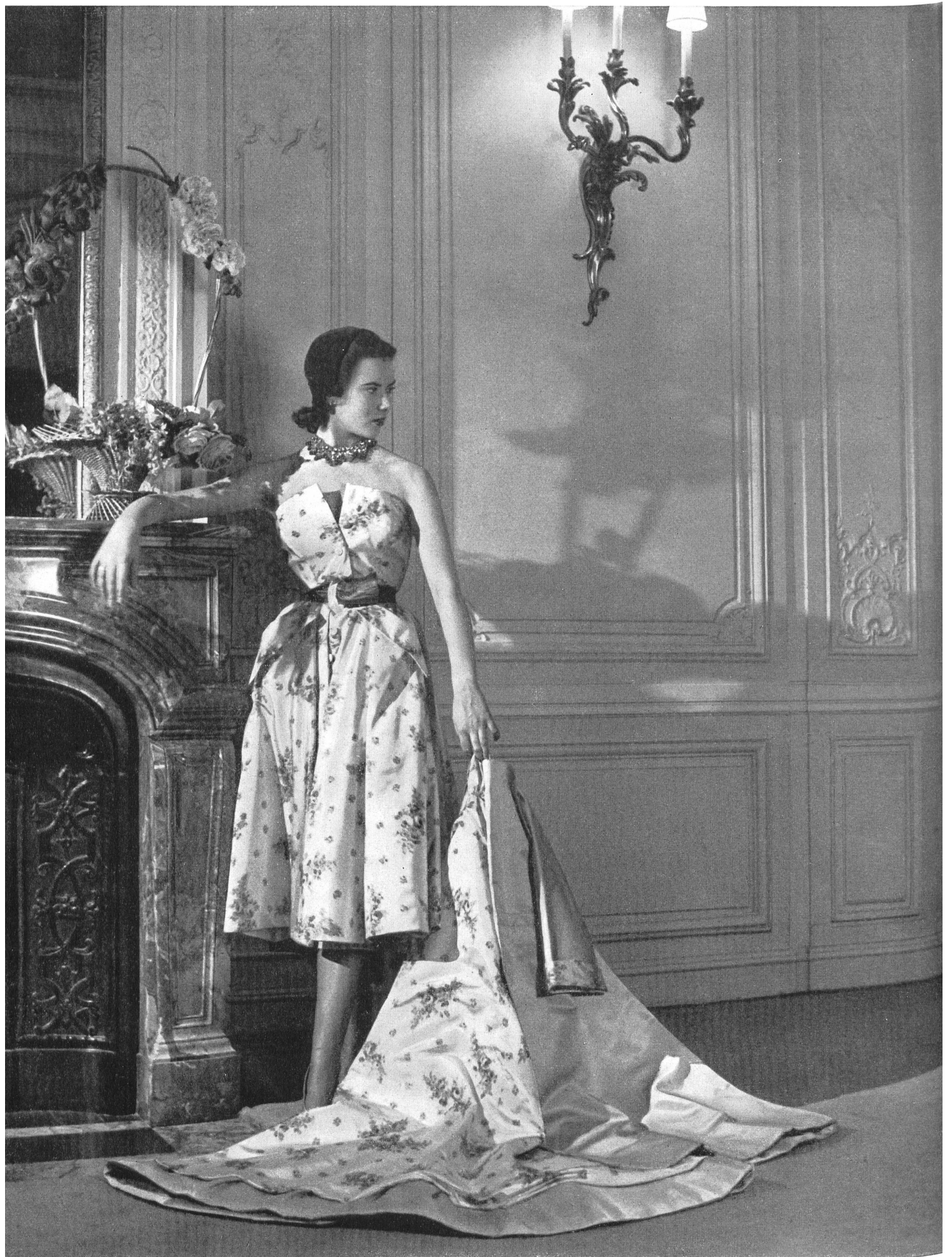
CHRISTIAN DIOR L. Abraham & Cie, Soieries S.A., Zurich