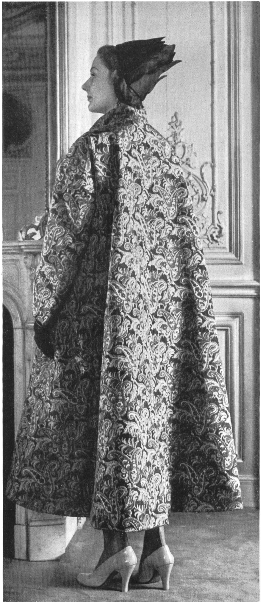
SCHIAPARELLI L. Abraham & Cie, Soieries S. A., Zurich