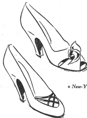
« New-York »