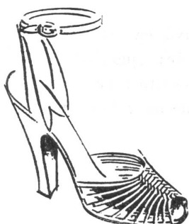
« Paris »