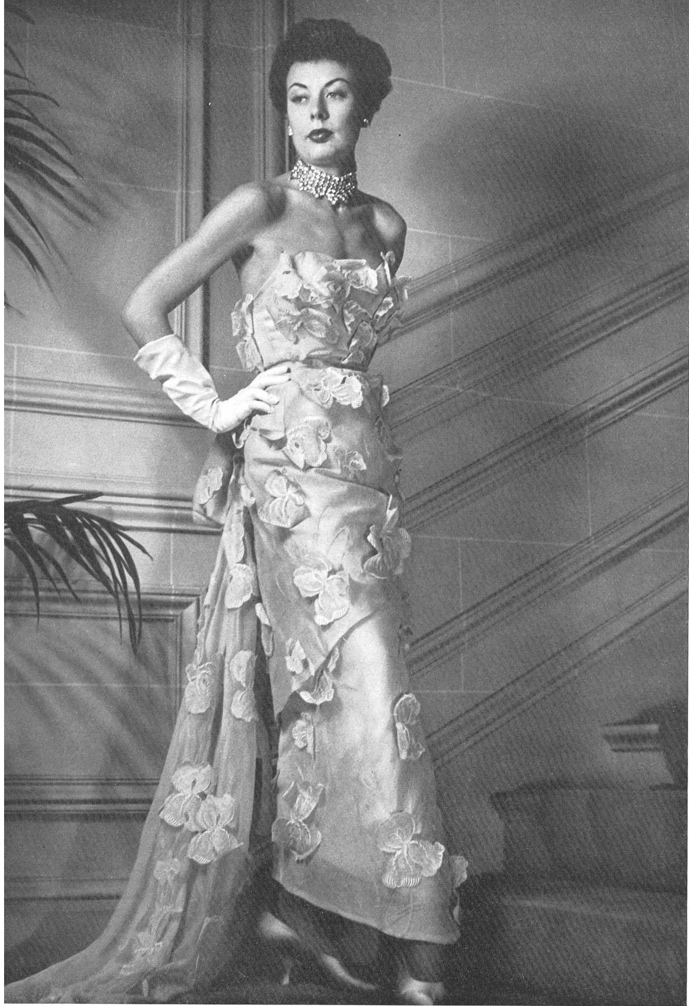
CHRISTIAN DIOR Forster Willi & Cie, St-Gall INAMO, ZURICH