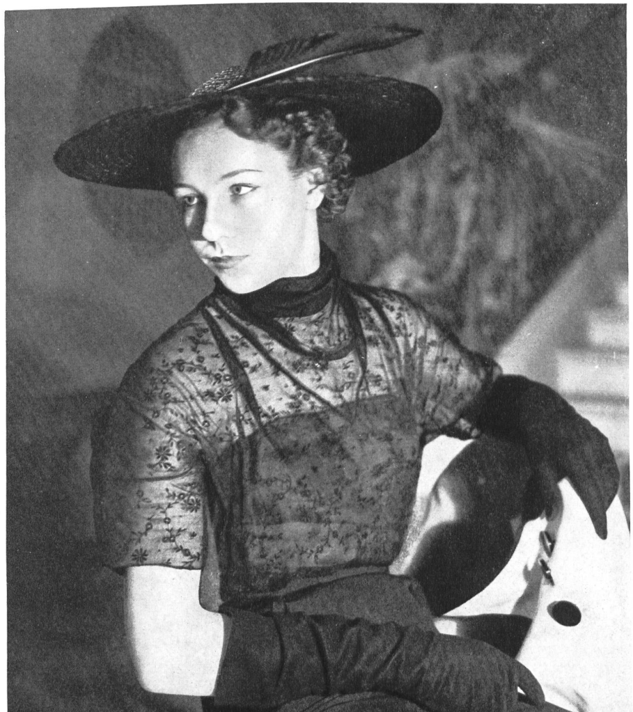
BRUYÈRE Hufenus & Cie, St-Gall THIÉBAUT-ADAM, PARIS