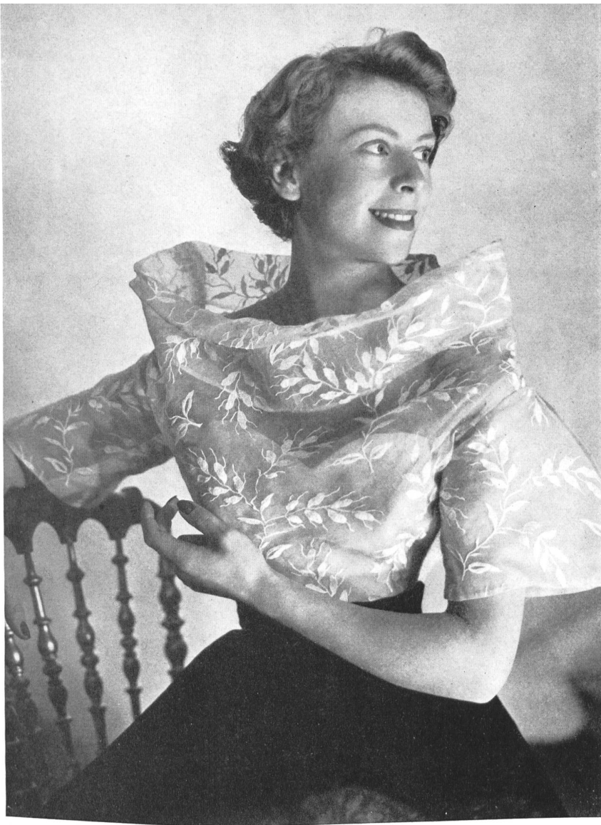
SCHIAPARELLI Aug. Giger & Cie, St-Gall PIERRE BRIVET FILS, PARIS