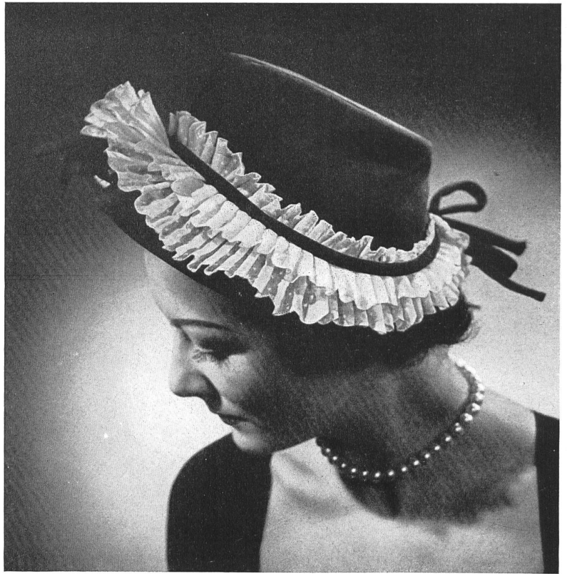
LEGROUX SŒURS A. Næf & Cie, Flawil INAMO, ZURICH