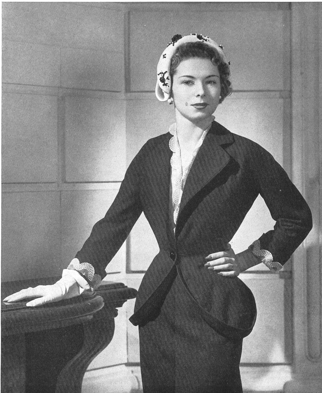
JEAN DESSÈS Hufenus & Cie, St-Gall THIÉBAUT-ADAM, PARIS