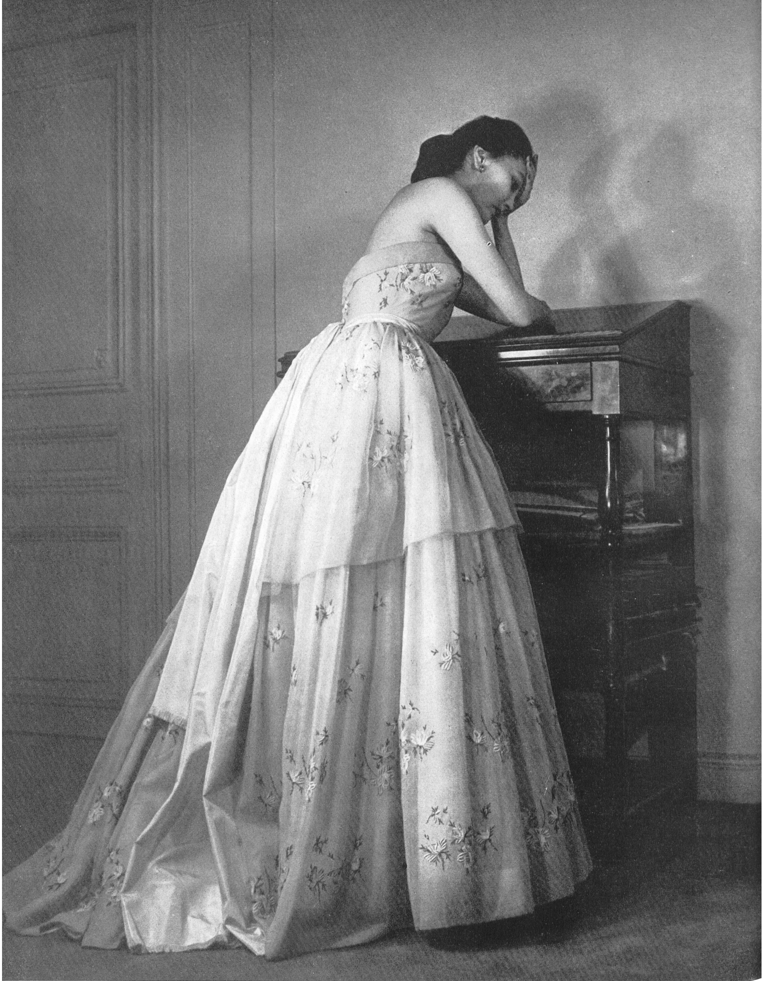
CHRISTIAN DIOR A. Nef & Cie, Flawil INAMO, ZURICH