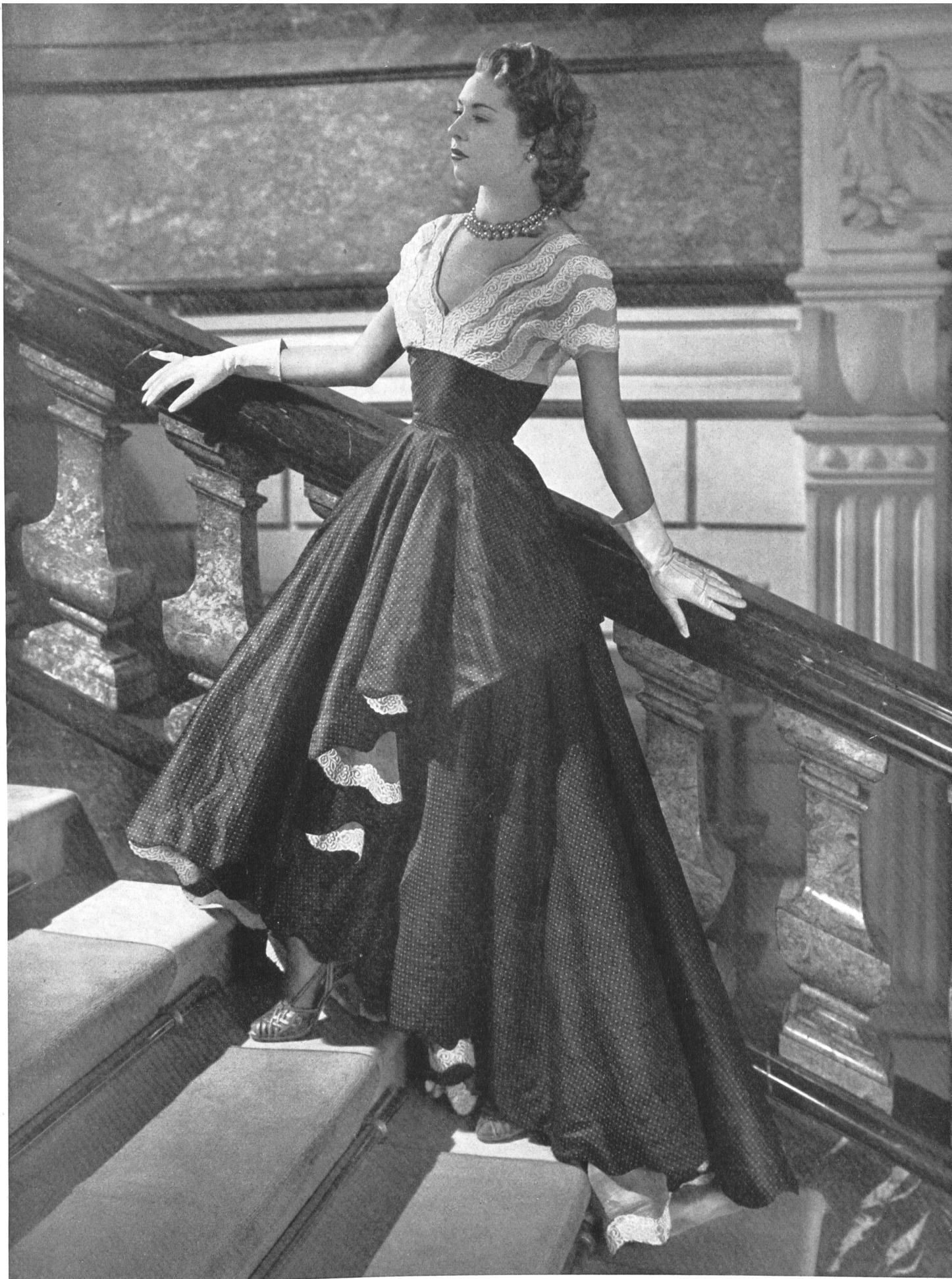
JEAN DESSÈS A. Næf & Cie, Flawil THIÉBAUT-ADAM, PARIS