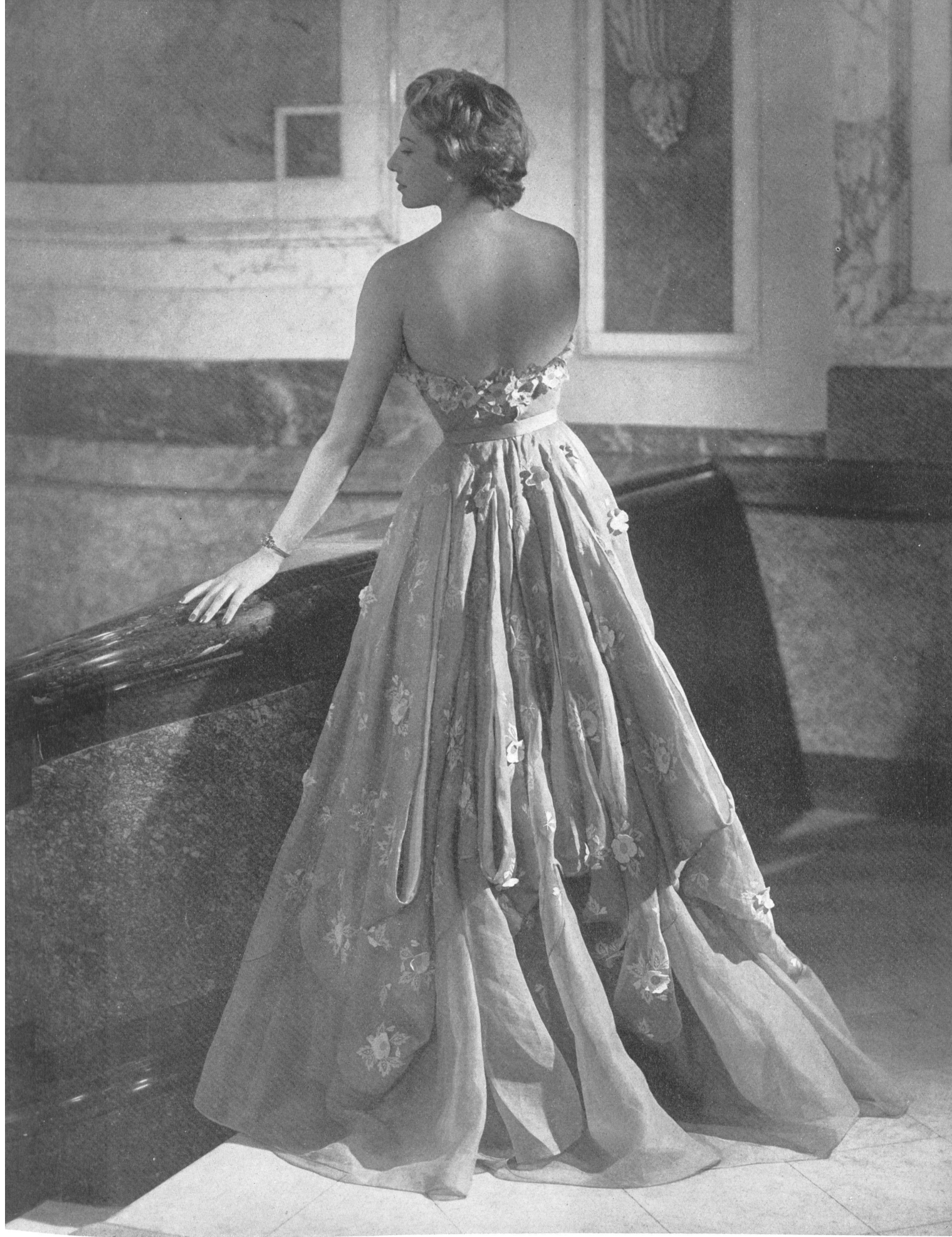
JEAN DESSÈS Union S.A., St-Gall THIÉBAUT-ADAM, PARIS