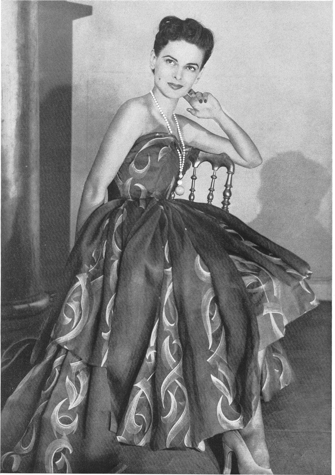
SCHIAPARELLI Forster Willi & Cie, St-Gall INAMO, ZURICH