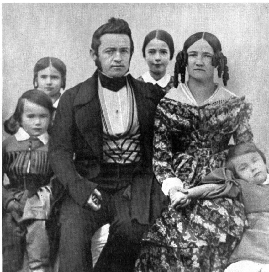
Le premier Président de la Confédération Suisse, Jonas Furrer, entouré de sa famille.

Sans cette neutralité et sans les sacrifices que le peuple suisse consent en faveur de son armée, jamais cette œuvre humanitaire qu'est le Comité international de la Croix-Rouge n'aurait pu naître, à Genève, et n'aurait pu déployer son activité au cours de nombreuses guerres. Il est donc compréhensible que la seconde guerre mondiale ait imposé à la petite Suisse une tâche très lourde : ce pays a recueilli,