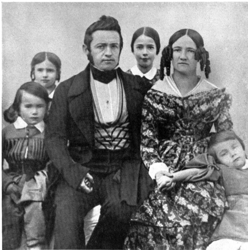
Le premier Président de la Confédération Suisse, Jonas Furrer, entouré de sa famille.

Sans cette neutralité et sans les sacrifices que le peuple suisse consent en faveur de son armée, jamais cette œuvre humanitaire qu'est le Comité international de la Croix-Rouge n'aurait pu naître, à Genève, et n'aurait pu déployer son activité au cours de nombreuses guerres. Il est donc compréhensible que la seconde guerre mondiale ait imposé à la petite Suisse une tâche très lourde : ce pays a recueilli,