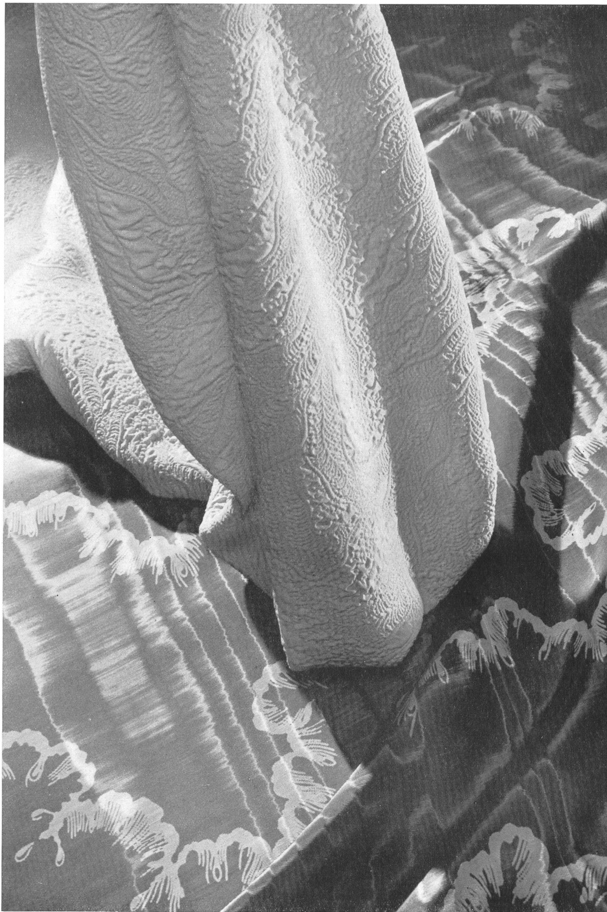
Tissages de soieries ci-devant Näf Frères S. A., Zurich. Crêpe Diana. Faille moirée imprimée. Crepe Diana. Printed moiré faille. Crespón Diana. Faya moaré estampada. Crêpe Diana. Faille moirée bedruckt.