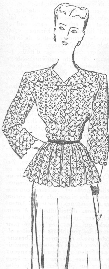
Casaque de guipure suisse, portée sur une jupe de jersey rayonne noire.