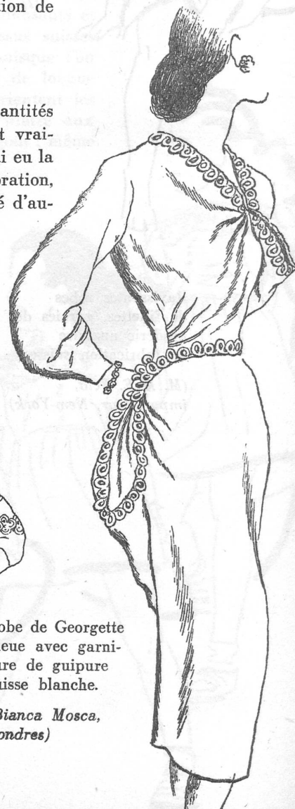
Robe de Georgette bleue avec garni- ture de guipure suisse blanche.